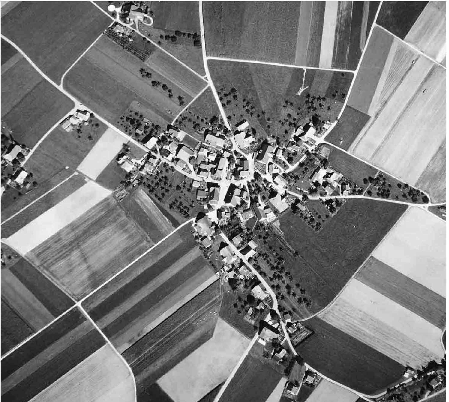
Flugbild 1988

Kleines Ackerbauerndorf am Rand des Rapperswiler Plateaus, umgeben von Obstbaumkranz und fruchtbaren Feldern. Grossvolumige Höfe mit hohen Krüppelwalmdächern, in der Ortsmitte aussergewöhnlich intakter Dorfplatz, einer der besten der Region.