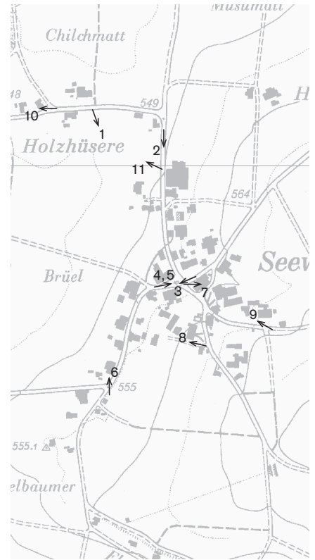
Fotostandorte 1: 10 000 Aufnahmen 1981: 4, 6-11 Aufnahmen 1994: 1-3, 5