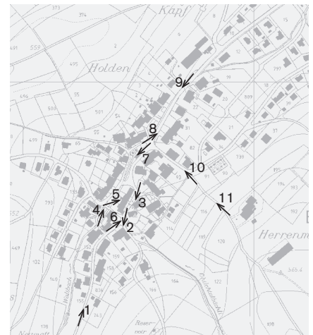
Plangrundlage: Übersichtsplan UP5000, Geodaten des Kantons Basel-Landschaft, © Amt für Geoinformation des Kantons Basel-Landschaft Fotostandorte 1: 10 000 Aufnahmen 2003: 1-11