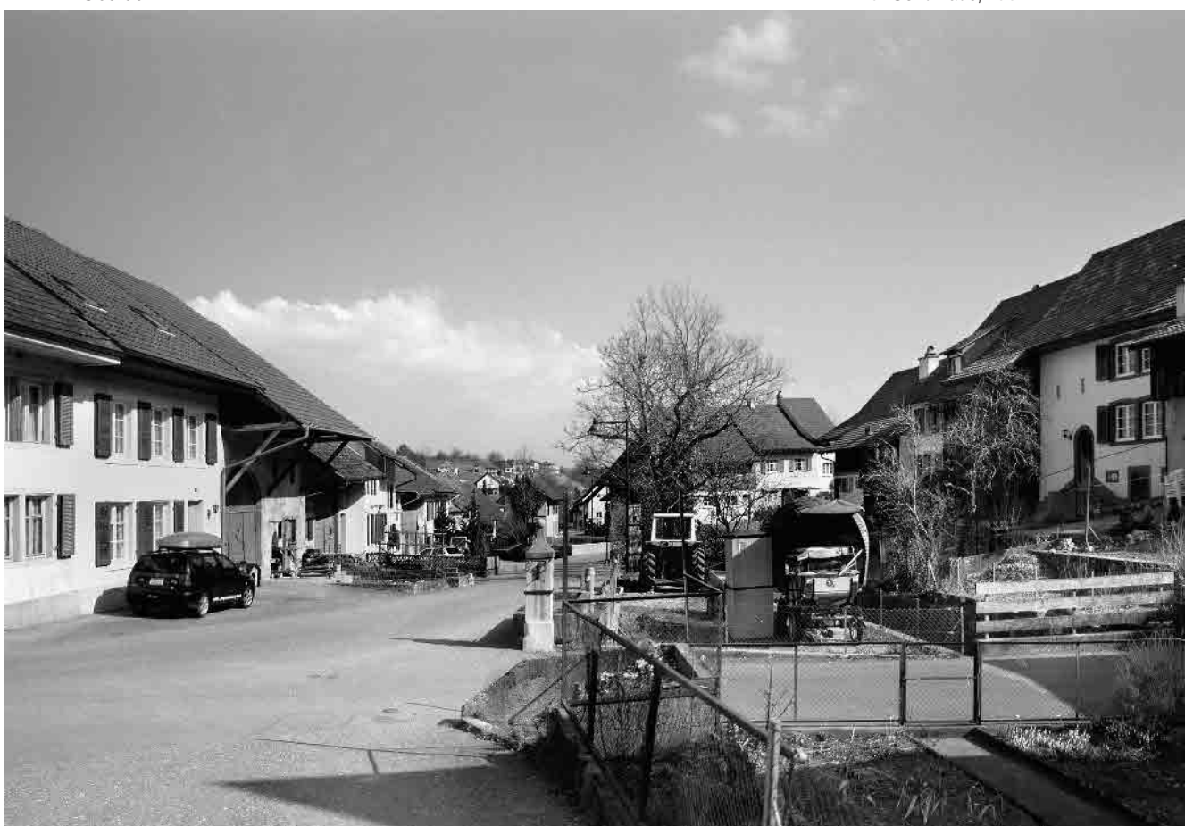
4 Bachzeilenbebauung im Unterdorf