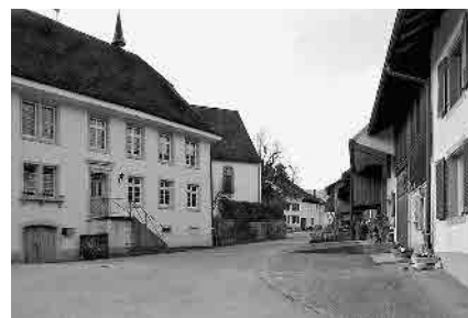
3 Schulhaus, 1834