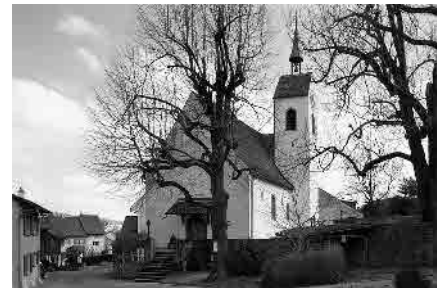
6 Ref. Pfarrkirche