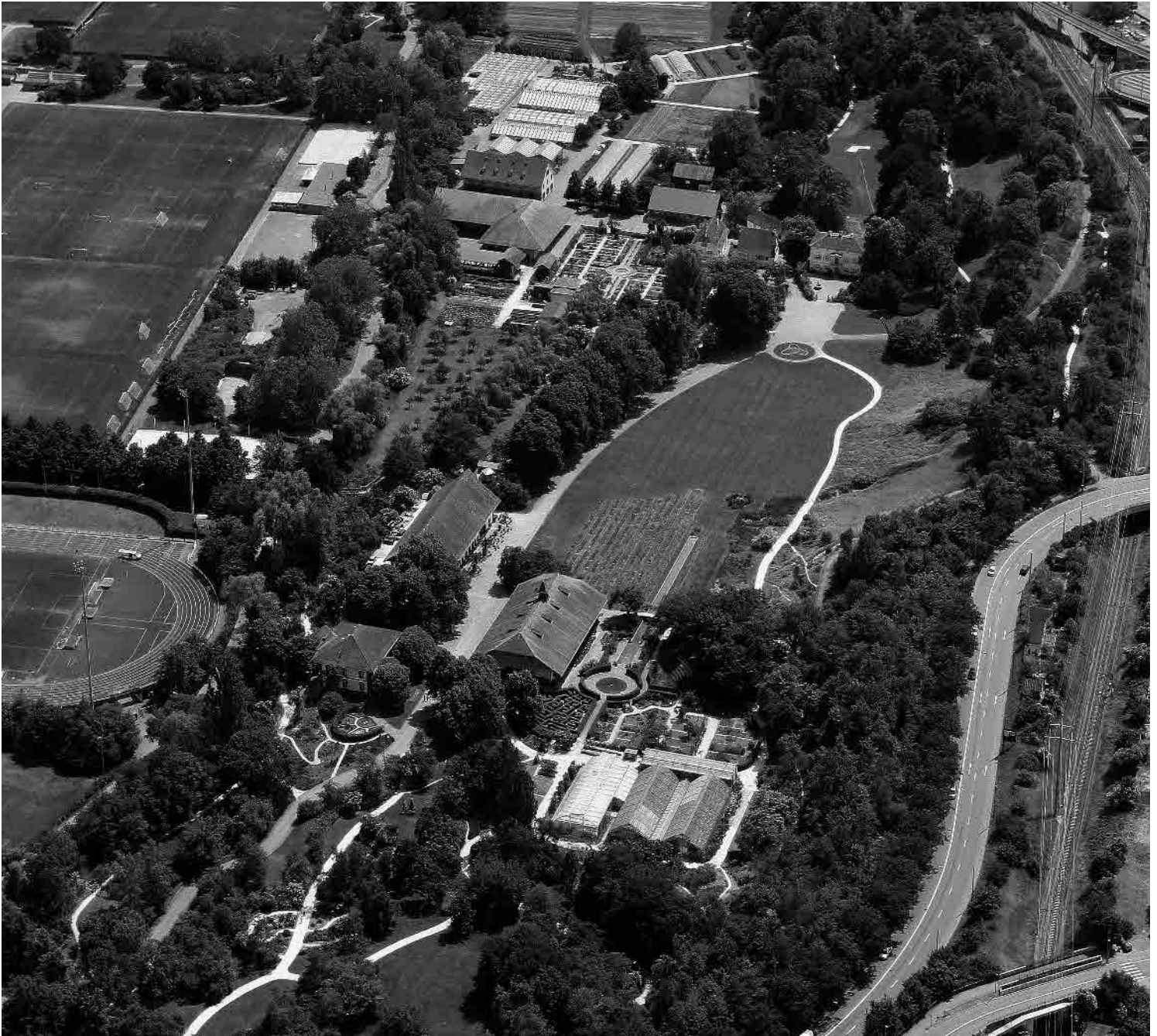
Flugbild Bruno Pellandini 2006, © BAK, Bern

Grünase und Naherholungsraum an der Grenze zur Stadt Basel mit landwirtschaftlichem Mustergut Christoph Merians von 1839; Unter-Brüglingen mit herrschaftlicher Villa, Mühlemuseum und botanischem Garten, Vorder-Brüglingen mit Bauten im Gutshof von Melchior Berri.