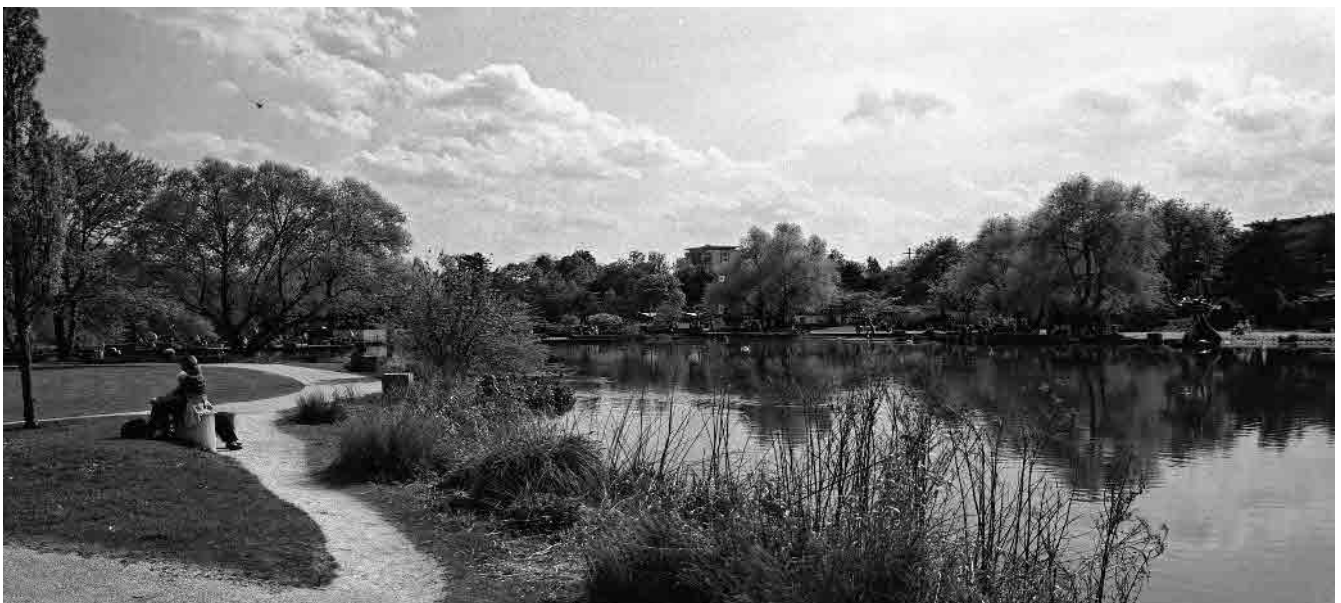
17 Park der «Grün 80»