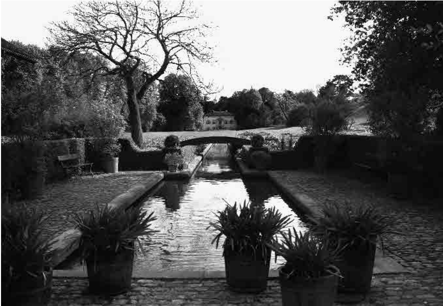
8 Blick von Vorder-Brülingen auf Merian-Villa