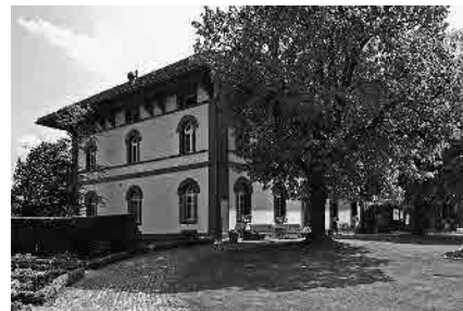
2 Pächterhaus, 1839