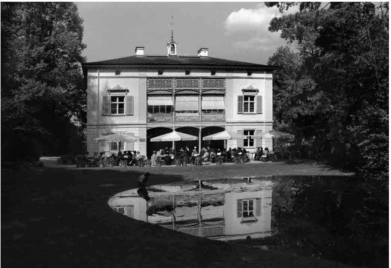
9 Merian-Villa, 1711/1859