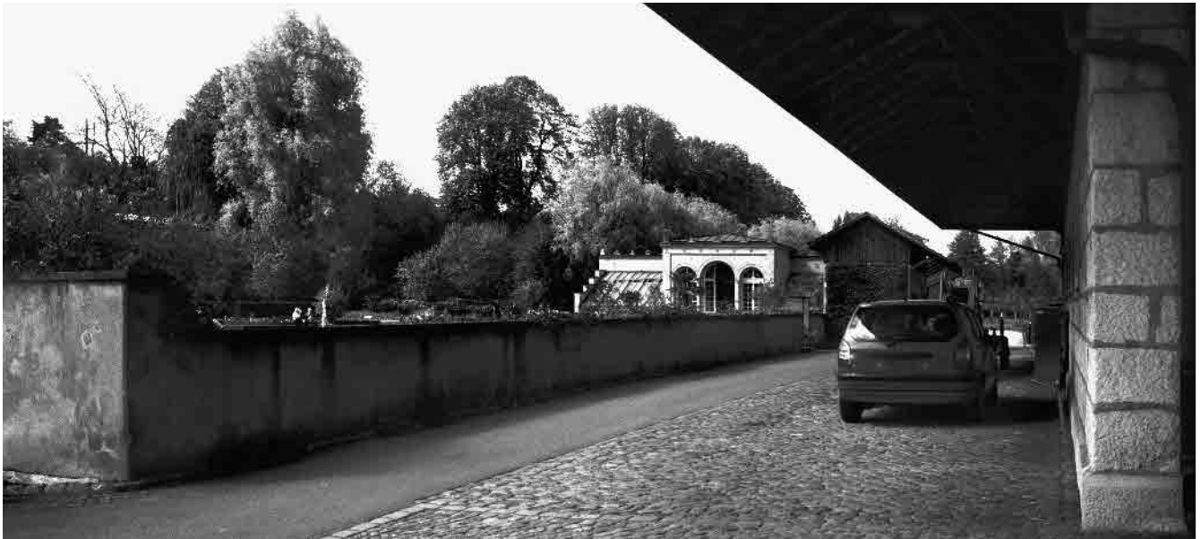
14 Orangerie, um 1850