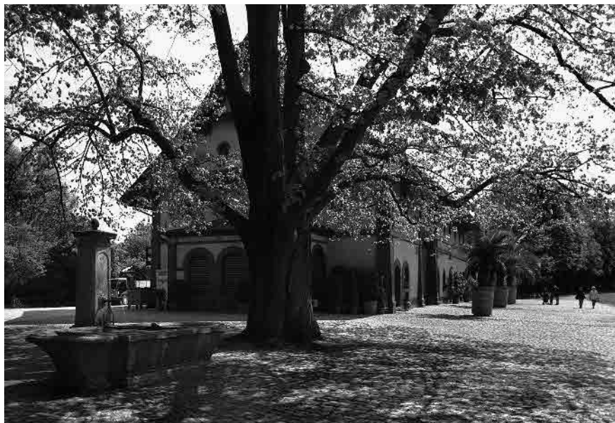
4 Ökonomiegebäude, 1837