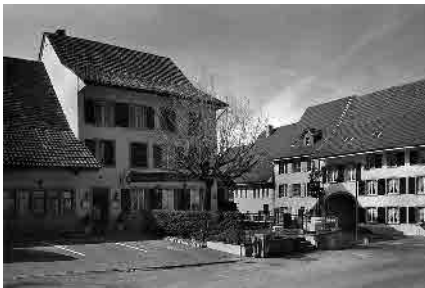
2 Gasthof «Zum Ochsen»