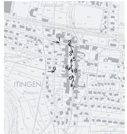
Plangrundlage: Übersichtsplan UP5000, Geodaten des Kantons Basel-Landschaft, © Amt für Geoinformation des Kantons Basel-Landschaft Fotostandorte 1 : 10 000 Aufnahmen 2003: 1–9