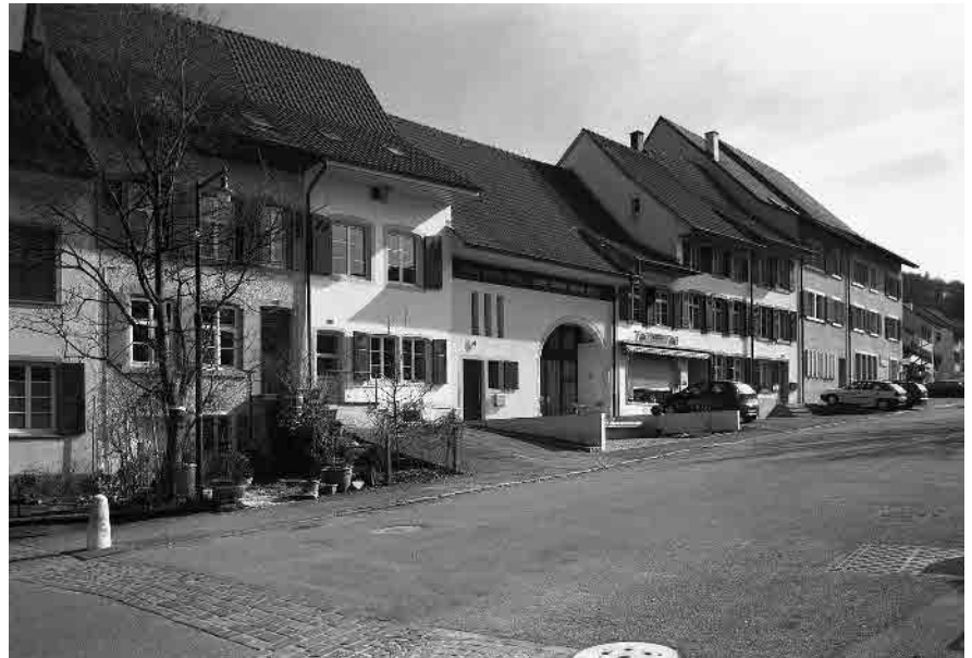
3 Dorfstrasse mit Umbauten