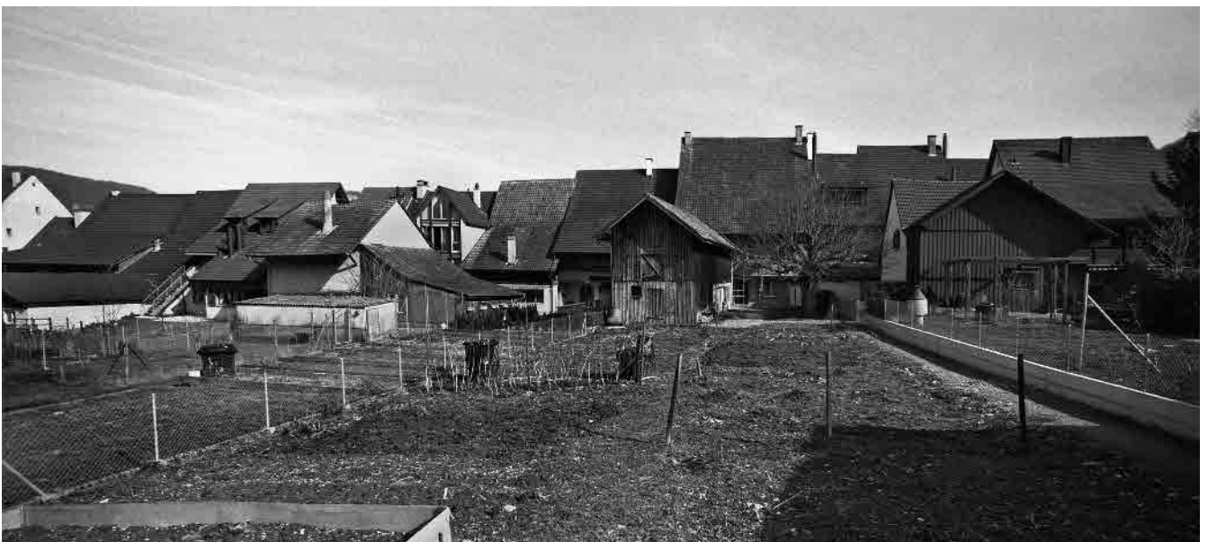
9 Blick über die ehem. Baumgärten