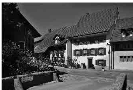
18 Brücke beim Böschmattbächli