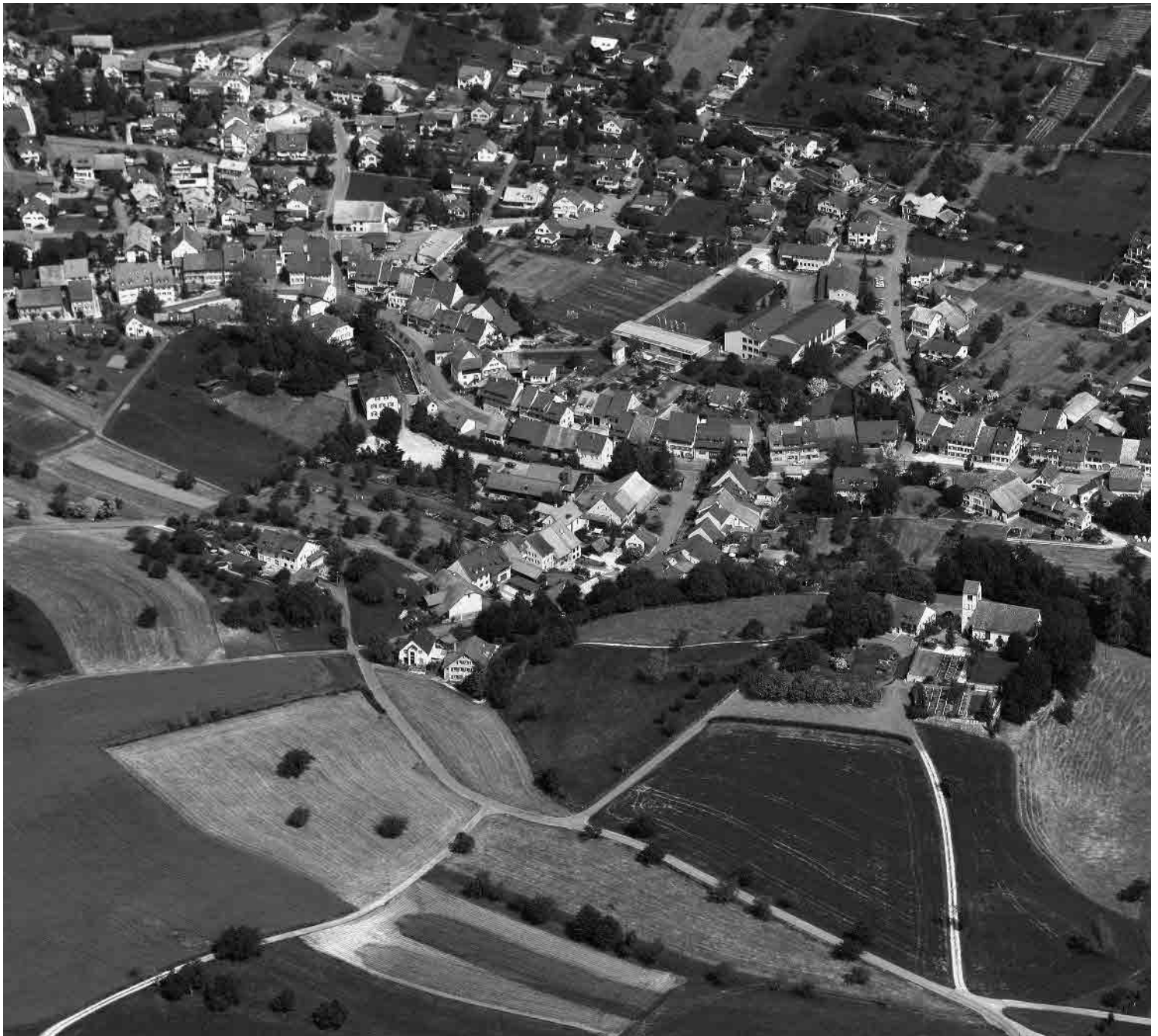
Flugbild Bruno Pellandini 2006, © BAK, Bern

Eindrucklichstes Bachzeilendorf im Kanton mit mehrfach gewundenem, von der Hinteren Frenke durchflossenem Strassenraum. Interessanter Kontrast zwischen den mächtigen Gehöften und den Kleinbauten am Bach. Kirchbezirk auf Hangterrasse mit Ursprung im 14. Jahrhundert.