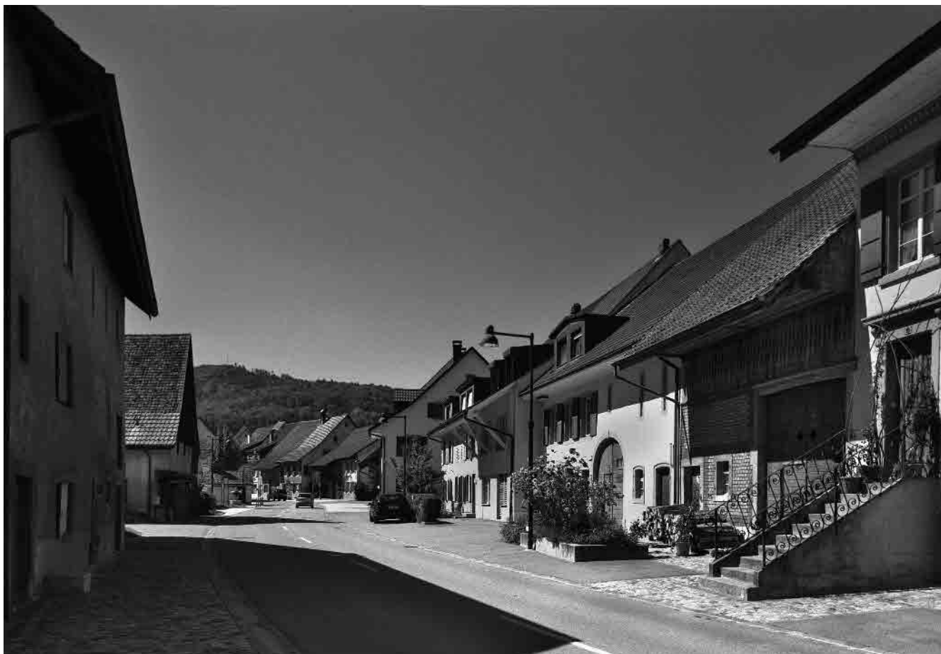
14 Bei der Unteren Mühle