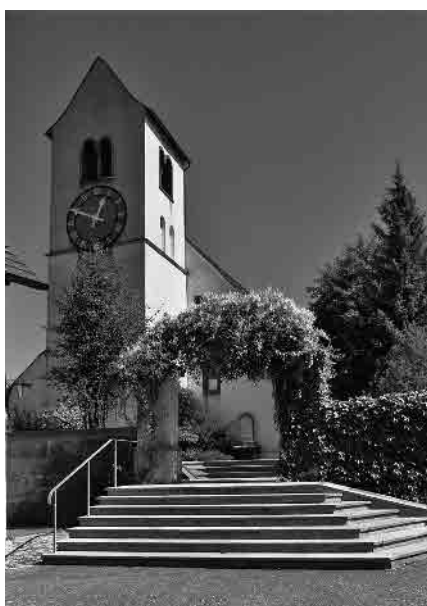
23 Ref. Pfarrkirche, 14. Jh.