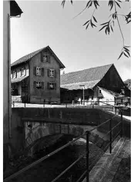
2 Obere Mühle