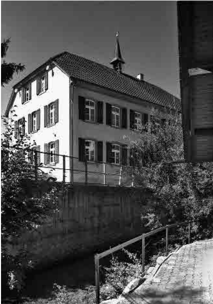
9 Gemeindehaus, ehem. Schule, 1848