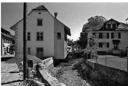
6 Ehem. Schmiede