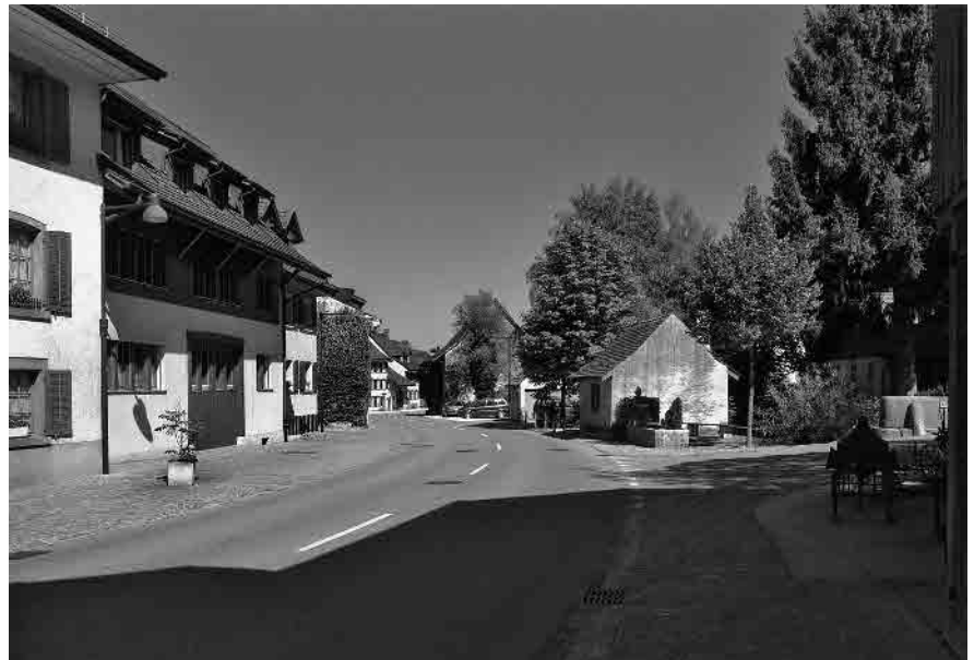
11 Bäume und Waschhäuschen am Bach