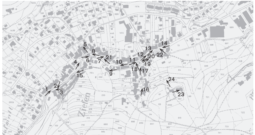
Plangrundlage: Übersichtsplan UP5000, Geodaten des Kantons Basel-Landschaft, © Amt für Geoinformation des Kantons Basel-Landschaft Fotostandorte 1: 10 000 Aufnahmen 2003: 1–24