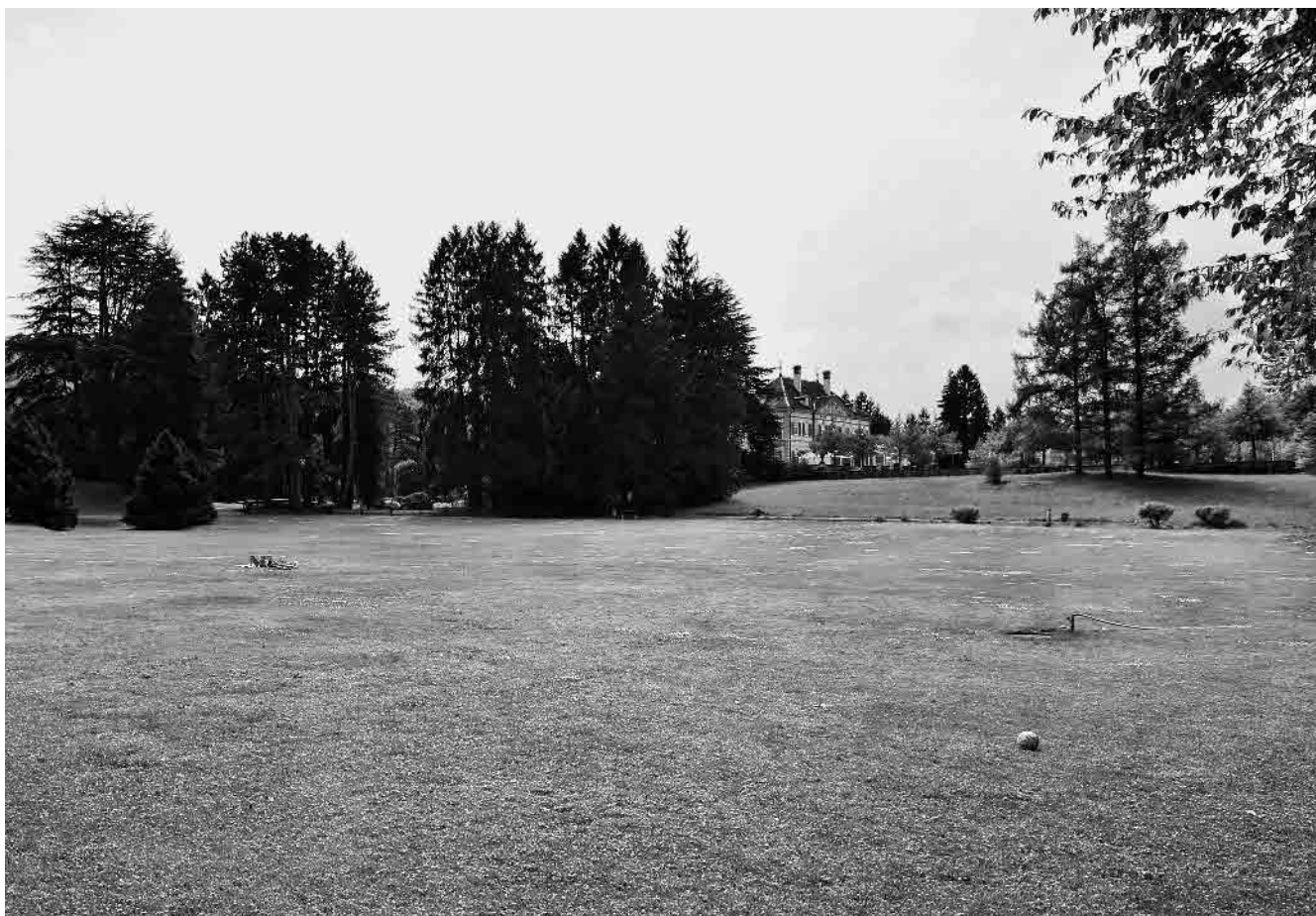
65 Wenkenhof und Wenkenpark