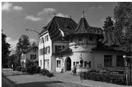
39 Restaurant «Zum Schlipf»