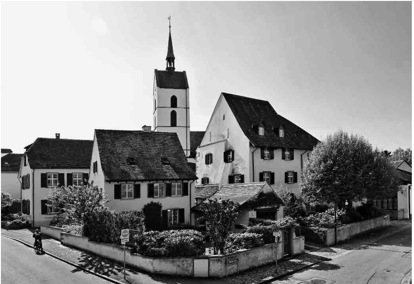
6 Kirchenburg, Erlensträsschen/Kirchgasse