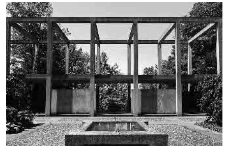
134 Urnenhalle, 1962