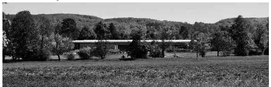
31 Talaue, Fondation Beyeler, 1997