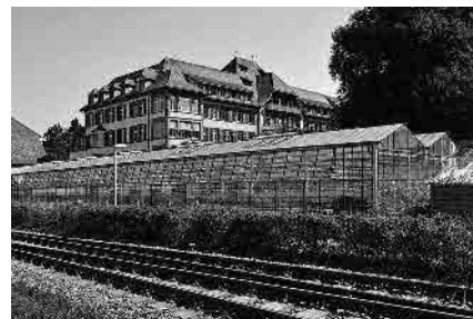
49 Gemeindespital, 1907