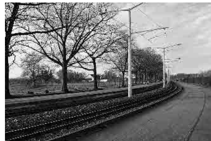
108 Äussere Baselstrasse