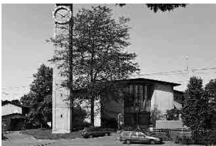
99 St. Franziskus, 1950