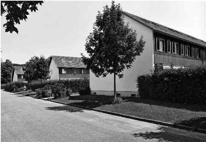
127 Genossenschaftssiedlung Im Höfli, 1950