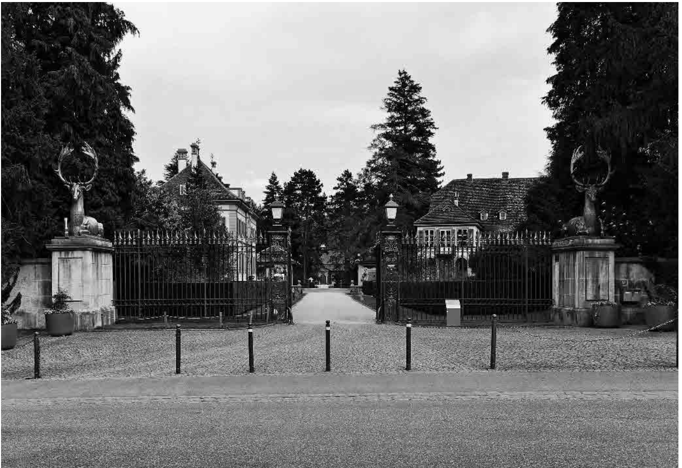
73 Eingangsportal, 1934 versetzt