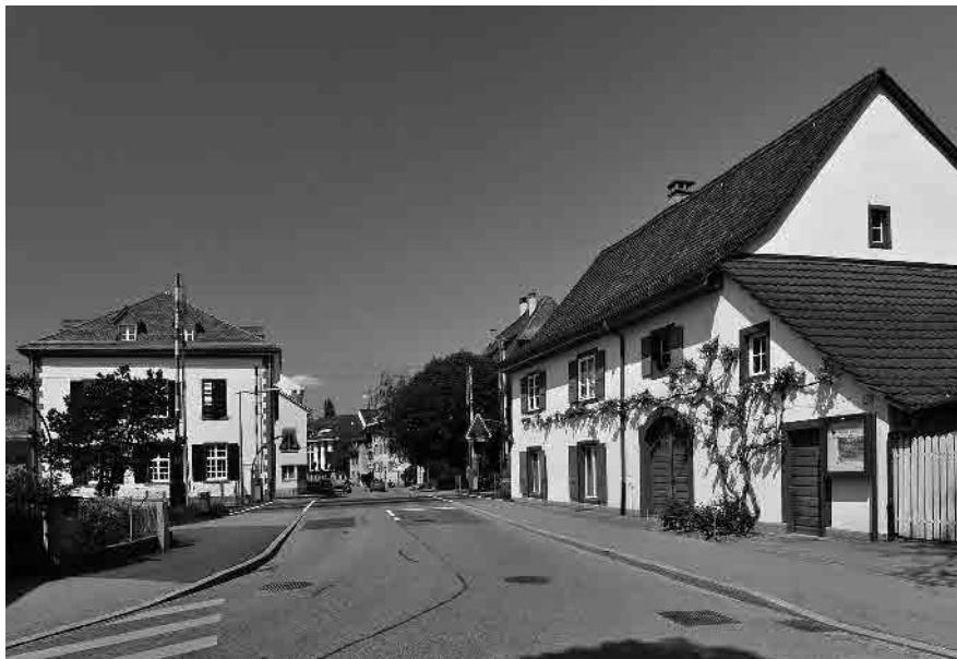
47 Schmiedgasse, links altes Schulhaus von 1841