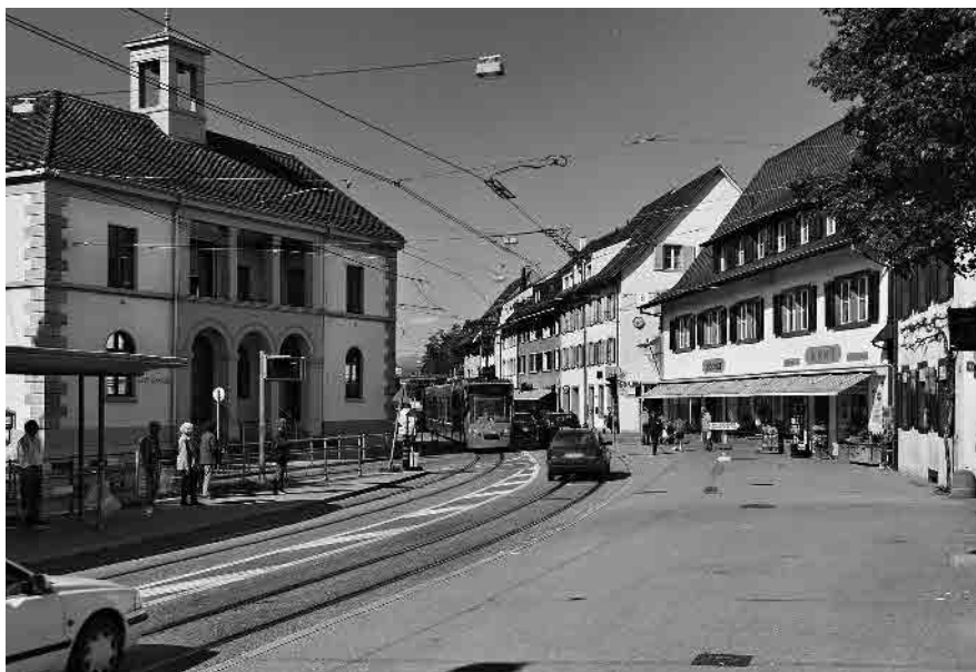
9 Altes Gemeindehaus von 1836, Hauptstrasse