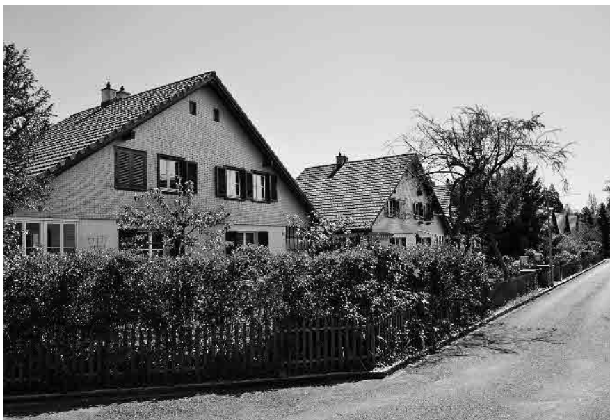
55 Wohnkolonie Arba, 1947