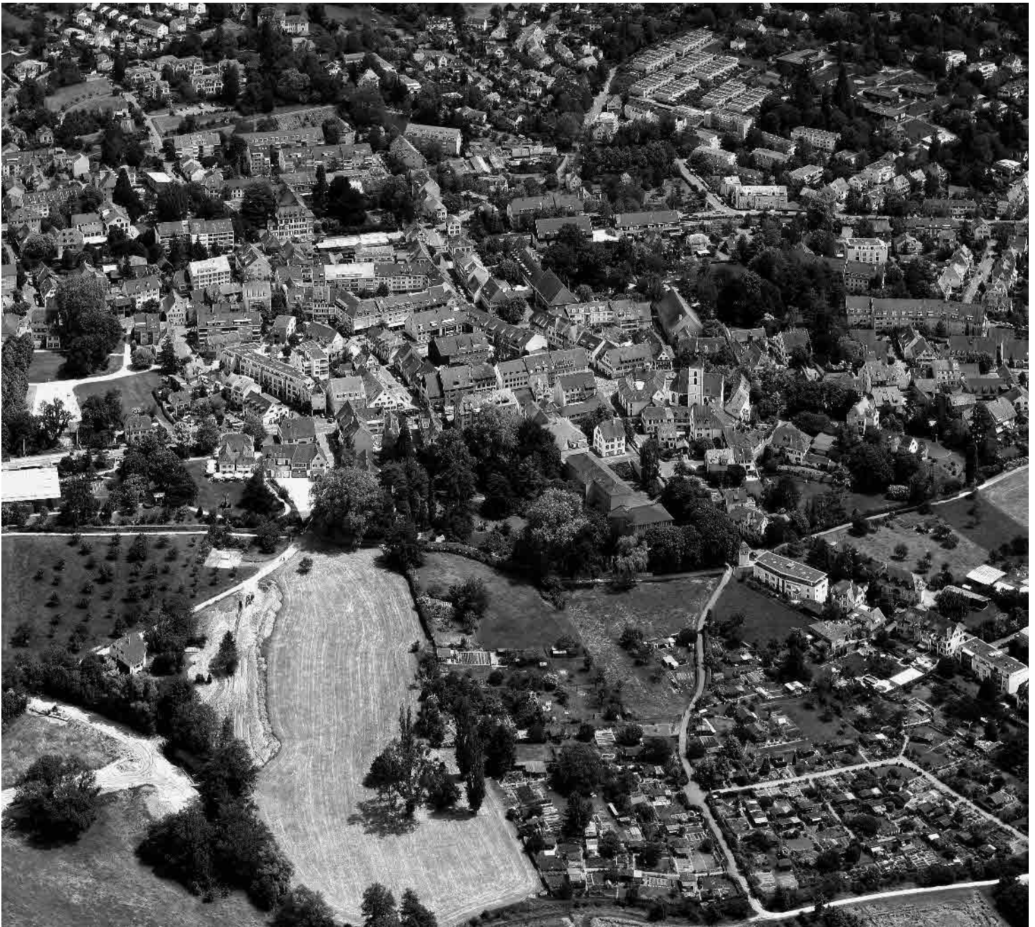
Flugbild Bruno Pellandini 2006, © BAK, Bern

Grosser Villenvorort in privilegierter Lage zwischen Tüllingerberg, Talae und Dinkelbergwald. Mit historischem Dorfkern, einem Kranz alter Landgüter und Gartenstadt-Siedlungen. Nach 1945 Wachstum zur Agglomerationsgemeinde durch sozialen Wohnungsbau.