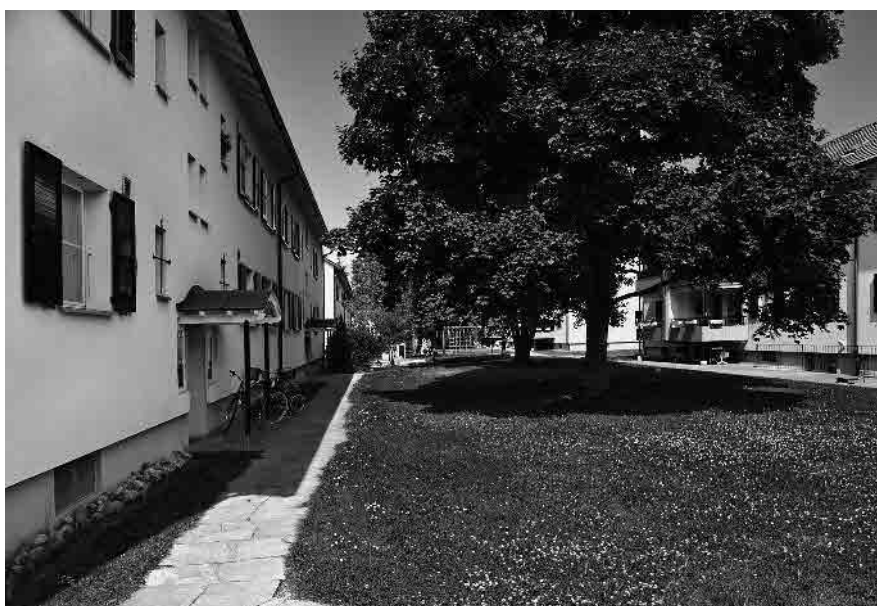
81 Wohnsiedlung Lachenweg, um 1950