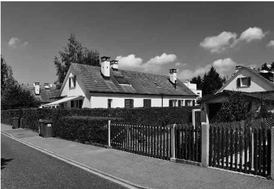
86 Gartensiedlung Tiefweg, 1930er-Jahre