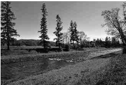
4 Flusslauf der Wiese