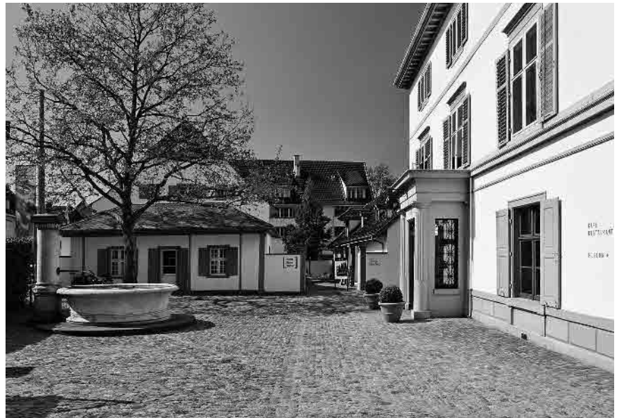
29 Berowergut, 18./19. Jh.