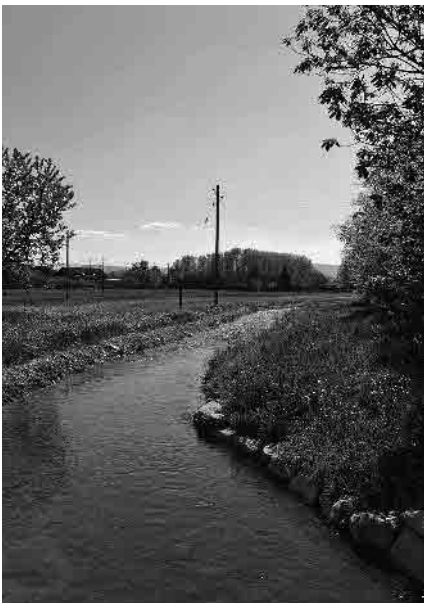
5 Neuer Teich