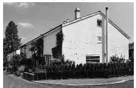
90 Talweg, 1955