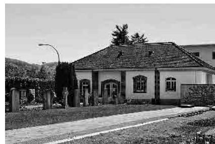
56 Friedhof, 1899