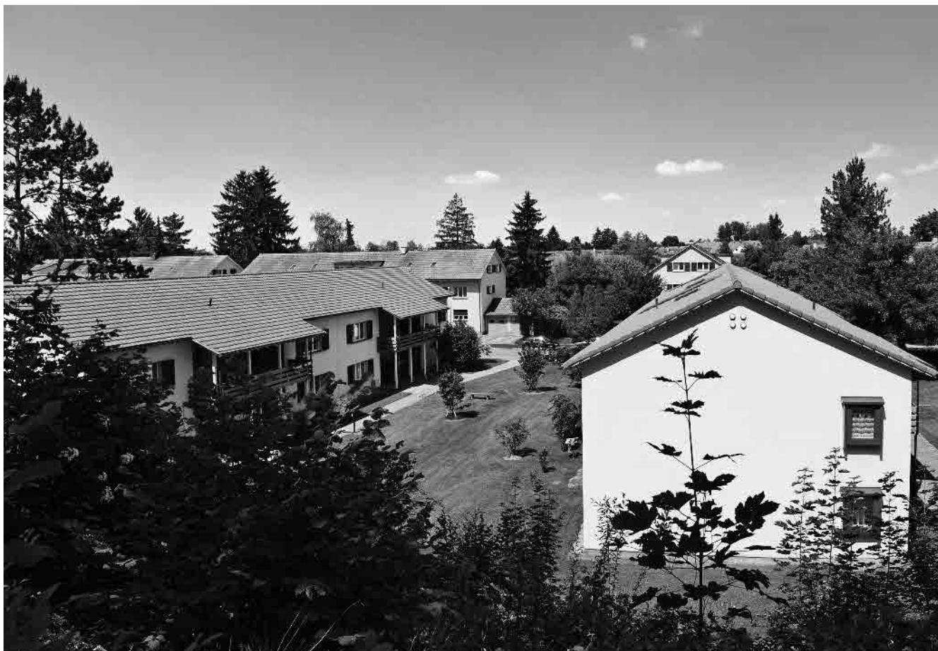
122 Genossenschaftssiedlung Rainallee, um 1950