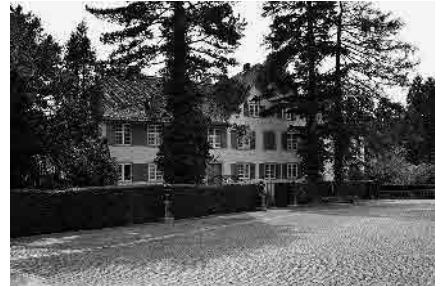
72 Alter Wenkenhof