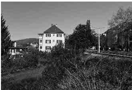
95 Äussere Baselstrasse