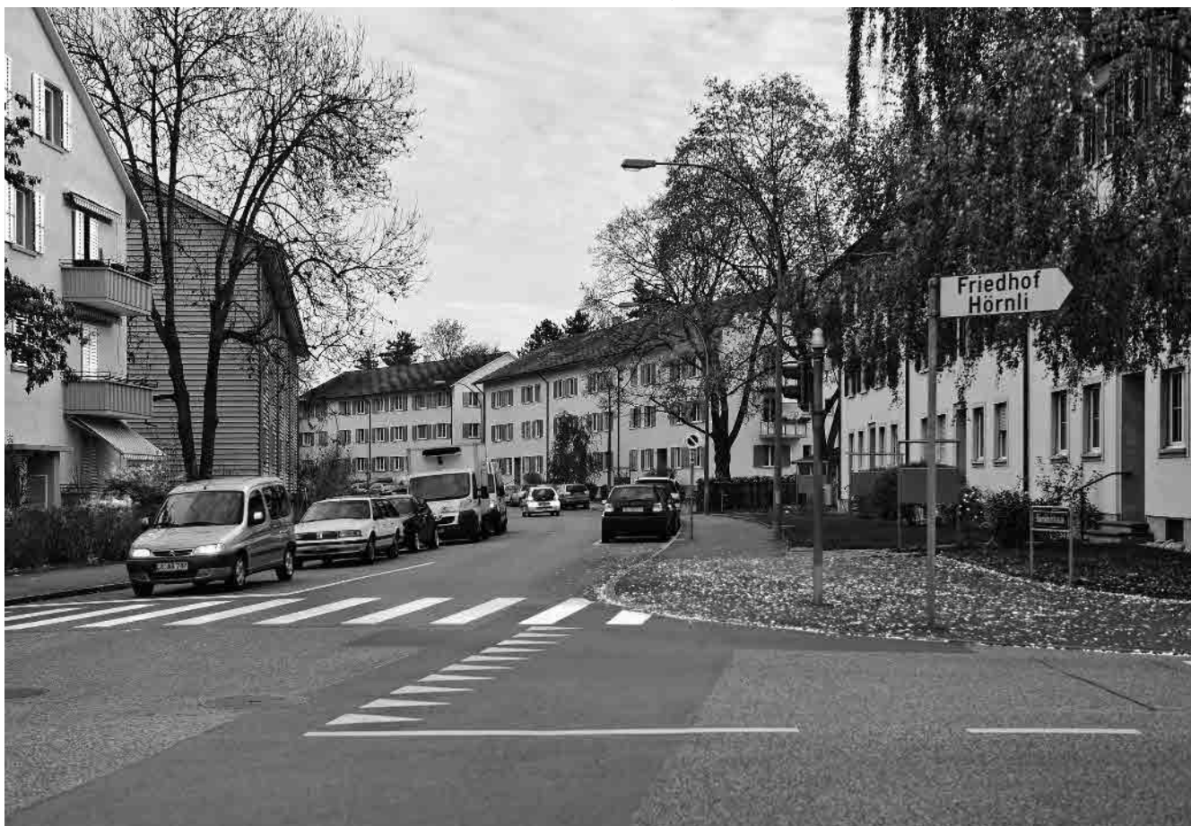
114 In den Neumatten, um 1950