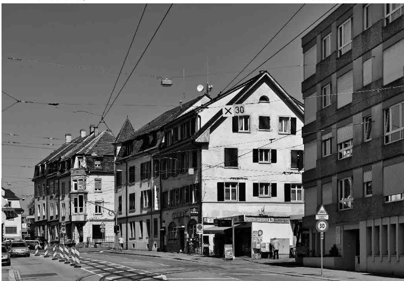
58 Lörracherstrasse, Zoll