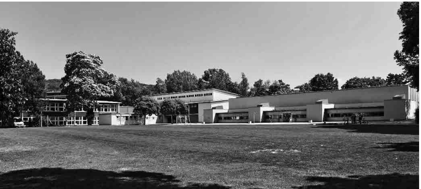
121 Hebelschulhaus, 1954