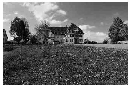
53 Moosrain, 1919