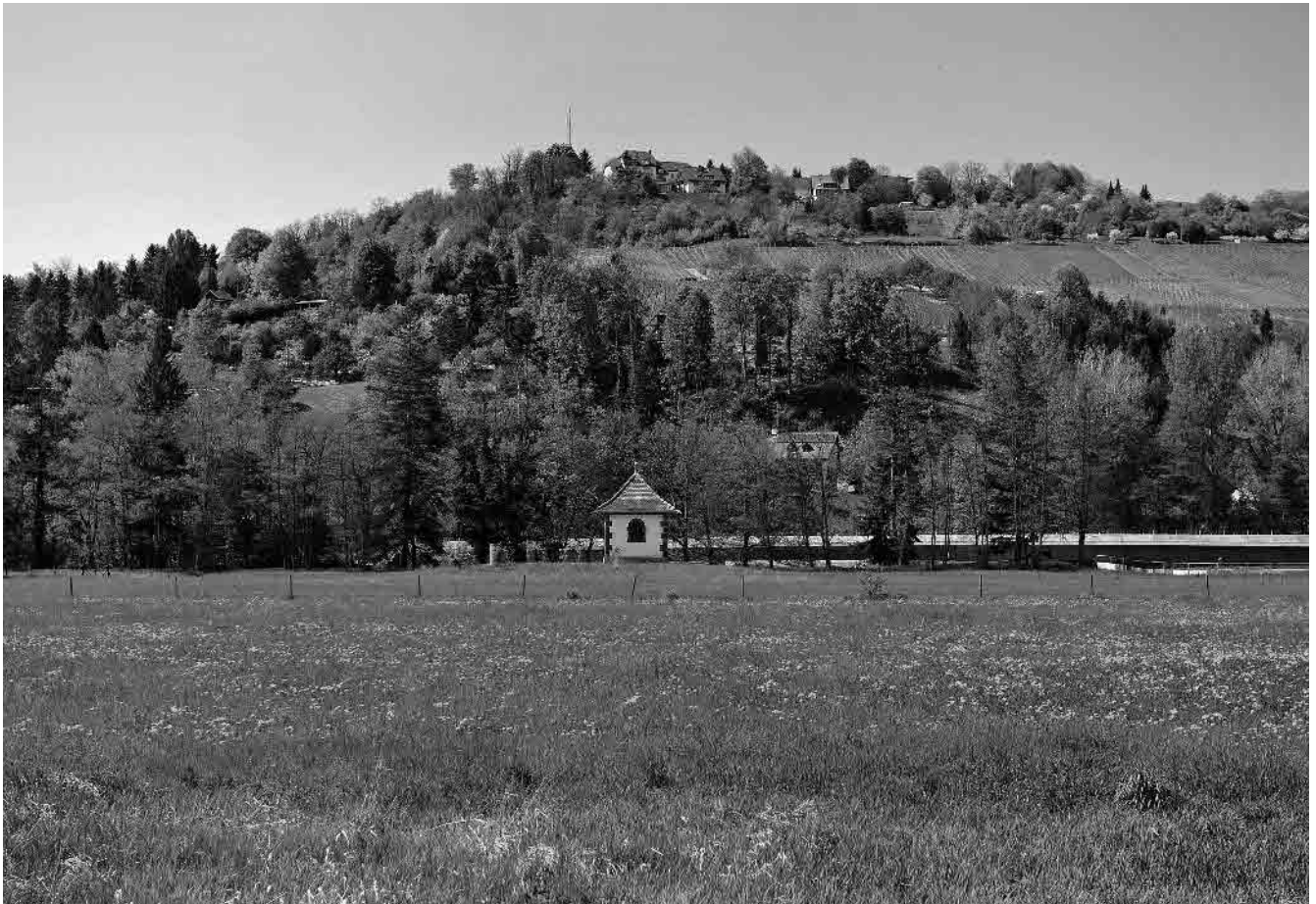
1 Talaue und Tüllingerberg