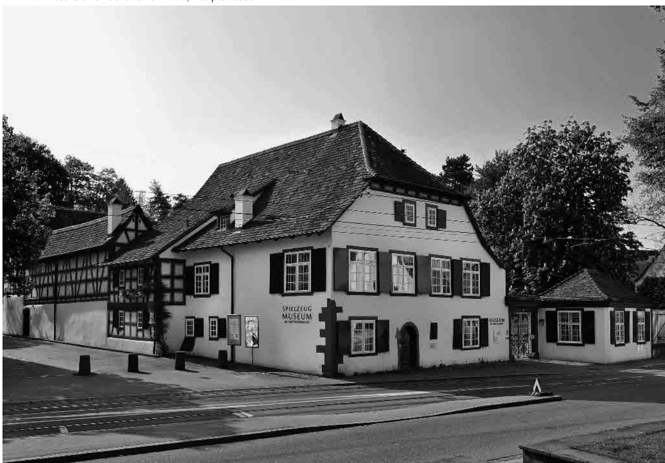
12 Wettsteinhäuser, 16.–18. Jh.