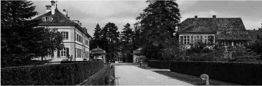
71 Neuer und alter Wenkenhof