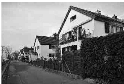
112 In den Habermatten