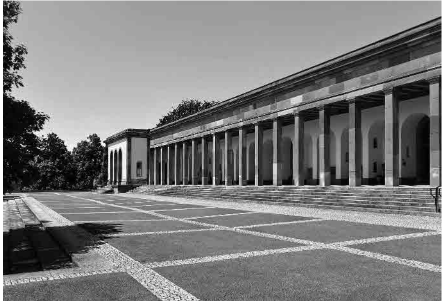
131 Aufbahrungs- und Kapellengebäude, 1932