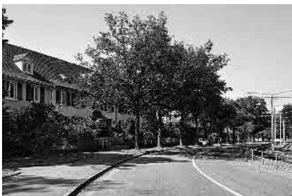
98 Äussere Baselstrasse