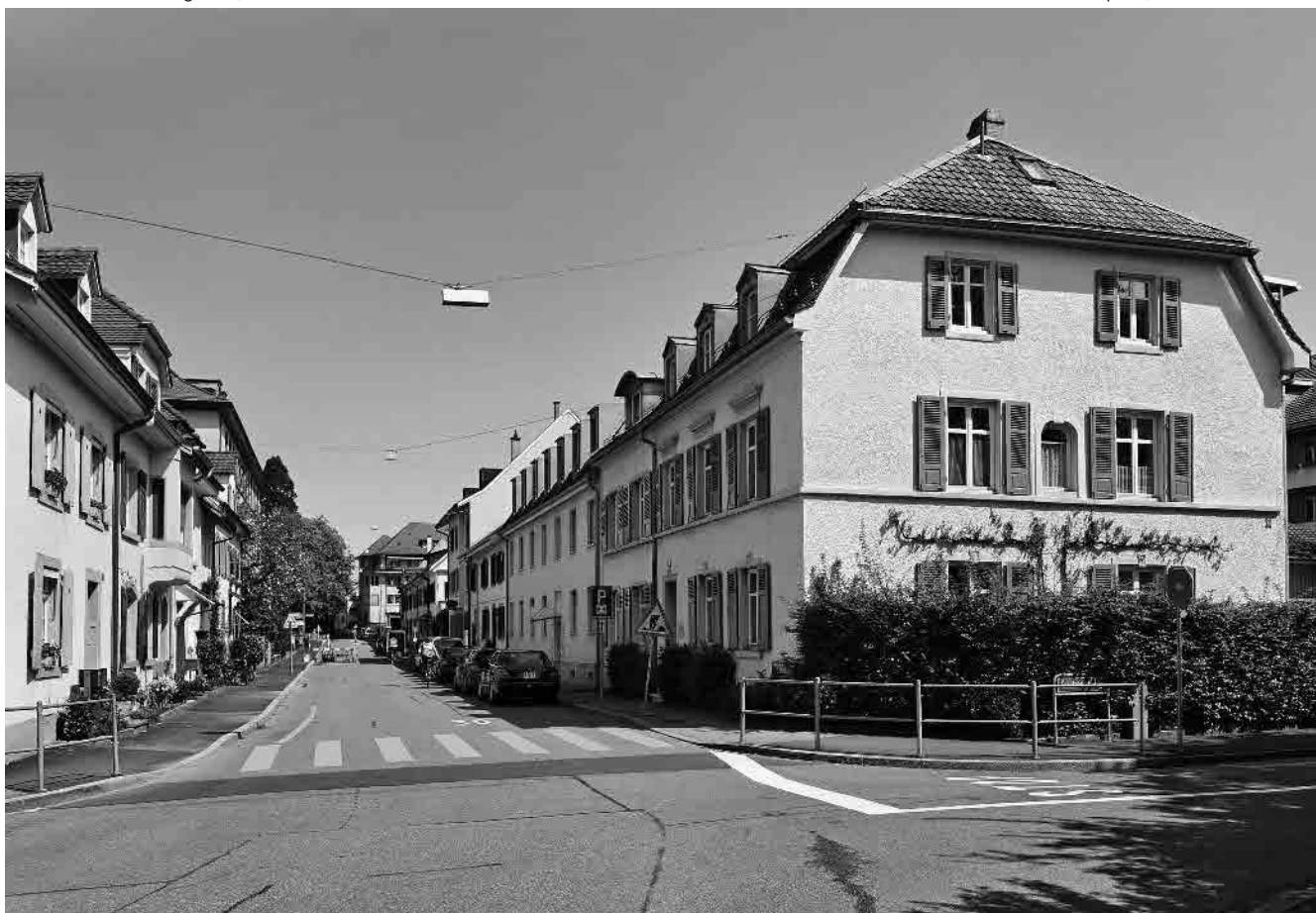
50 Schützengasse, 1862 angelegt