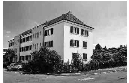
87 Kornfeldstrasse, um 1930