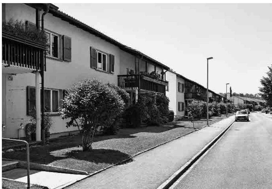
124 Rüdinstrasse, um 1950