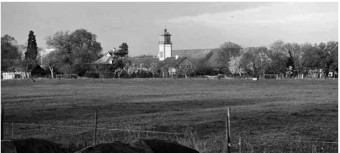
106 Bäumlihof, Landwirtschaftsgut