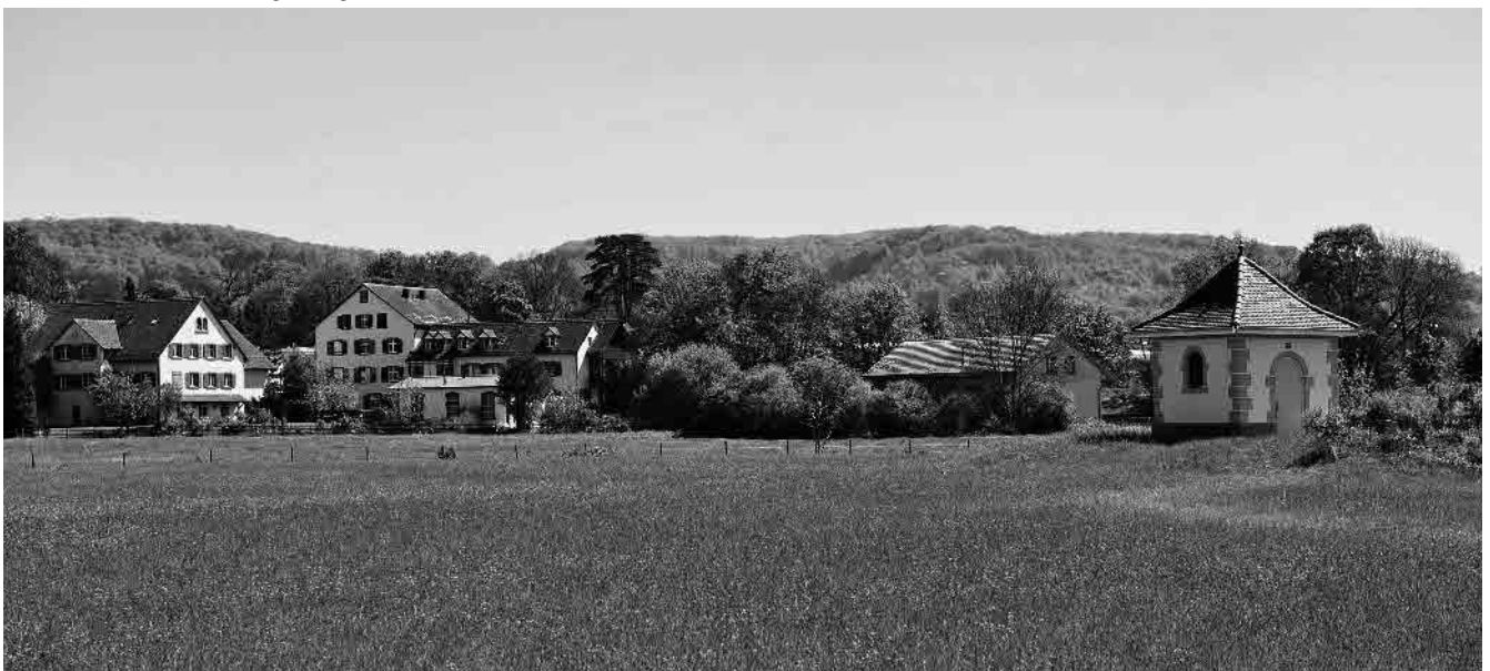
2 Talaue, Mühlegruppe und Grundwasserbrunnen