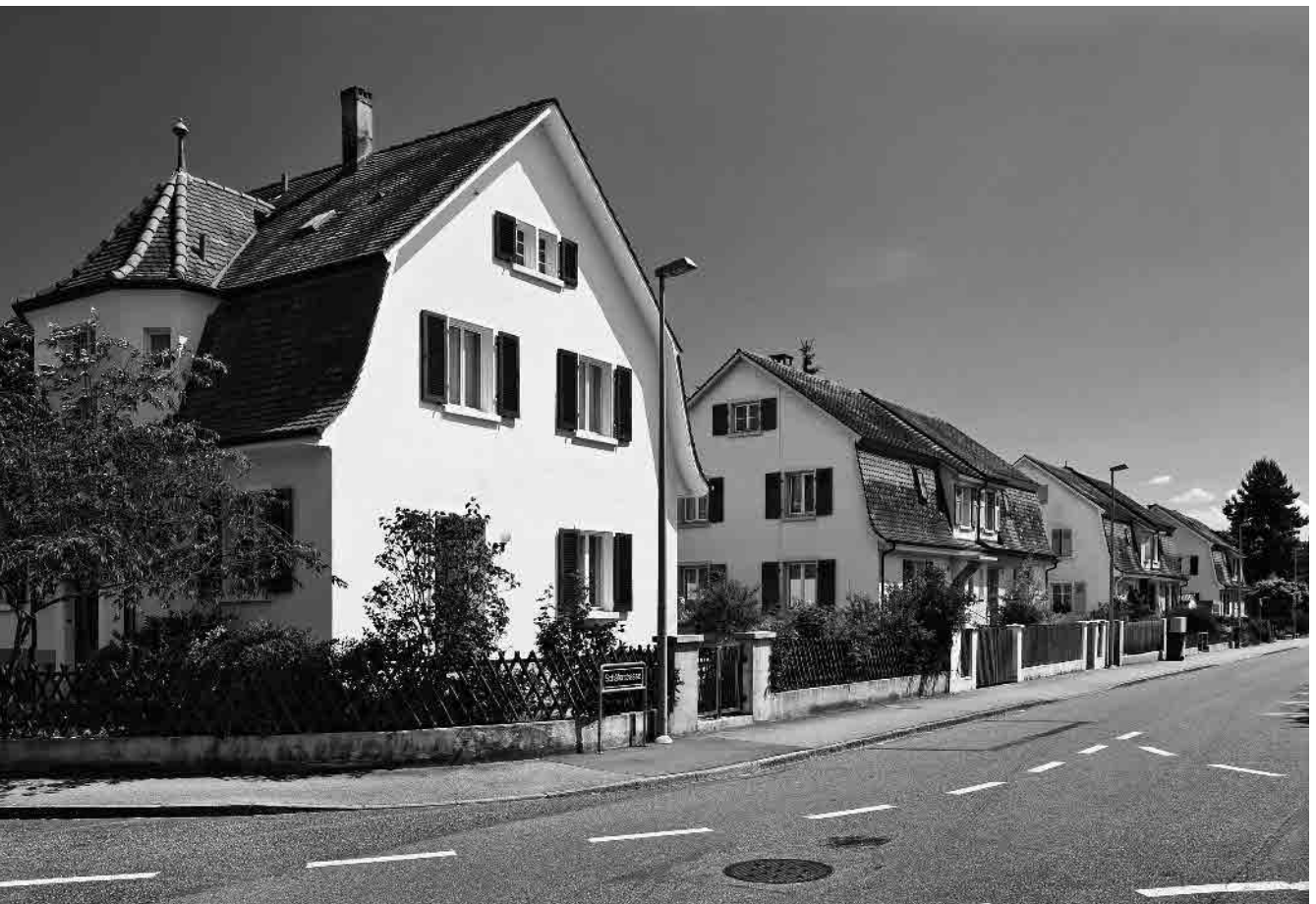
126 Gartenstadt Niederholz, 1922