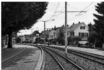
111 Äussere Baselstrasse