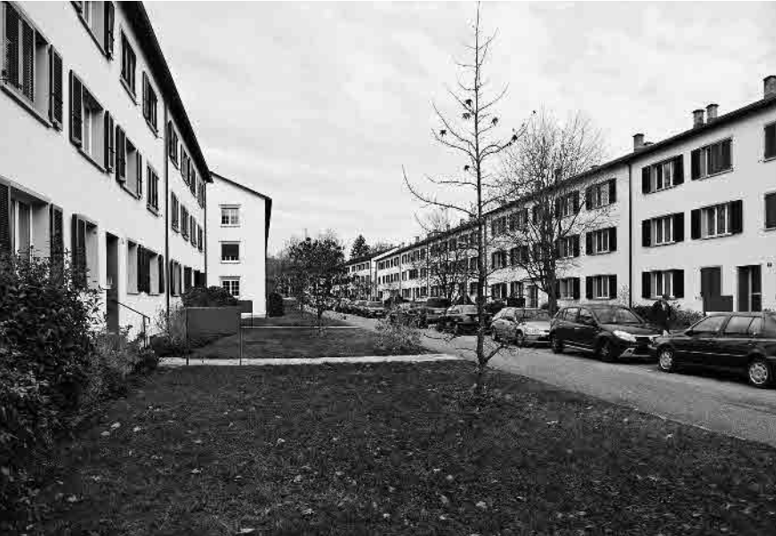
115 Siedlung Niederholz, 1949