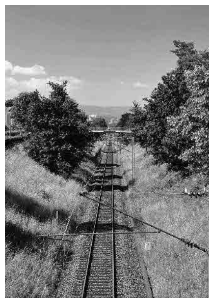
94 Wiesentalbahn, eröffnet 1862