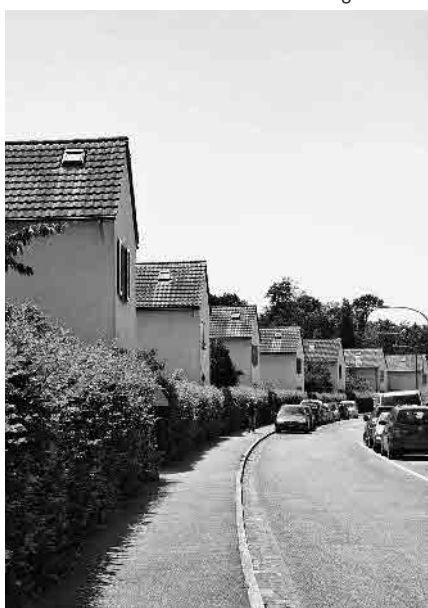
123 Rainallee, 1946