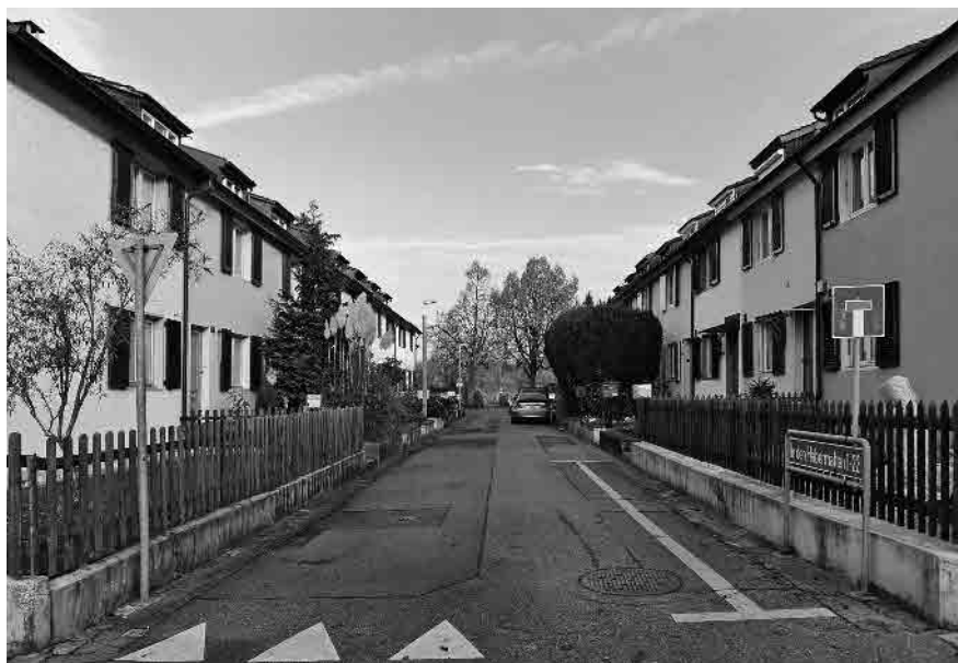
113 In den Habermatten, 1924