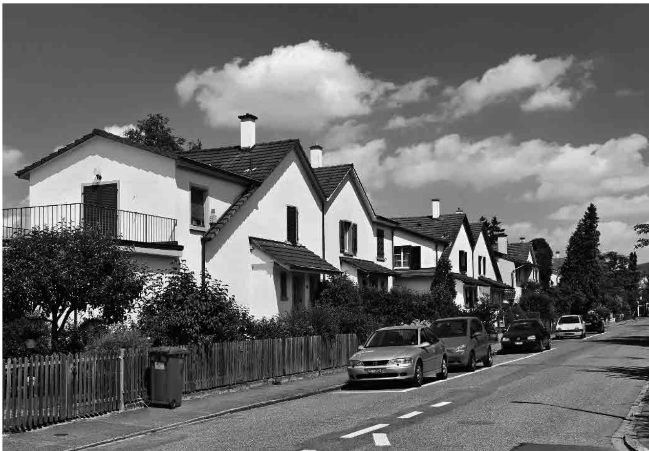
92 Wohnsiedlung Gartenfreund, 1922