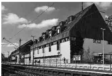
38 Bahnhofsüberbauung, 1972