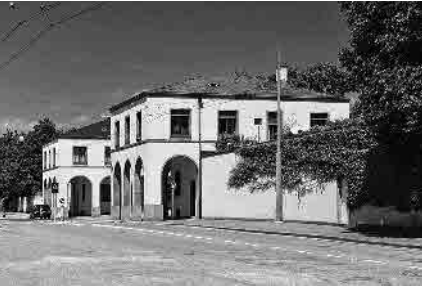
130 Friedhof am Hörnli, Portal, 1932