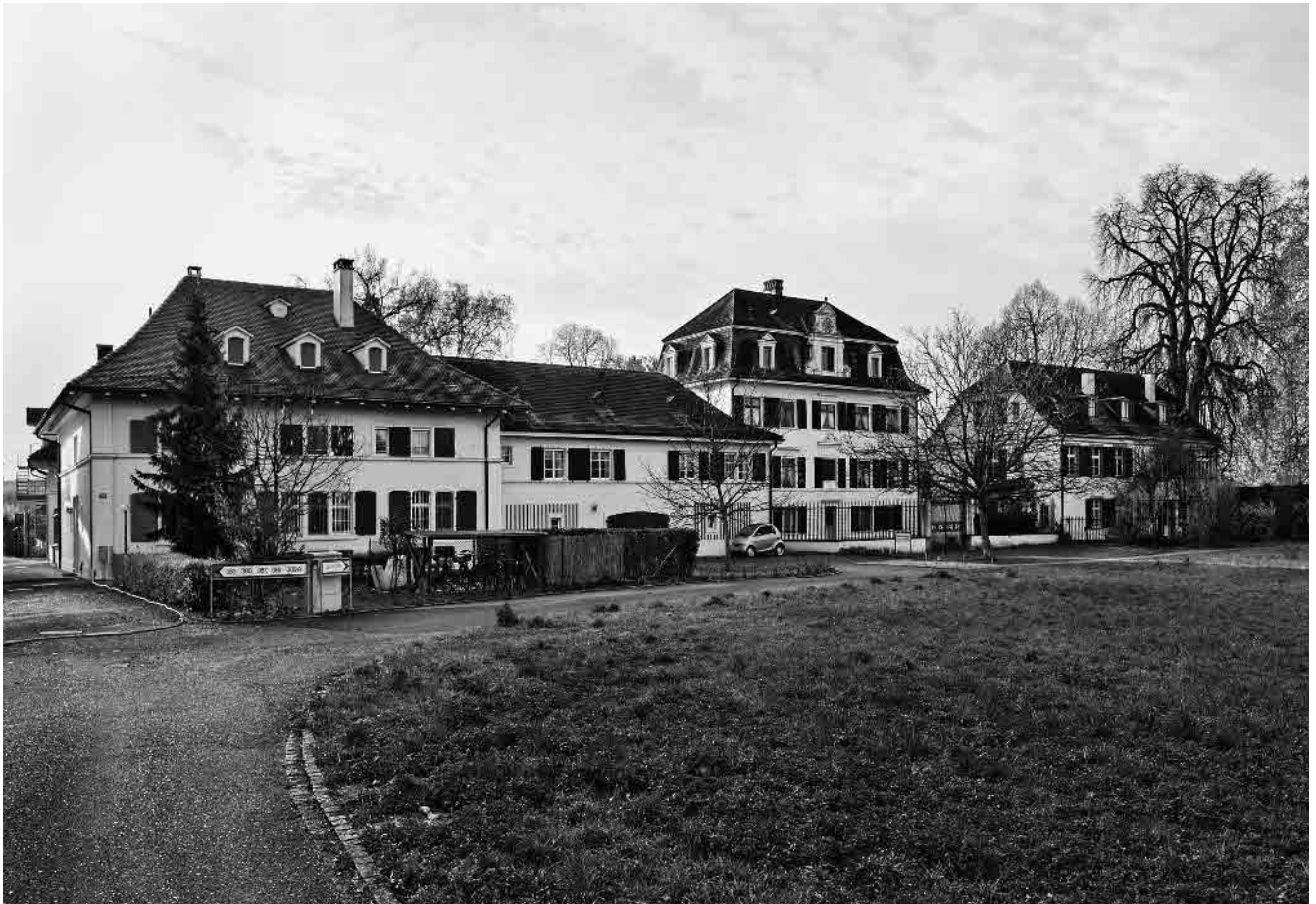
105 Bäumlihof, 17.–19. Jh.