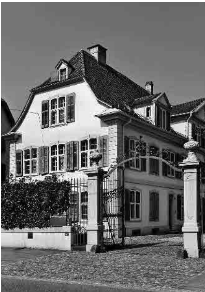
28 Iselin'sches Landgut