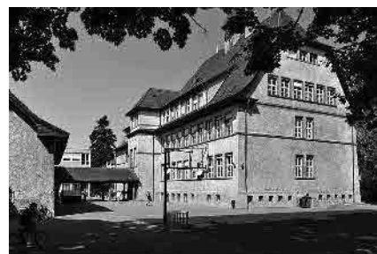
46 Schulhaus Burgstrasse, 1911