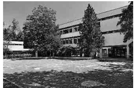
120 Wasserstelzenschule, 1964