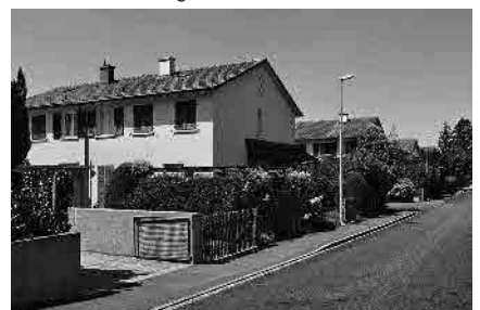
91 Elsternweg, 1940er-Jahre