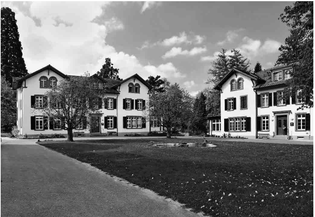
51 Psychiatrische Anstalt Sonnenhalde, 1900