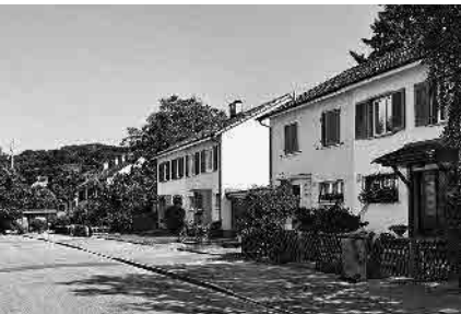
118 Keltenweg, nach 1950