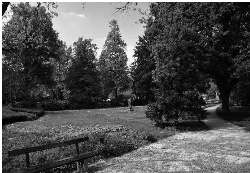
40 Gemeindepark, Wettsteinanlage