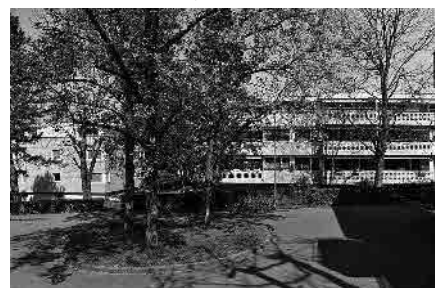
54 Im Gehracker, 1960er-Jahre