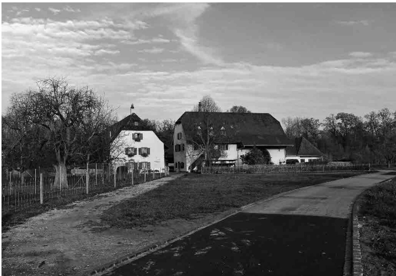
110 Spittelmatt, 18.-20. Jh.