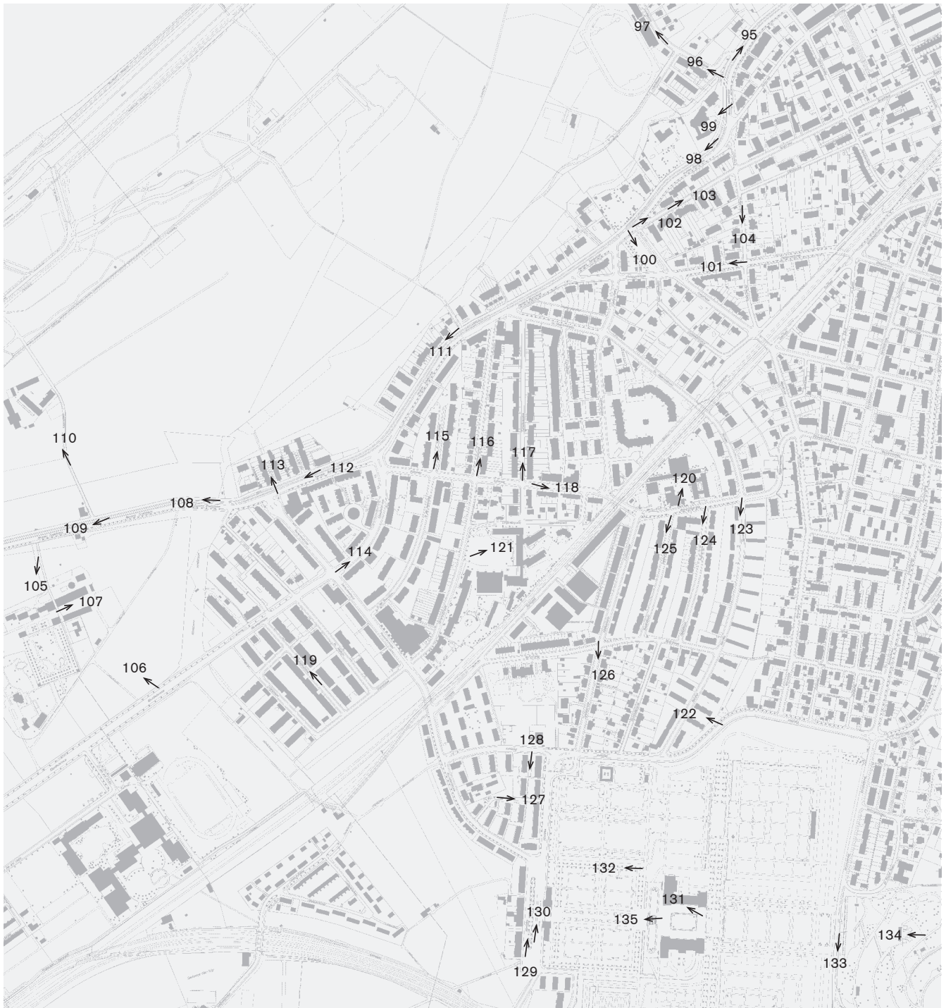
Fotostandorte 1: 10 000 Quartiere Pfaffenloh und Niederlenz, Friedhof Hörnli Aufnahmen 2009: 95–135