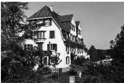
96 Zur Holzmüli