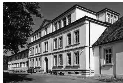
15 Dorfschulhaus, 1877