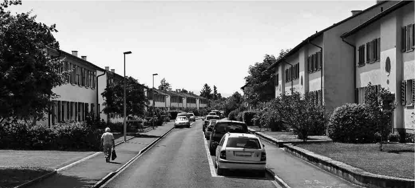
125 Supperstrasse, 1950er-Jahre