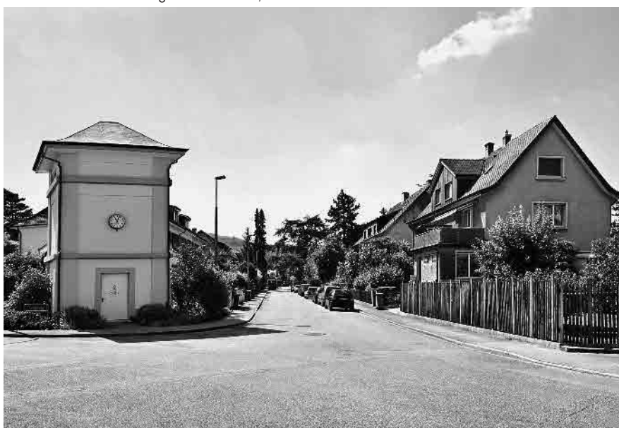
93 Morystrasse, Trafo von 1926