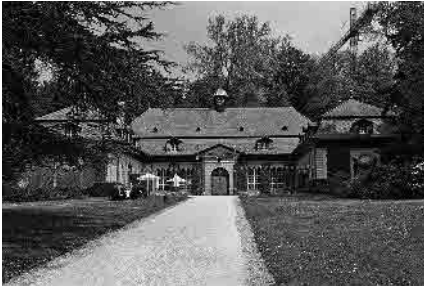
66 Wenkenhof, Reithalle, 1925