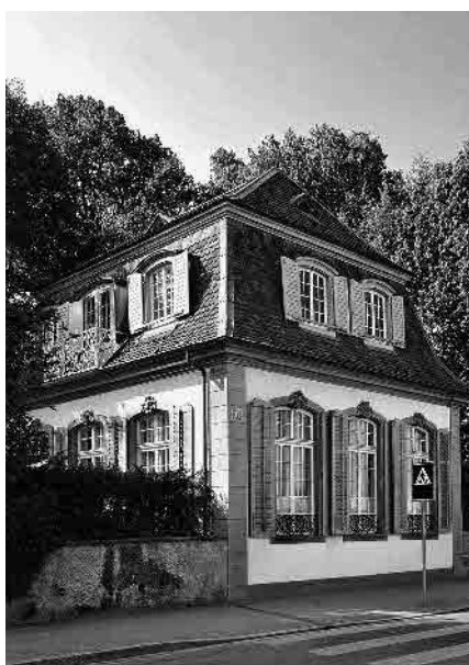
19 Cagliostro-Pavillon, 1760