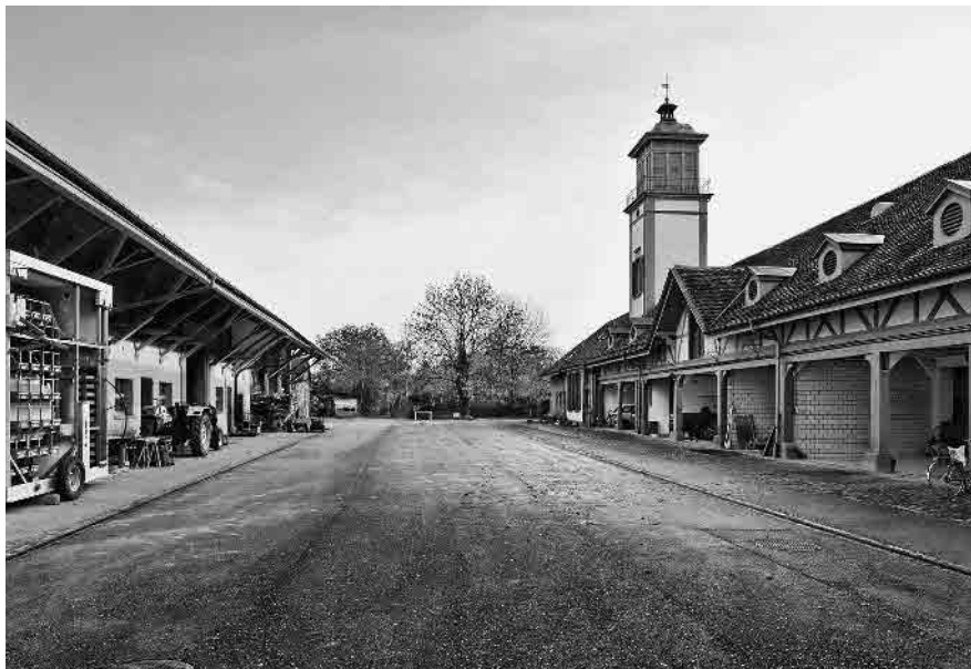
107 Bäumlhof, Wirtschaftshof