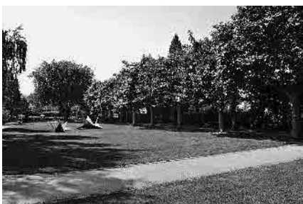
100 Essiganlage, 1931