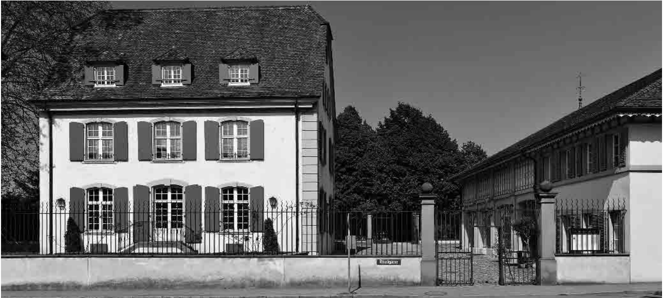
32 Elbs-Birr'sches Landgut, 17./18. Jh.