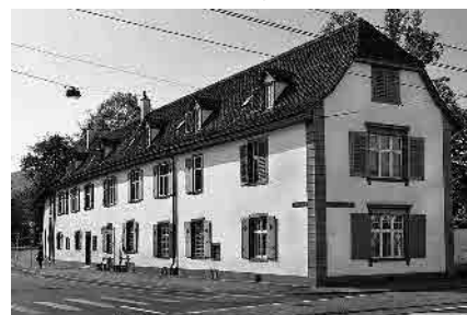
18 Glöcklihof, 18. Jh.