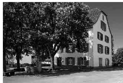
14 Rüdlin'sches Landhaus