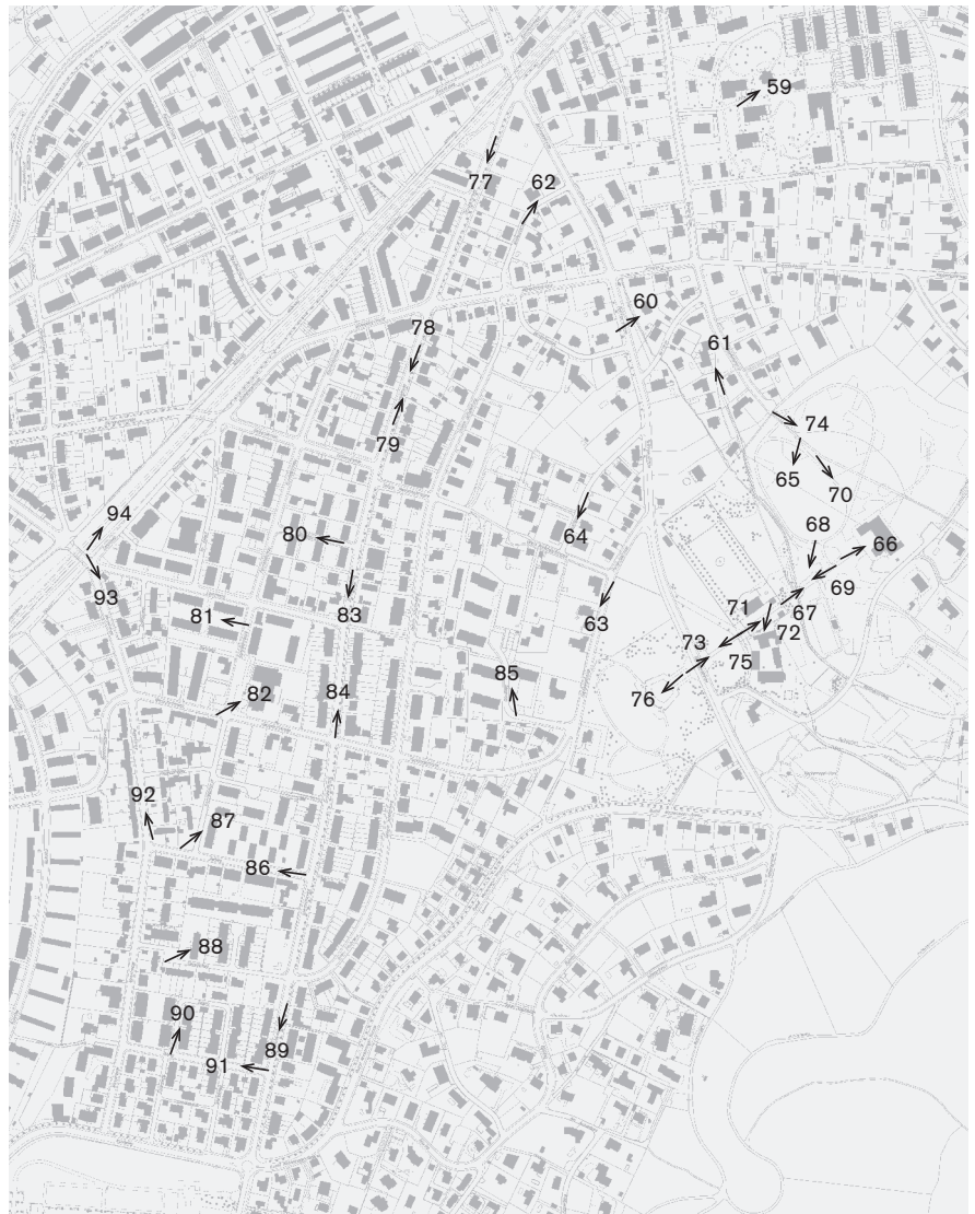
Fotostandorte 1: 10 000 Quartiere Wenken und Kornfeld Aufnahmen 2009: 59–94