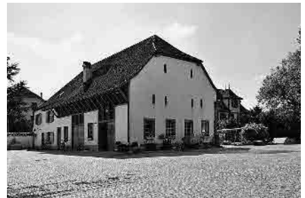
35 Le Grand'sches Landgut