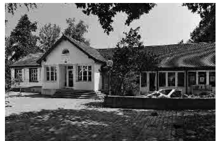
88 Kindergarten Siegwaldweg