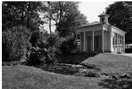
34 Orangerie, 1836