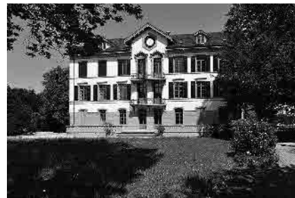
48 Diakonissenhaus, 1871