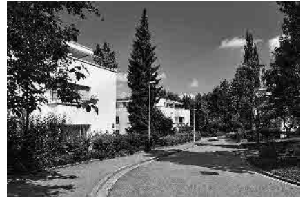
85 Dörnliweg, 1963