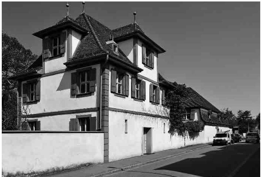
37 Le Grand'sches Landgut, 17./18. Jh.