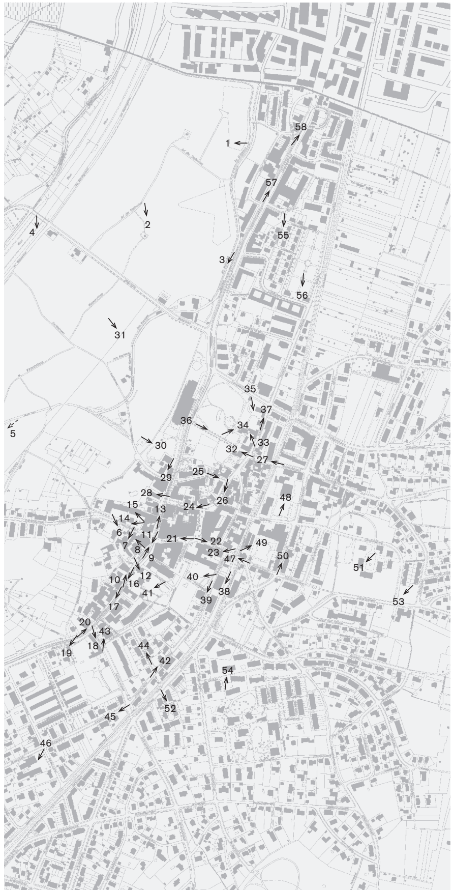
Fotostandorte 1: 10 000 Ortskern und Stettenfeld Aufnahmen 2009: 1–58