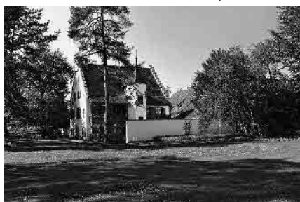
41 Neues Wettsteinhaus