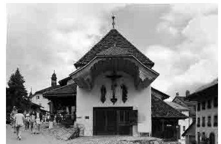
9 Ancienne «saunerie»