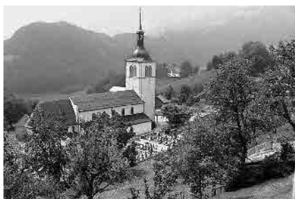
24 Eglise Saint-Théodule