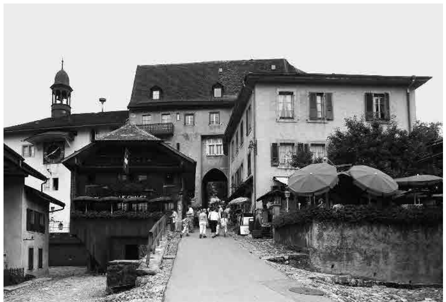
12 Entrée du bourg d'En-haut