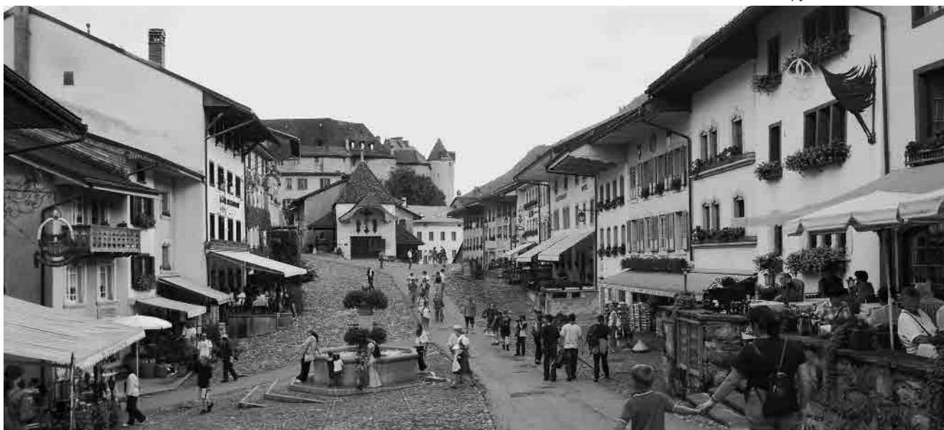
3 Bourg d'En-bas