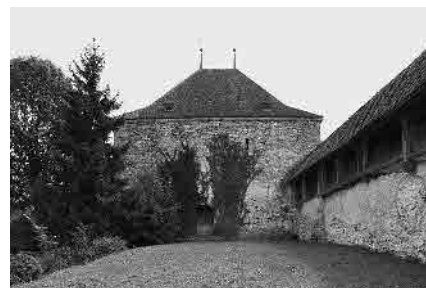
2 Tour de Chupyâ Bârba