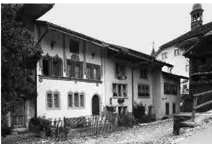
10 Maison dite du bouffon Chalamala