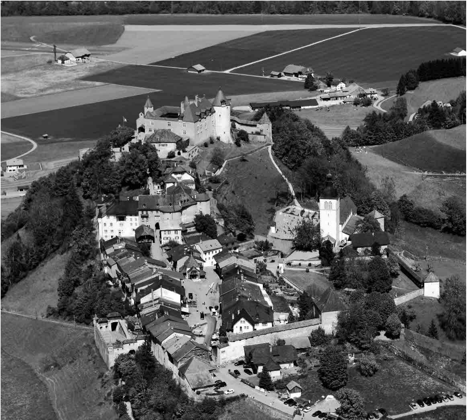
Photo aérienne Bruno Pellandini 2005, © Service des biens culturels, Fribourg

Petite ville médiévale figurant parmi les sites les plus visités de la Suisse. Paysage fascinant dominé par le Moléson. Bâti en tension ouverte sur la crête d'une colline en dos d'âne barrant l'Intyamon. Ancien château comtal isolé à l'extrémité supérieure du bourg. Implantation latérale de l'église.