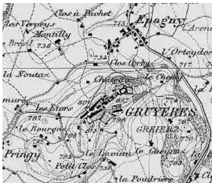
Carte Siegfried 1888

Petite ville médiévale figurant parmi les sites les plus visités de la Suisse. Paysage fascinant dominé par le Moléson. Bâti en tension ouverte sur la crête d'une colline en dos d'âne barrant l'Intyamon. Ancien château comtal isolé à l'extrémité supérieure du bourg. Implantation latérale de l'église.