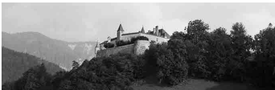
17 Ancien château des comtes de Gruyère