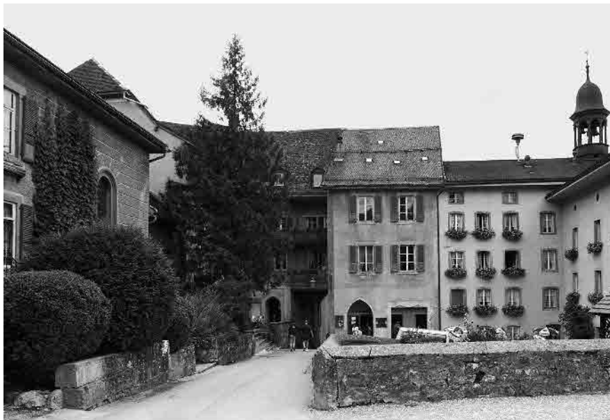
13 Bourg d'En-haut

Commune de Gruyères, district de la Gruyère, canton de Fribourg