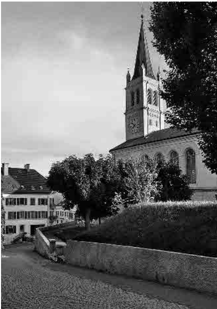
7 Temple historiciste