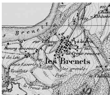
Carte Siegfried 1885

Petite localité horlogère sur une pente faisant face à la France. Structure géométrique créée au milieu du 19 e siècle, inspirée des villes voisines. Interaction entre les rues principales et le Doubs.