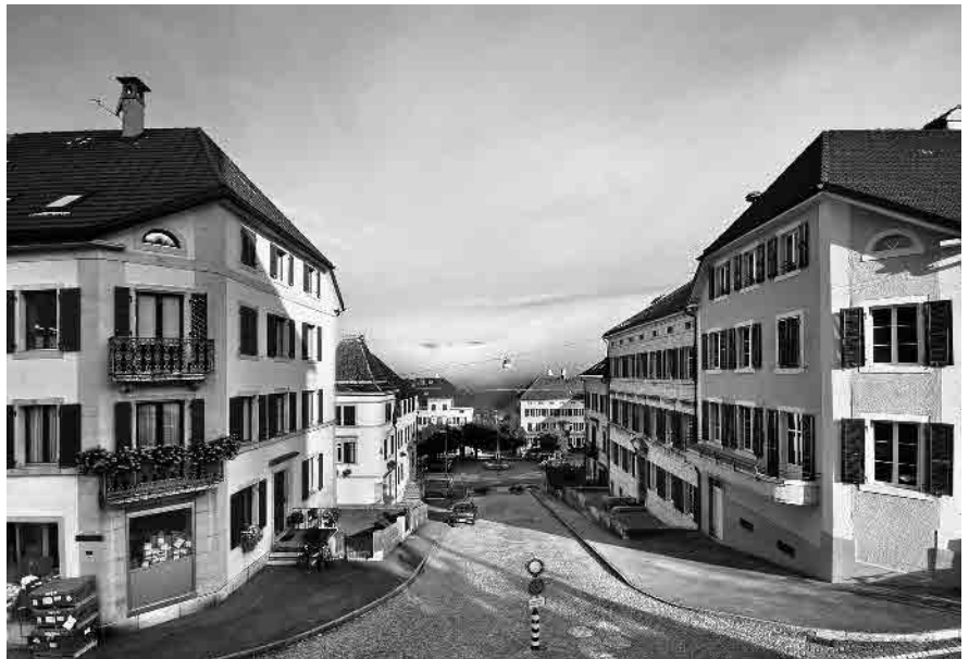
4 Axe transversal principal