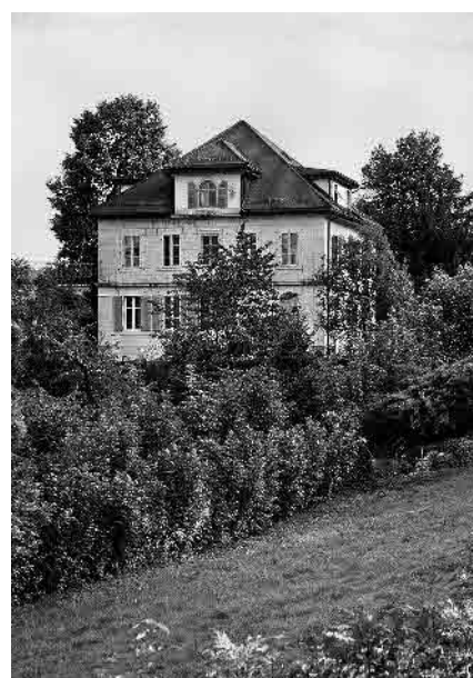
20 Ancienne villa Droz