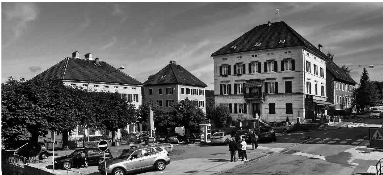
18 Place plantée de marronniers