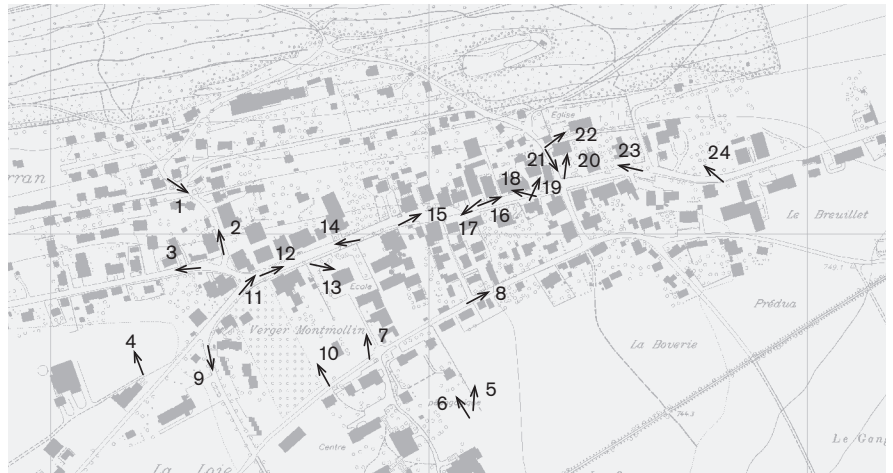
Direction des prises de vue 1: 10 000 Photographies 2008 : 1-24