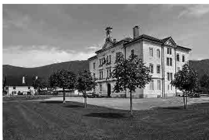
13 Collège primaire