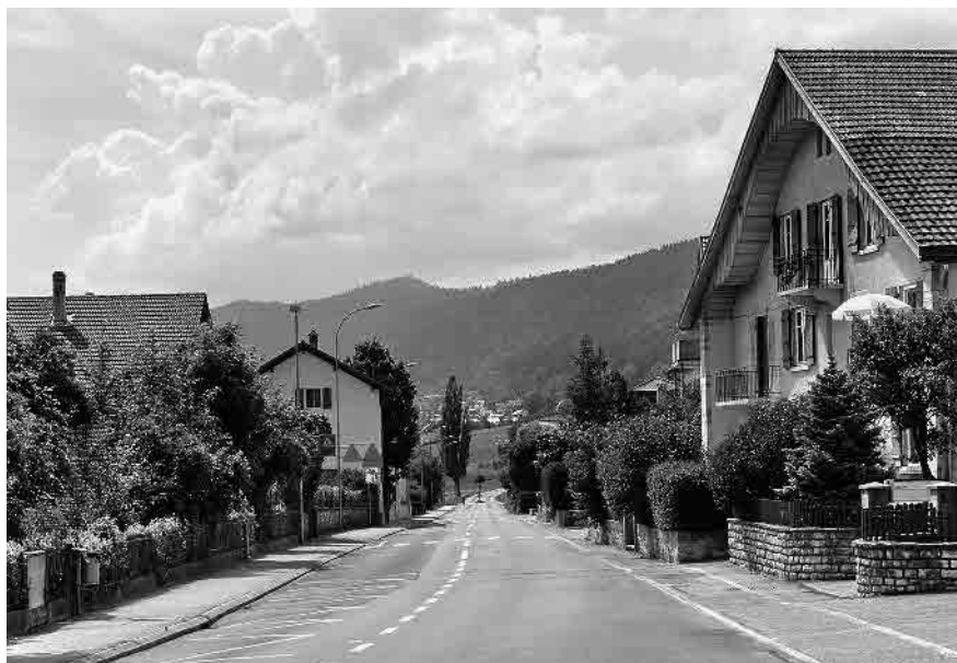
3 Le Faubourg