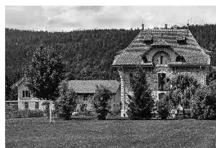
6 Ancien Orphelinat Borel