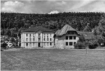
7 Collège primaire