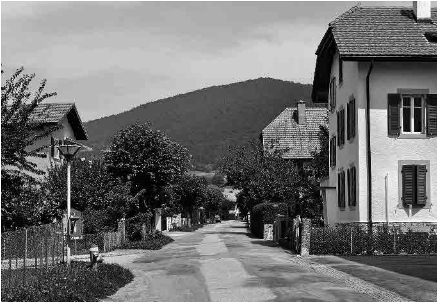
8 Quartier axé sur le Ruz Chasseran