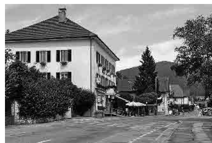
15 Hôtel de Commune