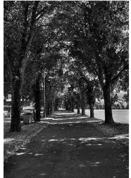
9 Allée de tilleuls