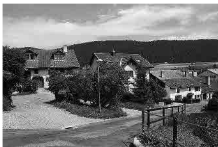
1 Les Crêts

Commune de Dombresson, district du Val-de-Ruz, canton de Neuchâtel