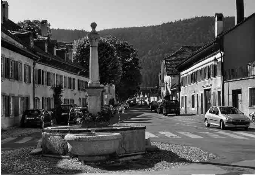
8 Place du village