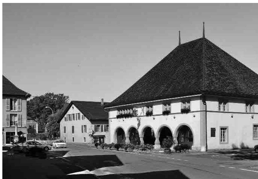
7 Hôtel des Six Communes, 16 e s.