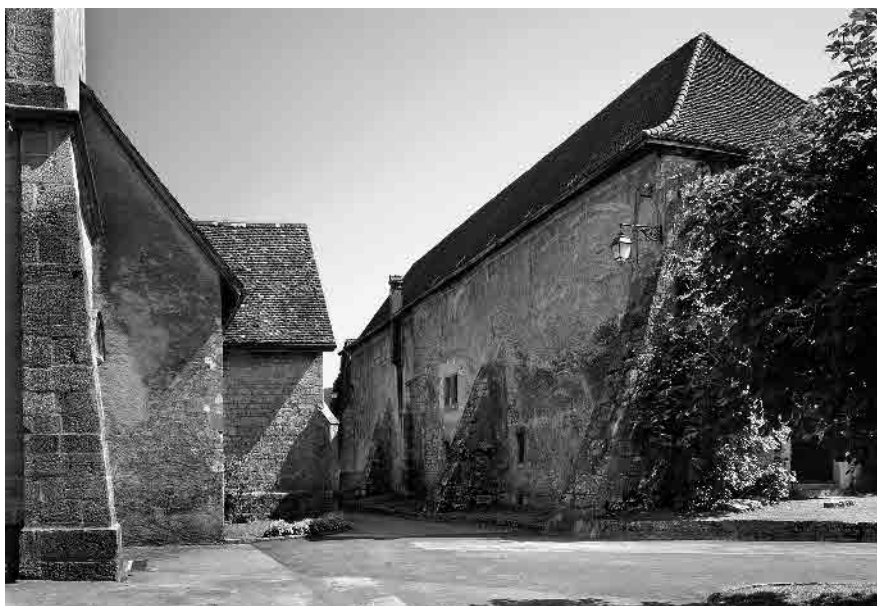
3 Ancien prieuré