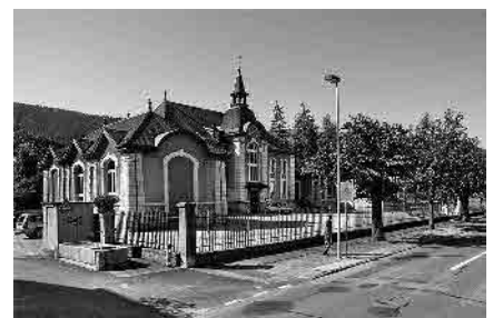
20 Collège, 1900