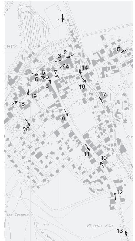
Direction des prises de vue 1: 10 000 Photographies 2008: 1-20