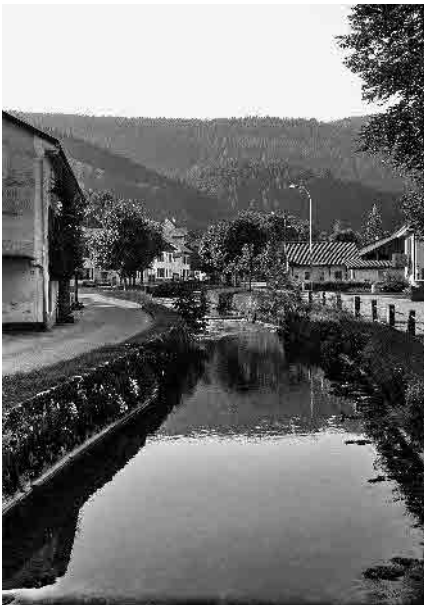
16 Le Bied