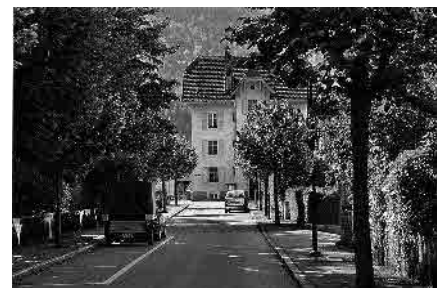
19 Rue de Comblémine