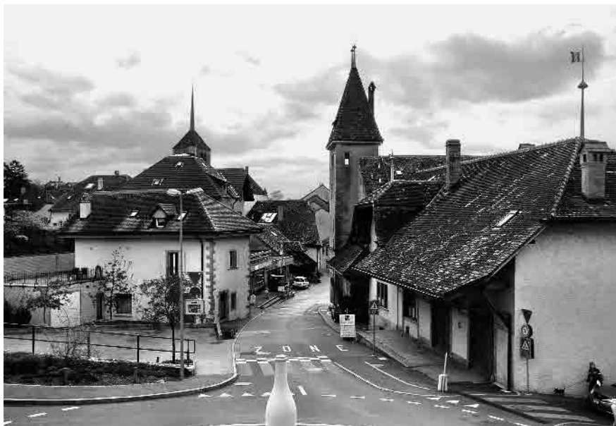
5 Quartier du bas