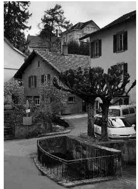
11 Le Ruau