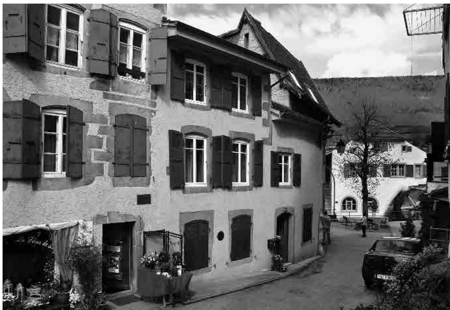
17 Quartier du haut