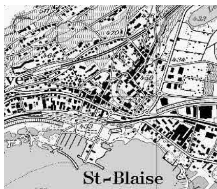
Carte nationale 2005