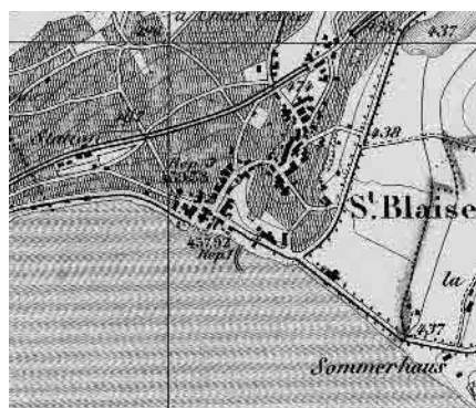
Carte Siegfried 1875

Localité viticole formée de trois tissus égrenés sur le cours d'un ruisseau. Structure triangulaire du quartier centré sur le temple. Implantation en balcon du périmètre supérieur. Quartier de la gare.