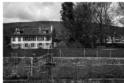
24 Maison du Tilleul