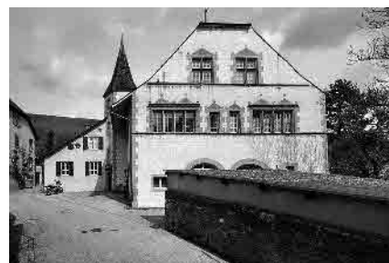
23 Maison de la Dîme