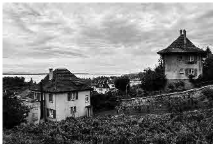
2 Quartier de la gare