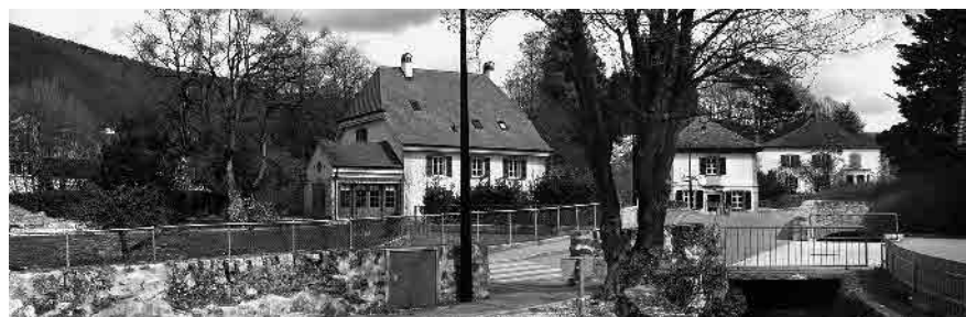
26 Groupement de maisons de maître