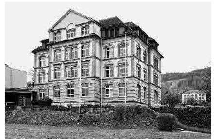
31 Sekundarschulhaus, 1900/01