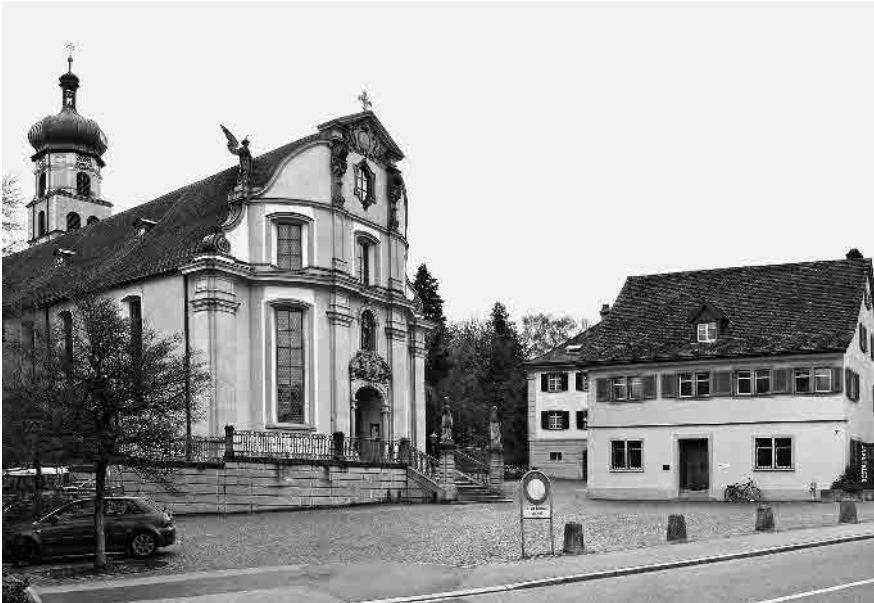
5 Kolumbankirche, seit 1438

Gemeinde Rorschach, Wahlkreis Rorschach, Kanton St. Gallen