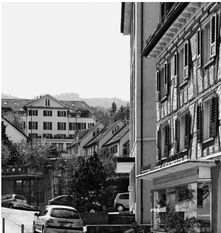
17 Ehem. Brauerei Wachsbleiche, wohl 1857/58