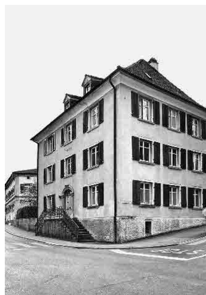
19 Berghaus, 1824