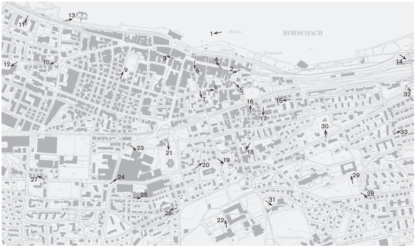
Plangrundlage: Übersichtsplan des Kantons St. Gallen UP5, © Benützung der Daten der amtlichen Vermessung durch die kantonale Vermessungs- aufsicht bewilligt, 18. September 2012 Fotostandorte 1:10 000 Aufnahmen 2011: 1–33