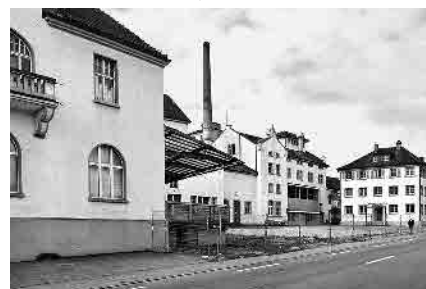
12 Brauerei Löwengarten, 1871–2006