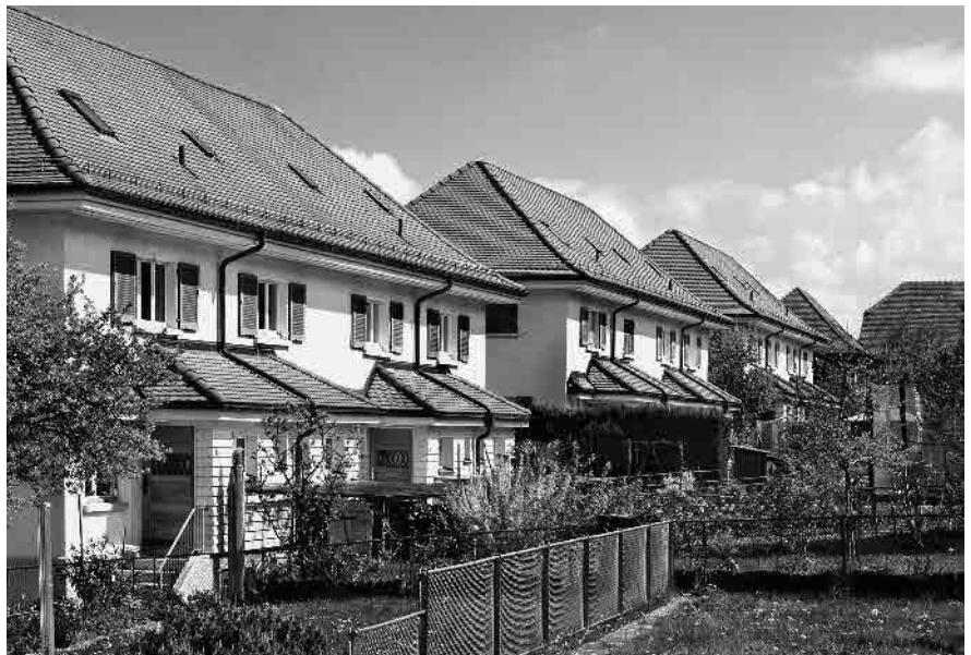
33 Eisenbahnersiedlung, 1912