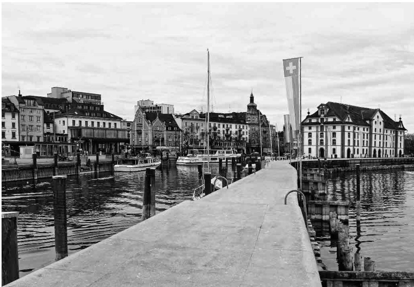
1 Rorschacher Hafen mit Kornhaus von 1746–49

Gemeinde Rorschach, Wahlkreis Rorschach, Kanton St. Gallen