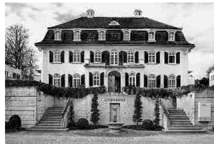
11 Lindenhof, 1925/26