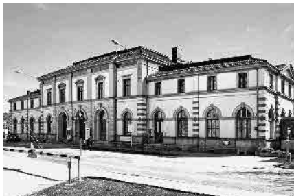
14 Hauptbahnhof, 1893

Gemeinde Rorschach, Wahlkreis Rorschach, Kanton St. Gallen