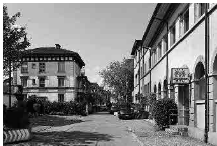
15 Ehem. Holzschraubenfabrik, 1907