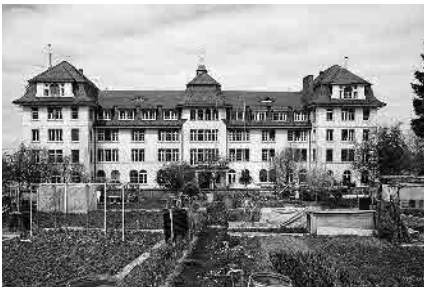
29 Stella Maris, 1912-14