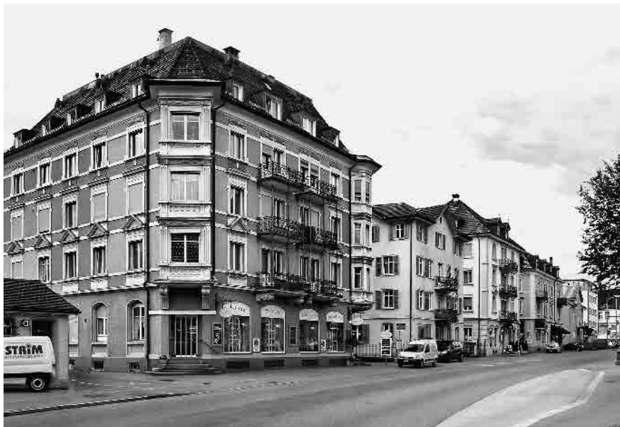
10 Sankt Galler Strasse