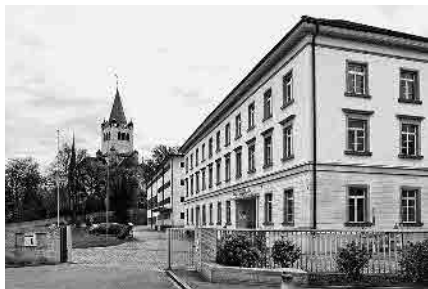
23 Feldmühle, seit 1844

Gemeinde Rorschach, Wahlkreis Rorschach, Kanton St. Gallen