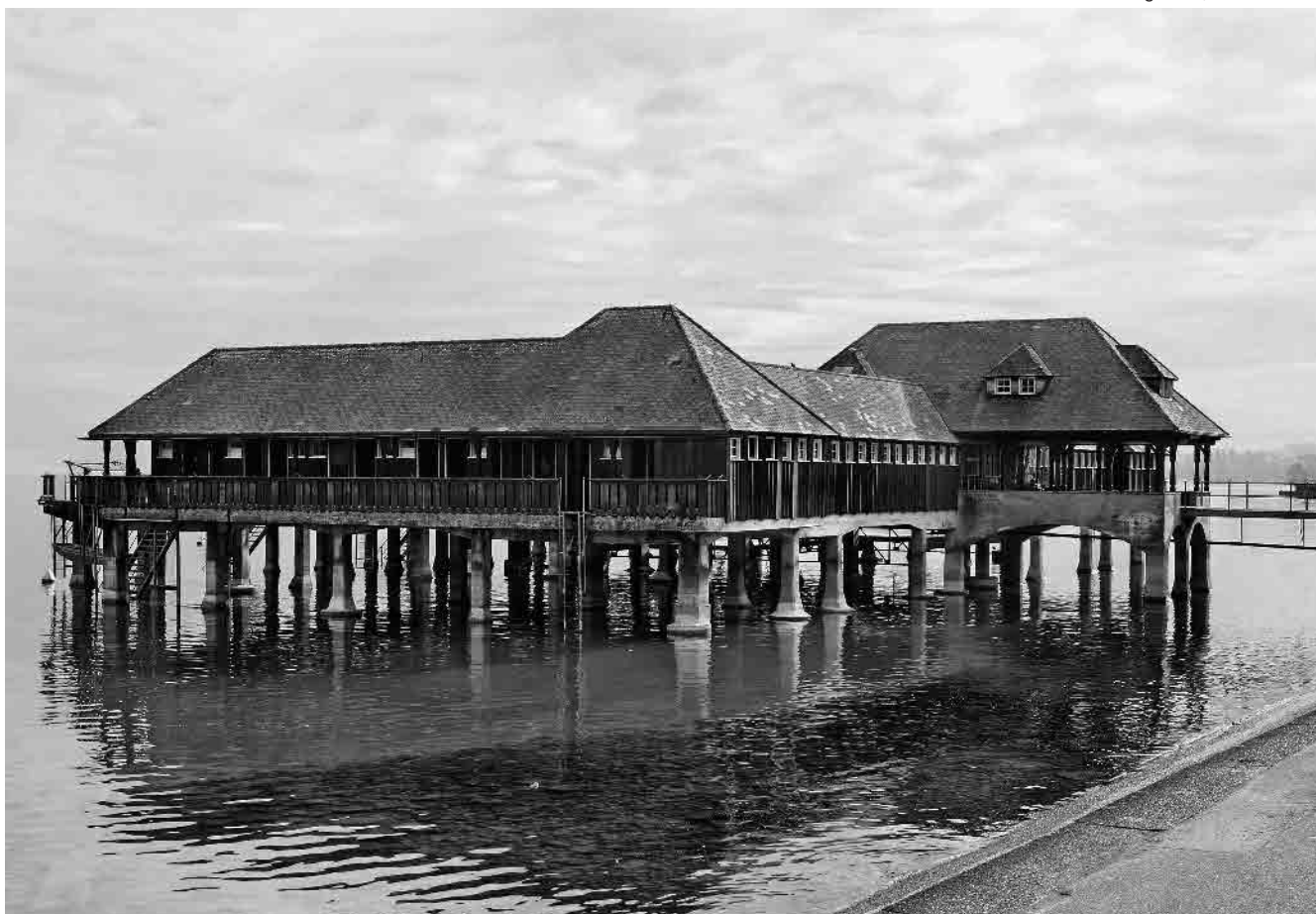
13 Seebadeanstalt, 1923/24