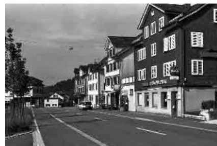
16 Ortsteil Im Feld