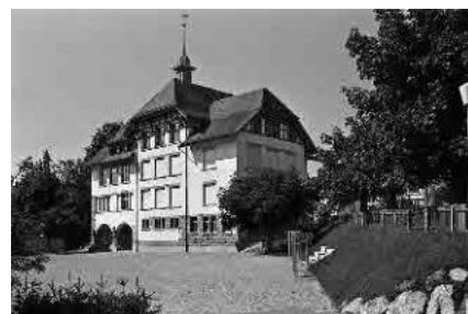
12 Schulhaus Sennrüti, 1904-05