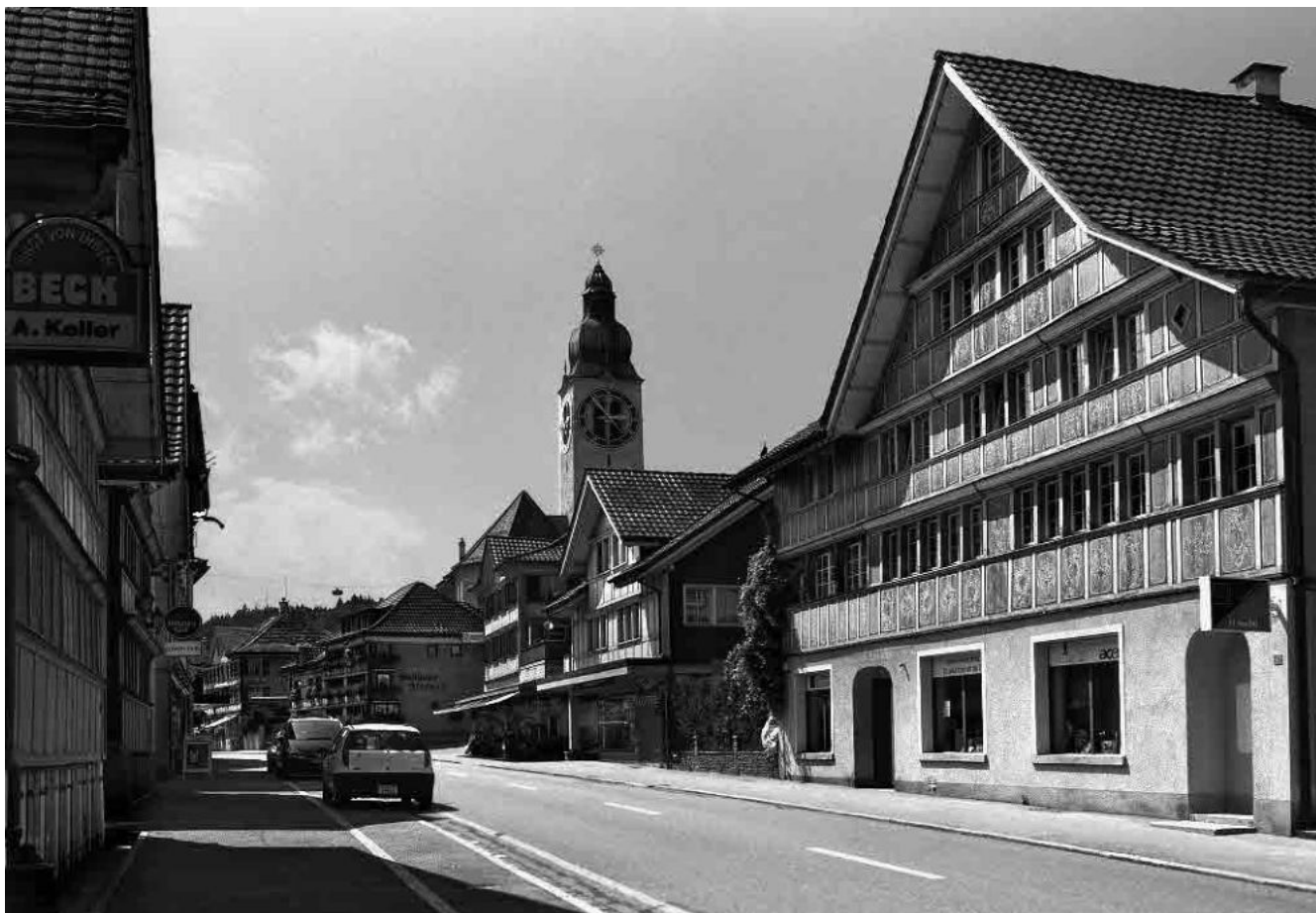
1 Ortskern und kath. Pfarrkirche St. Jakobus