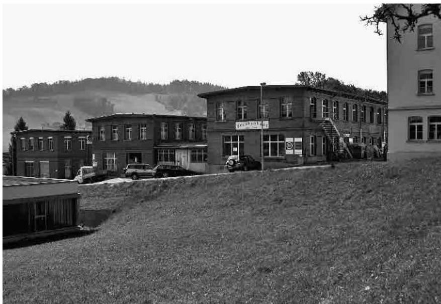
21 Ehem. Stickereifabrik Grauer

Gemeinde Degersheim, Wahlkreis Wil, Kanton St. Gallen