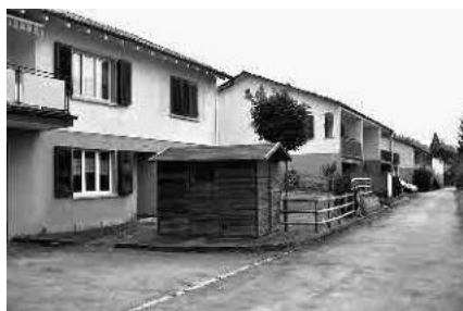
29 Wohnviertel Weierwies