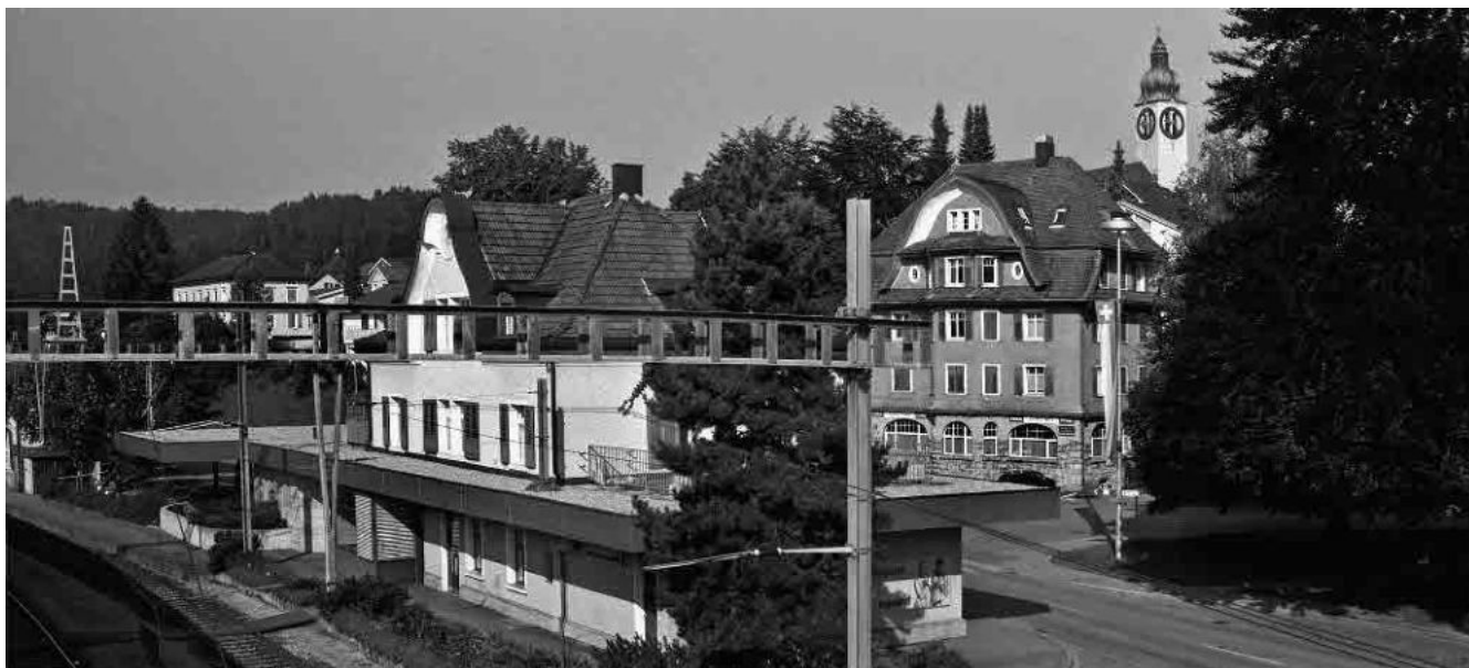
27 Bahnstation von 1910