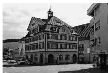
4 Gemeindehaus, 1908