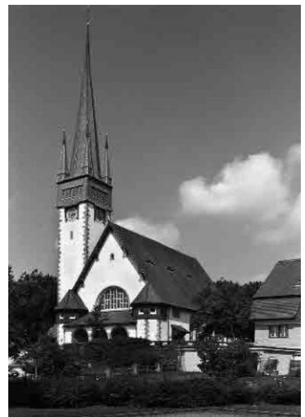
8 Ref. Pfarrkirche, 1906–08