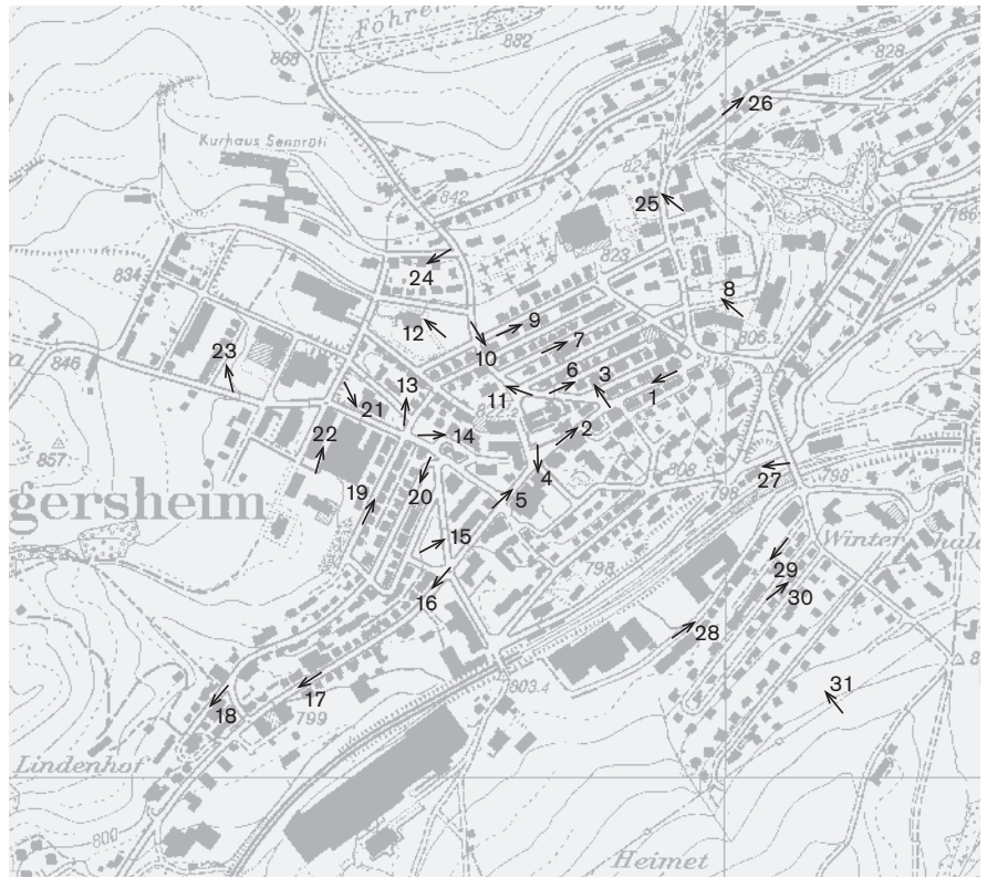
Fotostandorte 1: 10 000 Aufnahmen 2005: 1–31