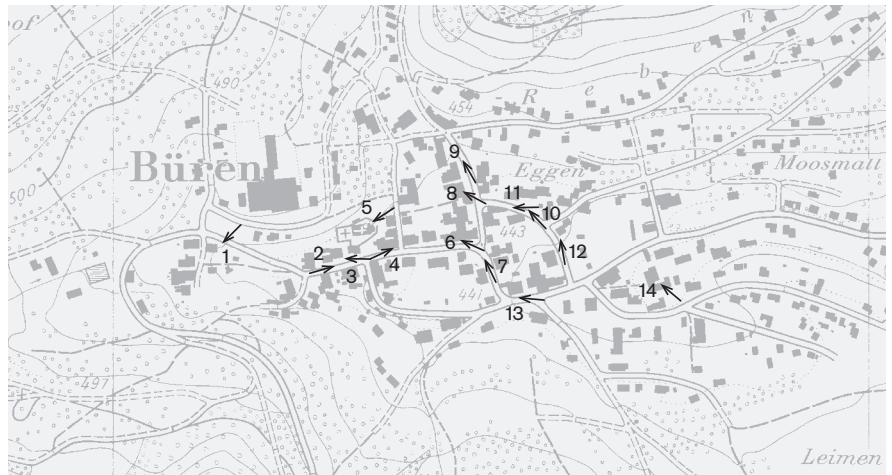
Plangrundlage: Rasterdaten des Übersichtsplan 1:10000, © Amtliche Vermessung Kanton Solothurn Fotostandorte 1: 10 000 Aufnahmen 2009: 1–14