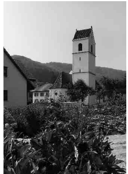
5 Kath. Kirche St. Martin, 15.–18. Jh.