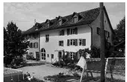
14 Sog. Schlössli