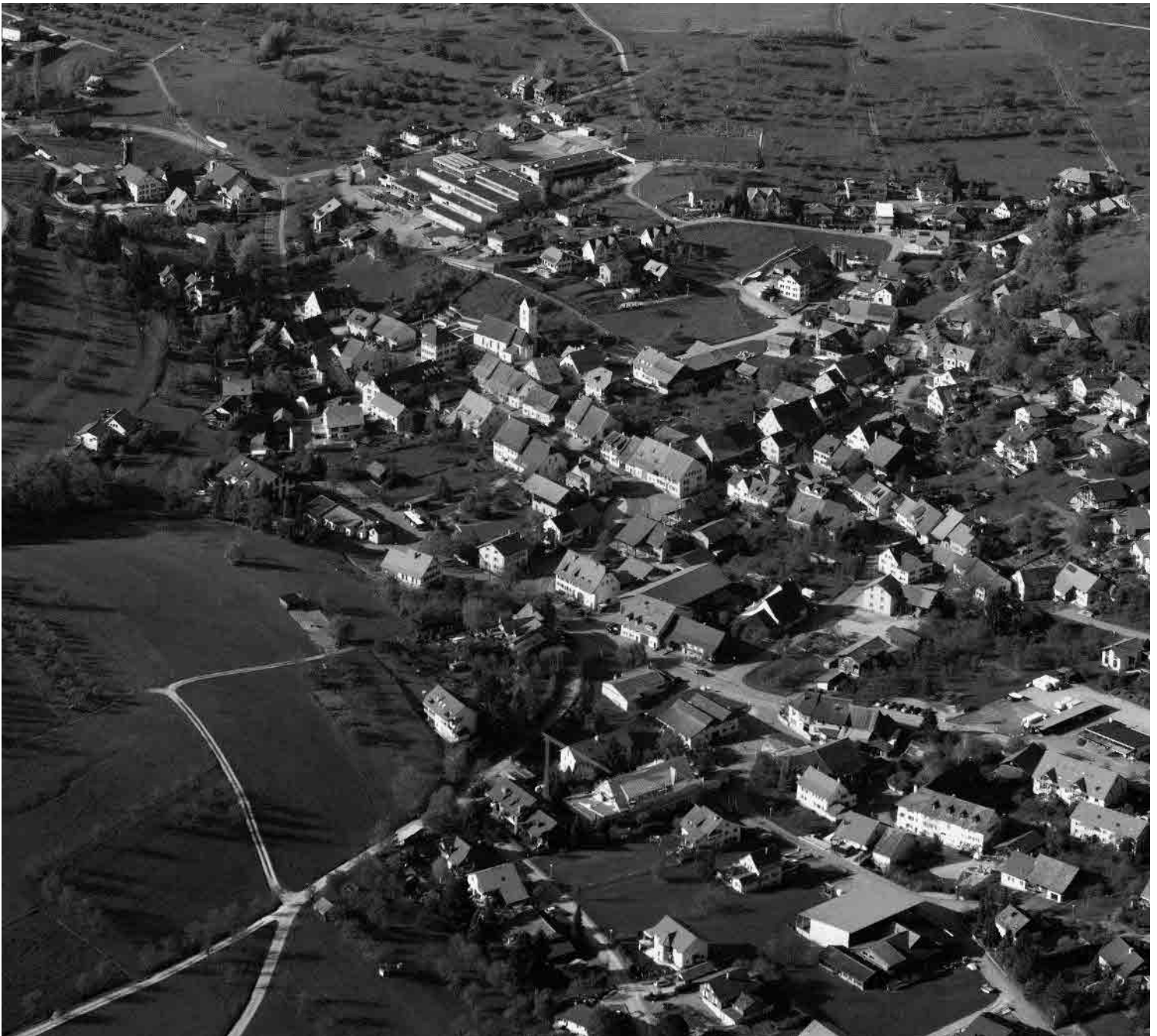
Flugbild Bruno Pellandini 2008, © BAK, Bern

Pfarrdorf in einer engen Talmulde im nördlichsten Zipfel des Solothurner Juras. Interessante Verwebung von strassen- und haufendorfartigen Abschnitten sowie starke Hierarchie zwischen gerader Durchgangsachse und geschwungenen Nebenarmen. Intakte Mühlegruppe aus dem 17. Jahrhundert.