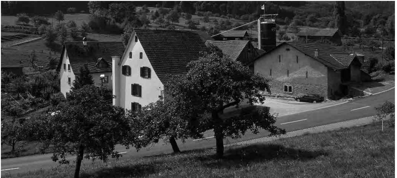
1 Mühlegruppe, 17.-20. Jh.

Gemeinde Büren, Bezirk Dorneck, Kanton Solothurn