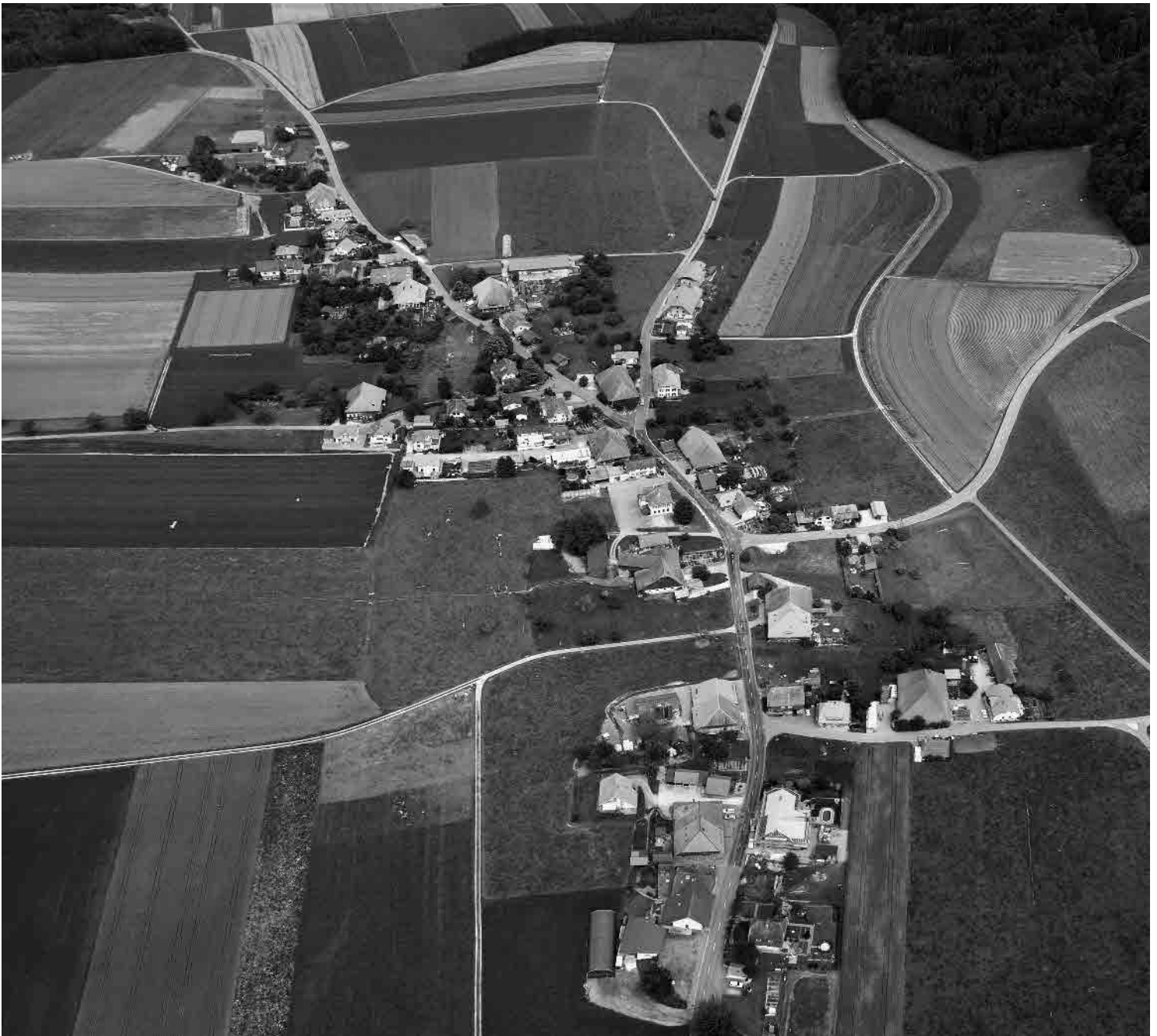
Flugbild Bruno Pellandini 2009, © BAK, Bern