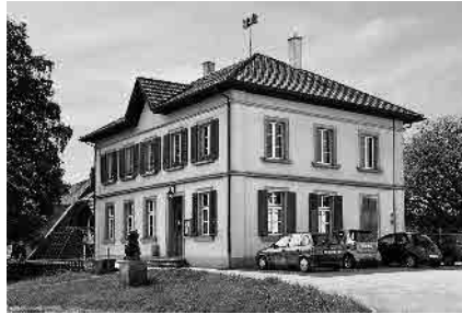
8 Schulhaus, 1892