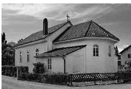
15 Religiöser Versammlungsbau