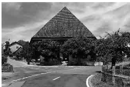
11 Gasthaus «Sternen», 1804/05