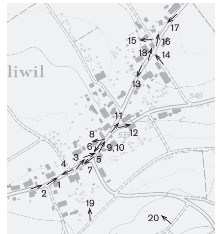
Plangrundlage: Rasterdaten des Übersichtsplan 1:10000, © Amtliche Vermessung Kanton Solothurn Fotostandorte 1: 10 000 Aufnahmen 2009: 1–20