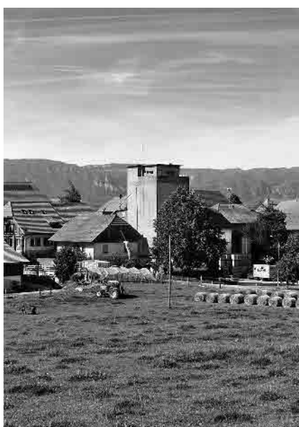
3 Ehem. Mühle, Landi