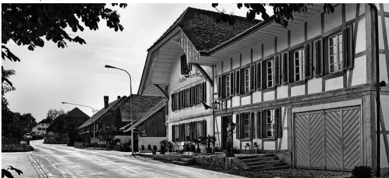
12 Restaurant «Sternen»