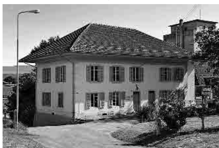
4 Schulhaus, 1853