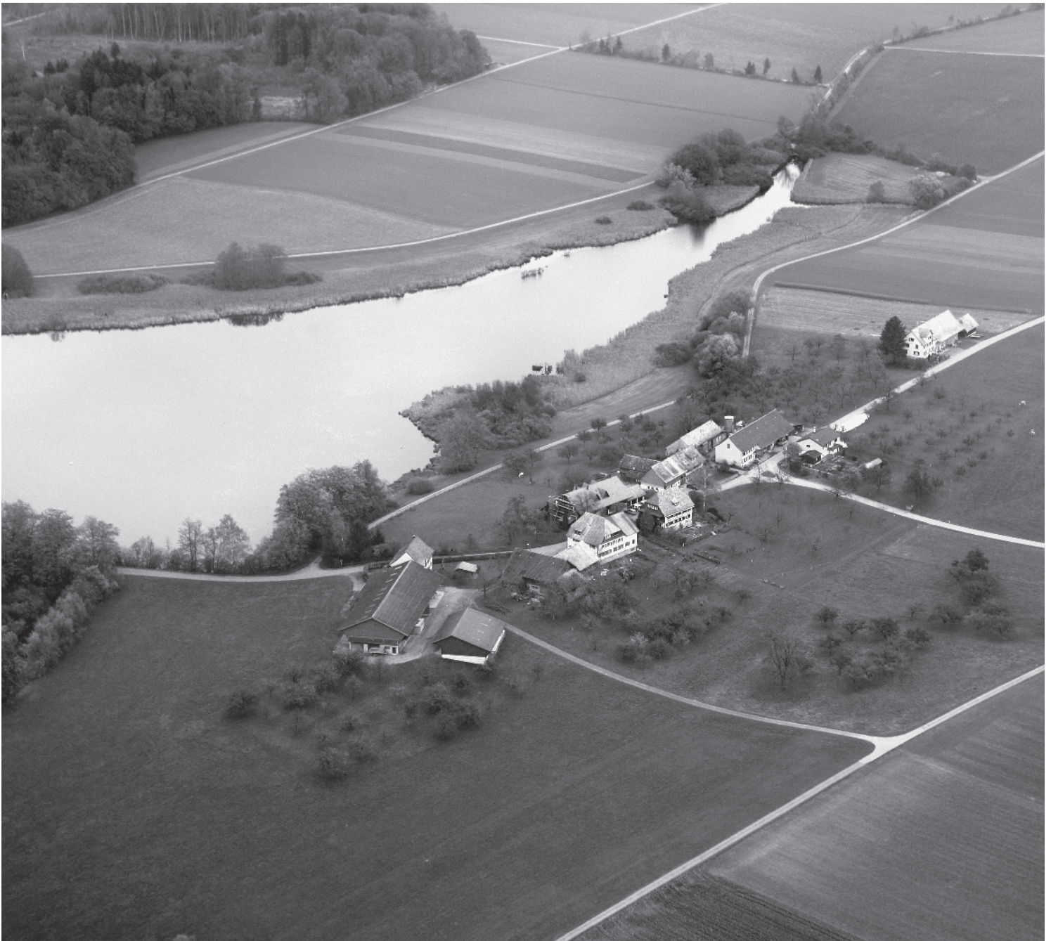
Flugbild Bruno Pellandini 2007 © Amt für Denkmalpflege des Kantons Thurgau

Entlang einer leicht gebogenen Gasse aufgereichte, mehrheitlich intakte Ein- und Mehrzweckgebäude. Bäuerlicher Kleinstweiler in grossartiger Lage abseits jeglicher Siedlung in geschützter Weierlandschaft.