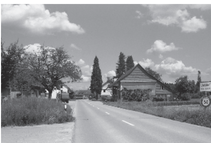
10 Ortseingang West