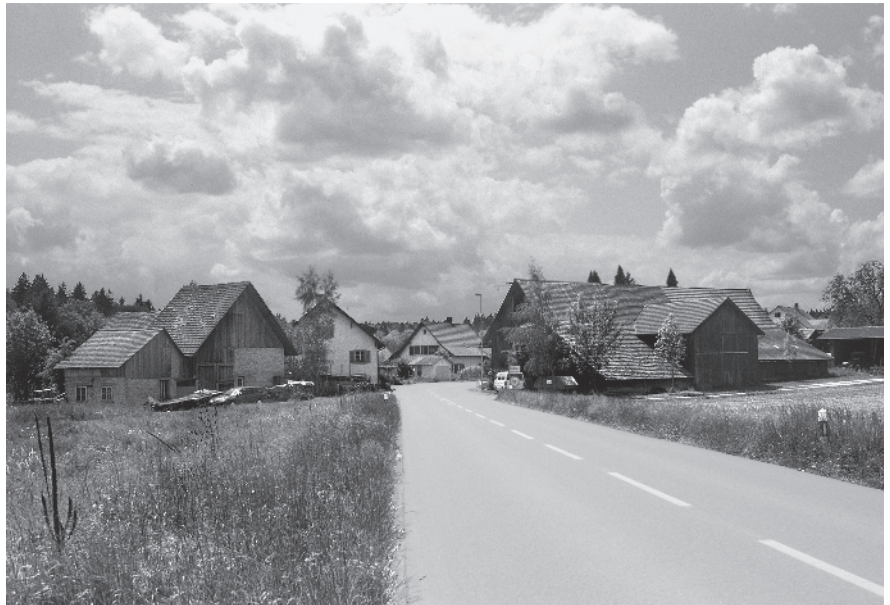
1 Ortseingang Nord