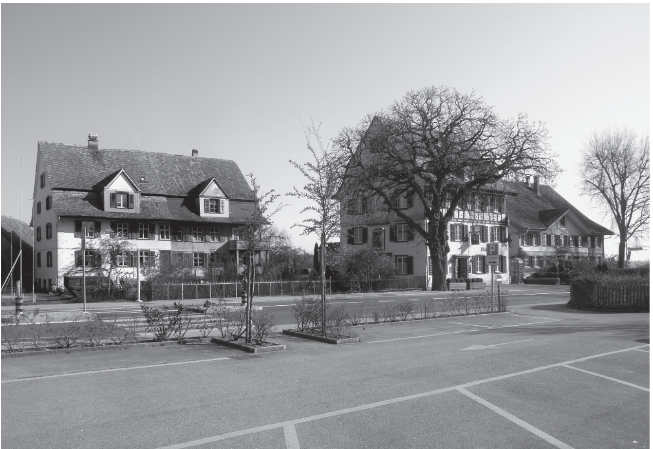
18 Ortszentrum Erlen