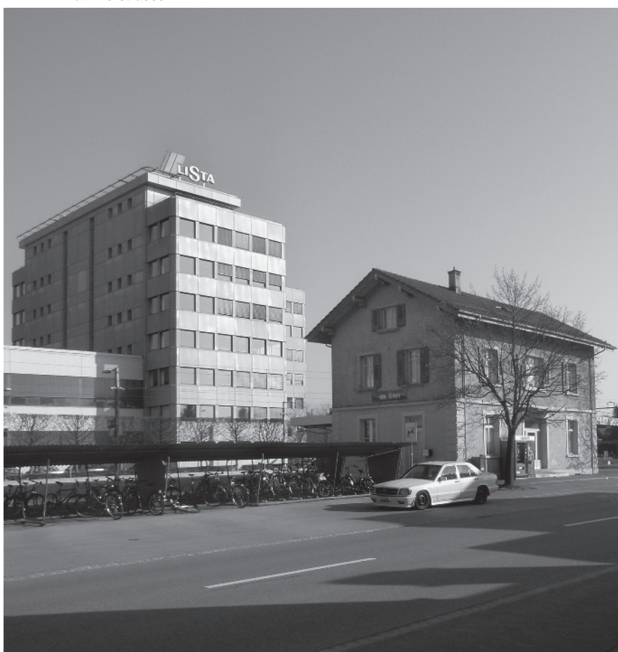
2 Stationsgebäude, 1873