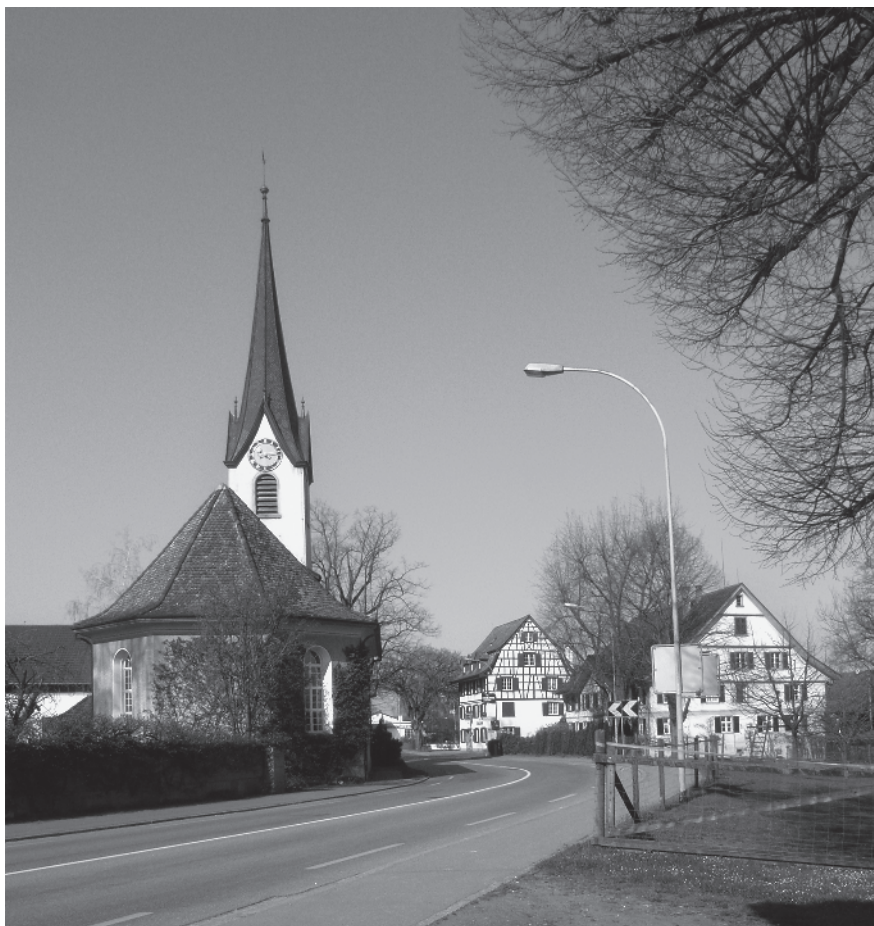
22 Ref. Kirche, 1764