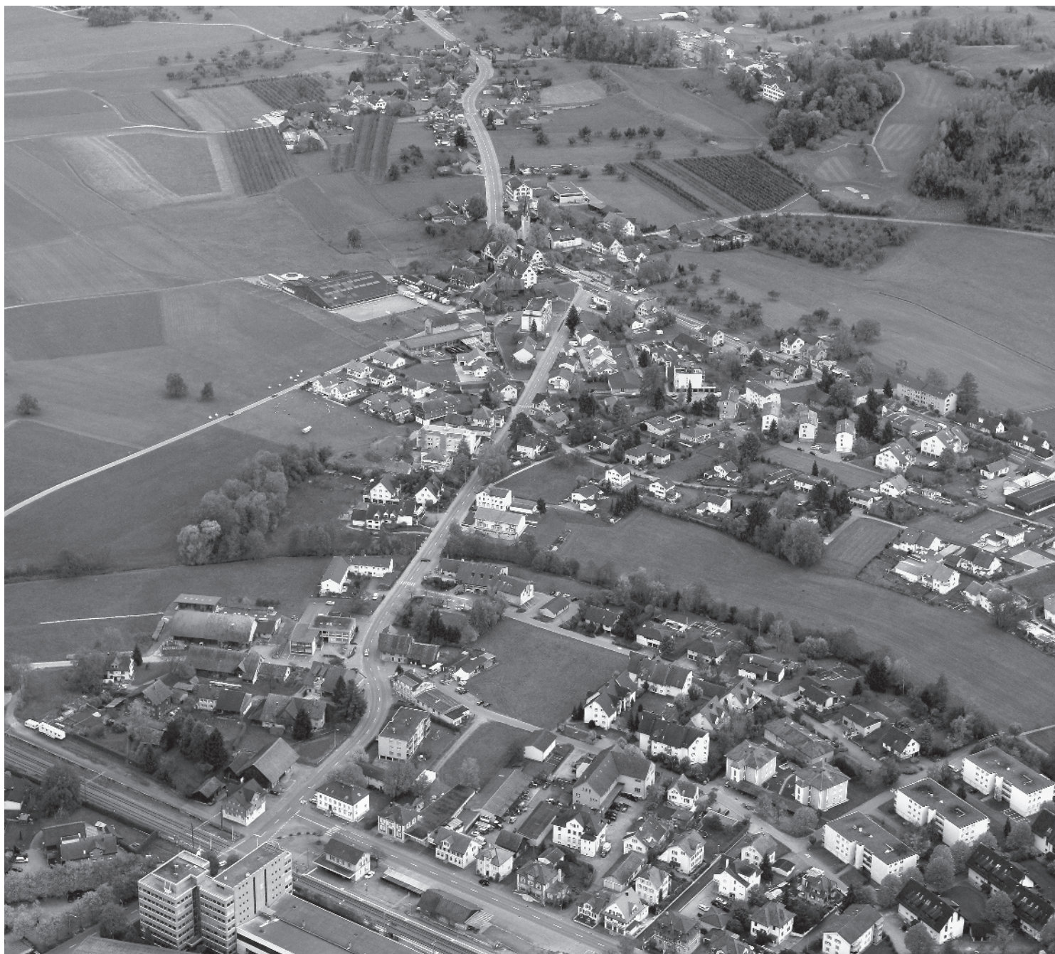
Flugbild Bruno Pellandini 2007 © Amt für Denkmalpflege des Kantons Thurgau

Mehrteiliger Ort entlang Strasse und Bahnlinie mit zwei bäuerlich geprägten Kerneriedlungen am Hangfuss und erhöht situiertem Schloss. Bahnhofsbereich mit strukturstarkem, selten vorkommendem Wohn- und Geschäftshausensemble des ausgehenden 19. Jhs.