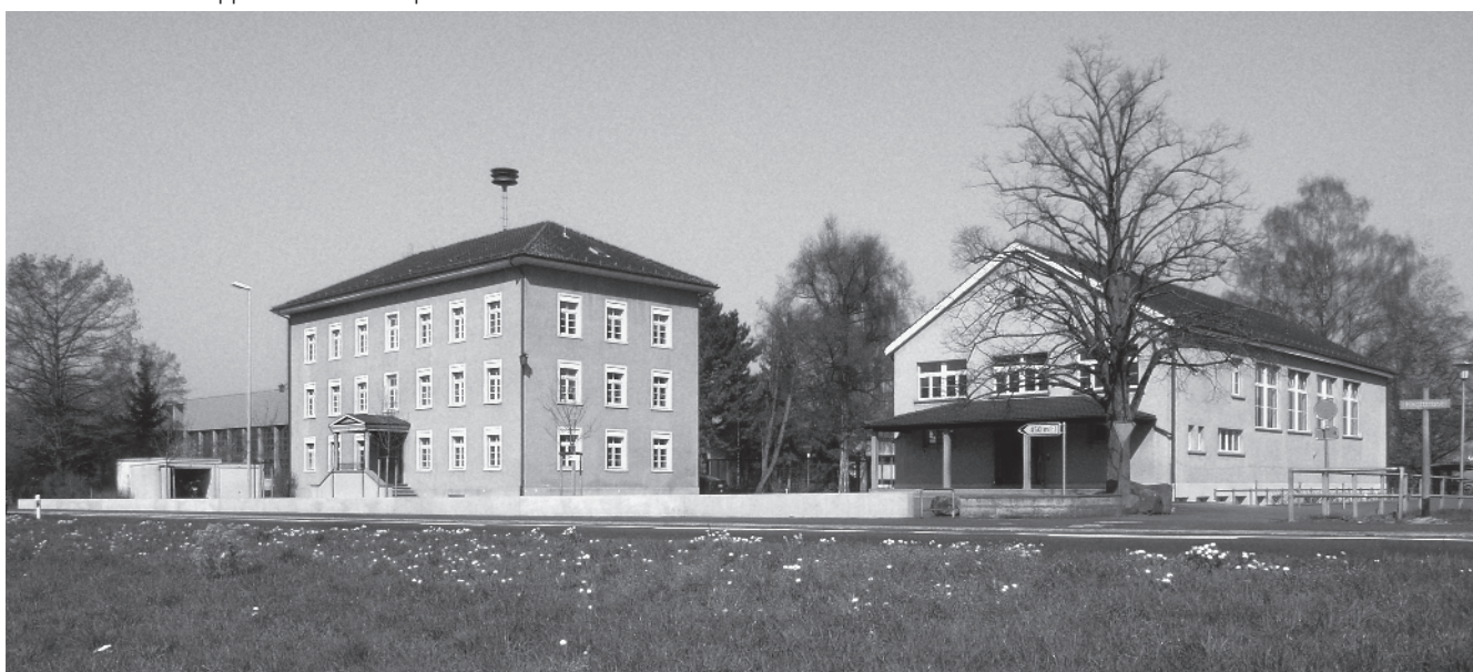
36 Schulhaus und Turnhalle