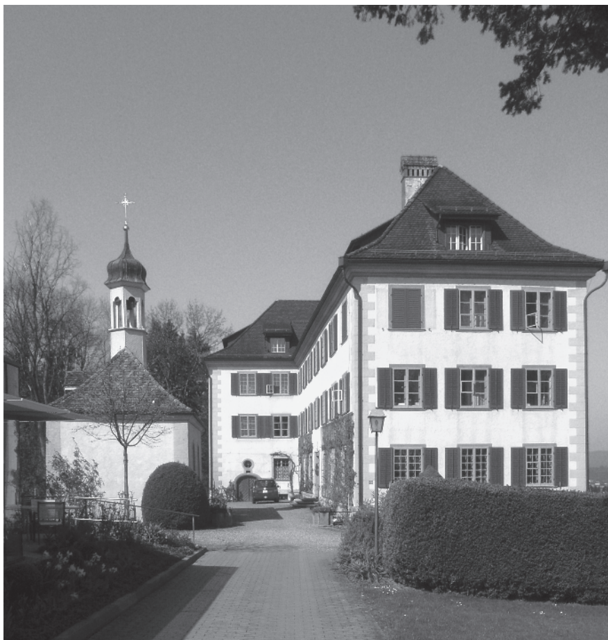
32 Schloss Eppishausen und Kapelle St. Alban