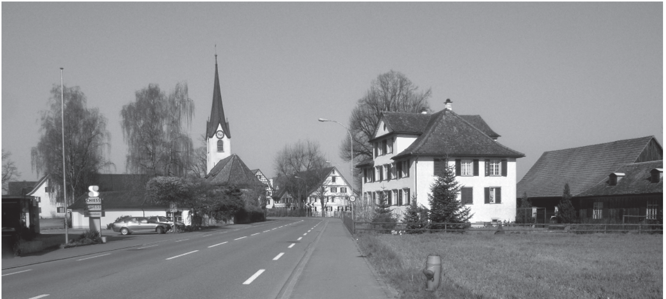
24 Erlen, Ortseingang Ost