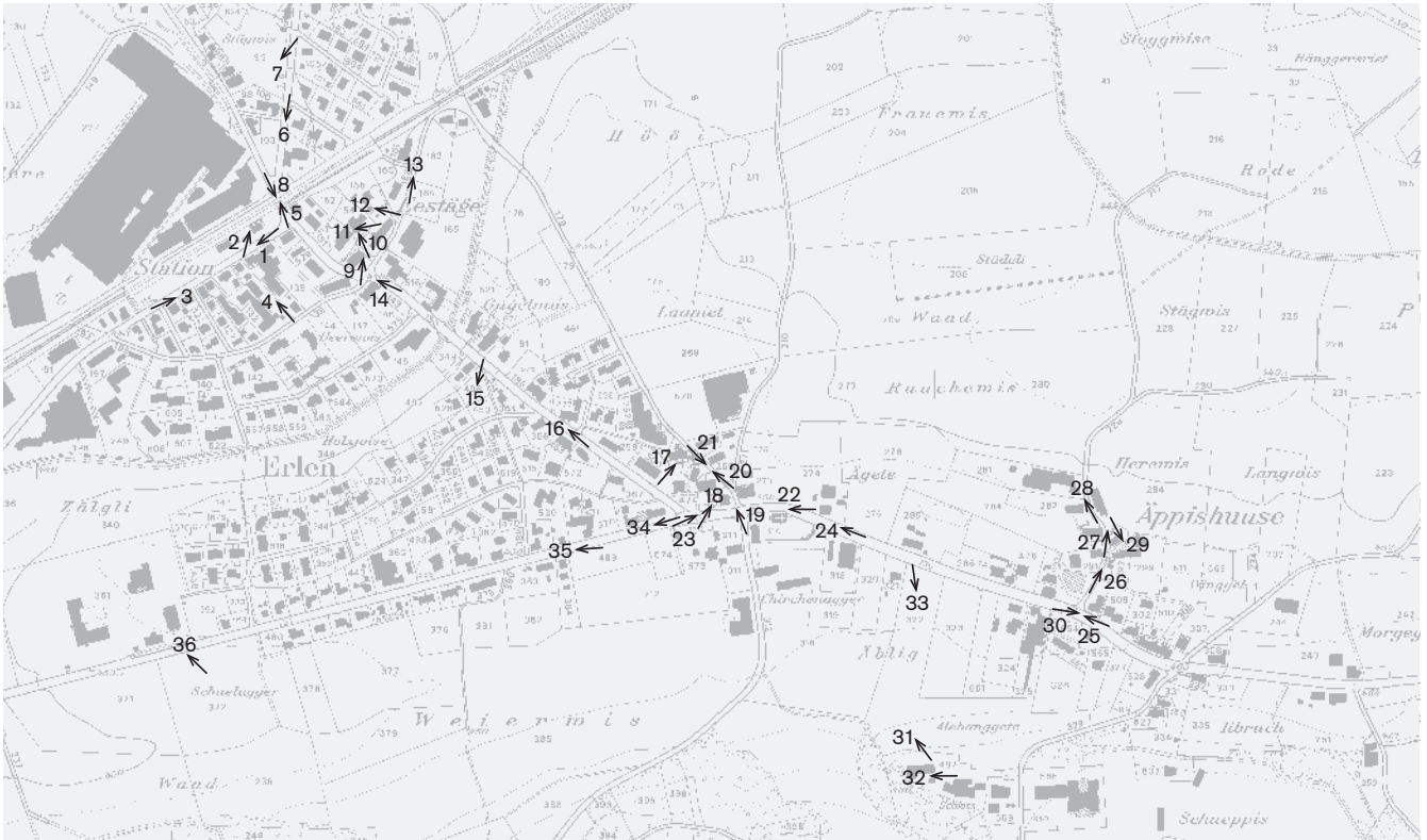
Fotostandorte 1: 10 000 Aufnahmen 2007: 1–36