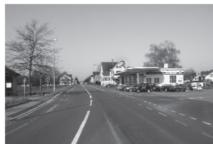
34 Hauptstrasse in Erlen