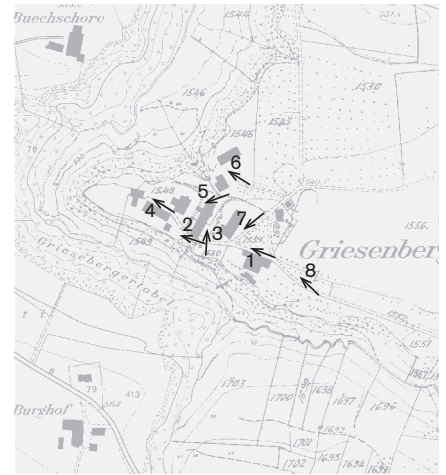
Fotostandorte 1: 10 000 Aufnahmen 2006 1-8