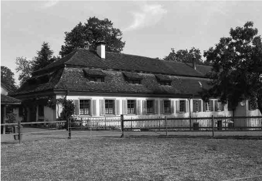
3 Herrschaftshaus in ehem. Burgraben, E.18. Jh.