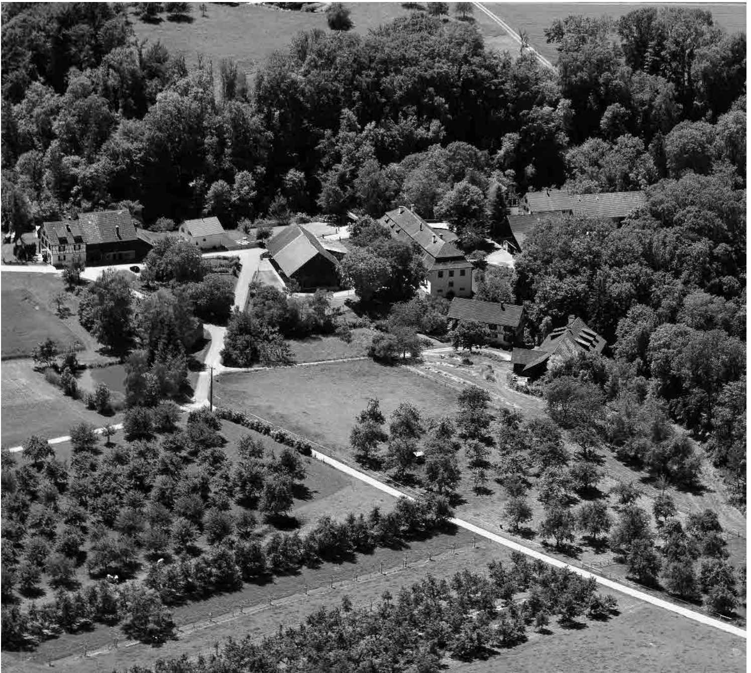
Flugbild Bruno Pellandini 2007 © Amt für Denkmalpflege des Kantons Thurgau

Kleinstort am ehemaligen Standort der Burg der Herren von Griesenberg in eindrücklicher Situation auf einem Felsplateau über dem tiefen bewaldeten Einschnitt des Tobelbachs. Im Burggraben erstelltes barockes Herrschaftshaus sowie zwei Gehöfte; ehemalige Sägerei und Mühle.