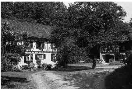
6 Ehem. Burgmühle