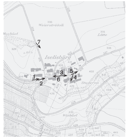
Fotostandorte 1: 10 000 Aufnahmen 2007: 1-7