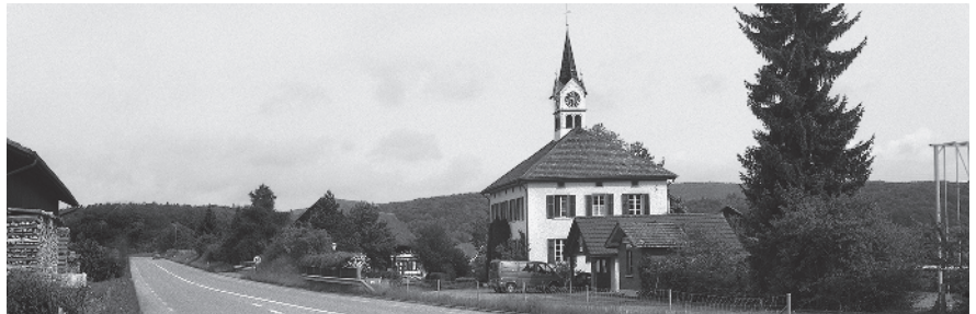
11 Schulhaus, 1873