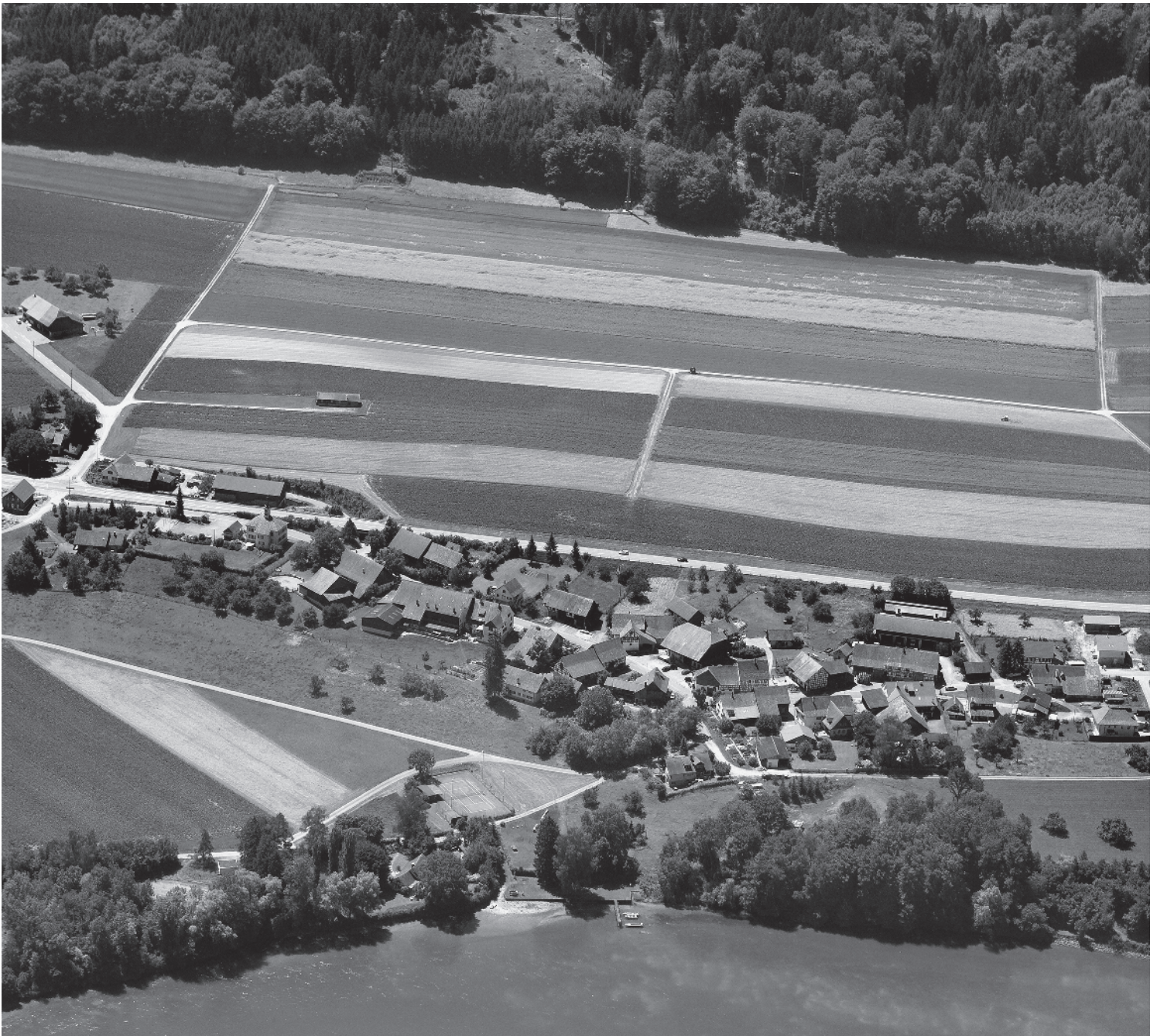
Flugbild Bruno Pellandini 2007 © Amt für Denkmalpflege des Kantons Thurgau

Gemeinde Wagenhausen, Bezirk Steckborn, Kanton Thurgau