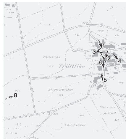
Fotostandorte 1: 10 000 Aufnahmen 2006: 1-8