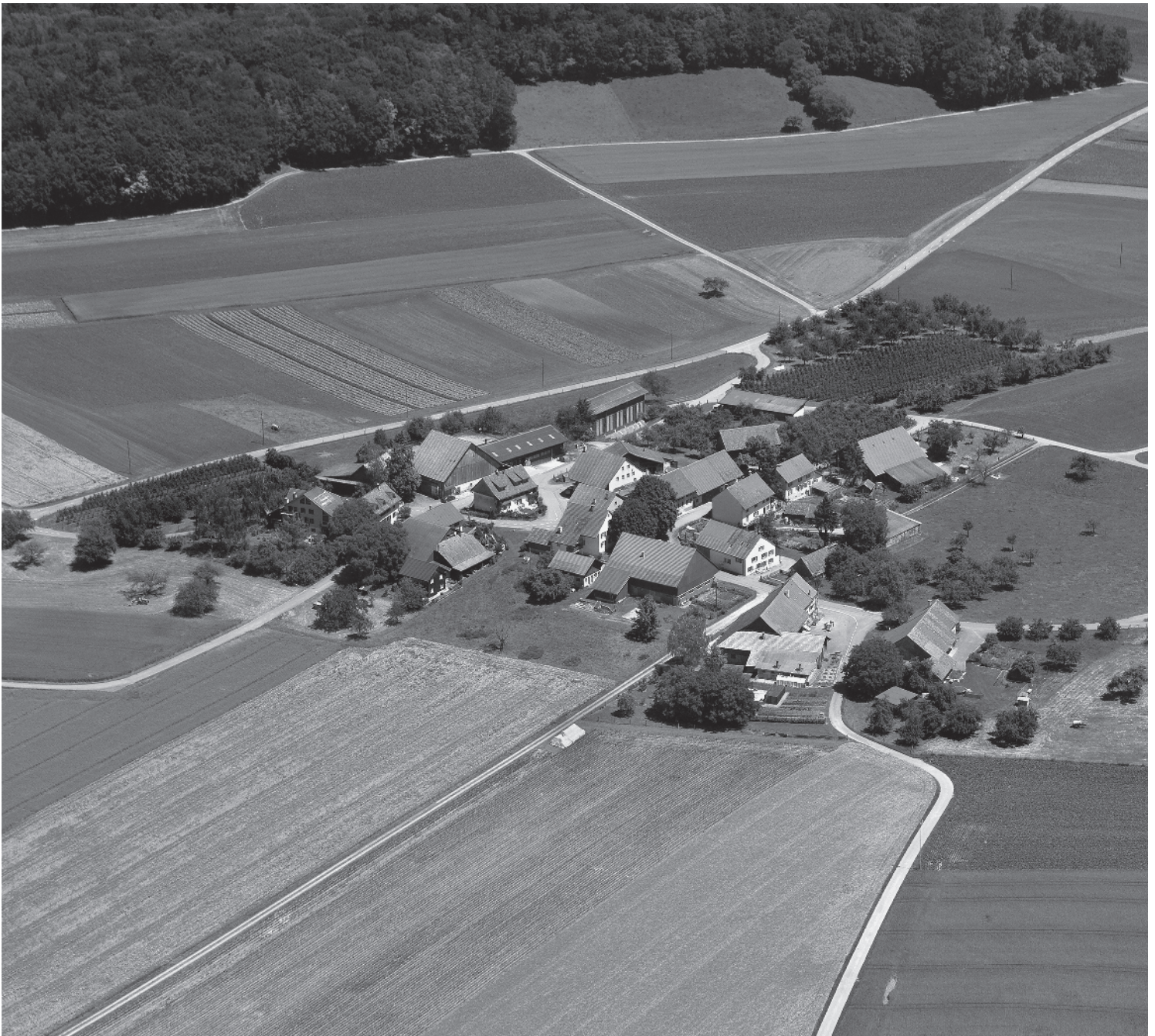
Flugbild Bruno Pellandini 2006 © Amt für Denkmalpflege des Kantons Thurgau

Noch heute durch bäuerliche Nutzung geprägter haufenartiger Weiler in abgeschiedener Lage im Hinterland des Thurtals. Annähernd dreieckige Bebauung mit prägnanter Silhouette durch die Lage auf einer kleinen Anhöhe und dank dem obstbaumbestandenen Wies- und Ackerland, das sie umgibt.