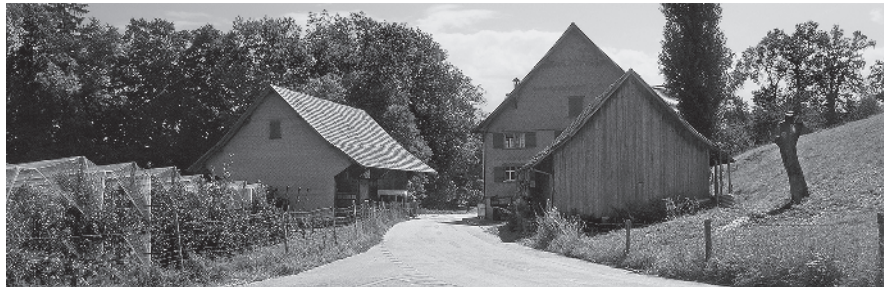
8 Gehöft im Südwesten