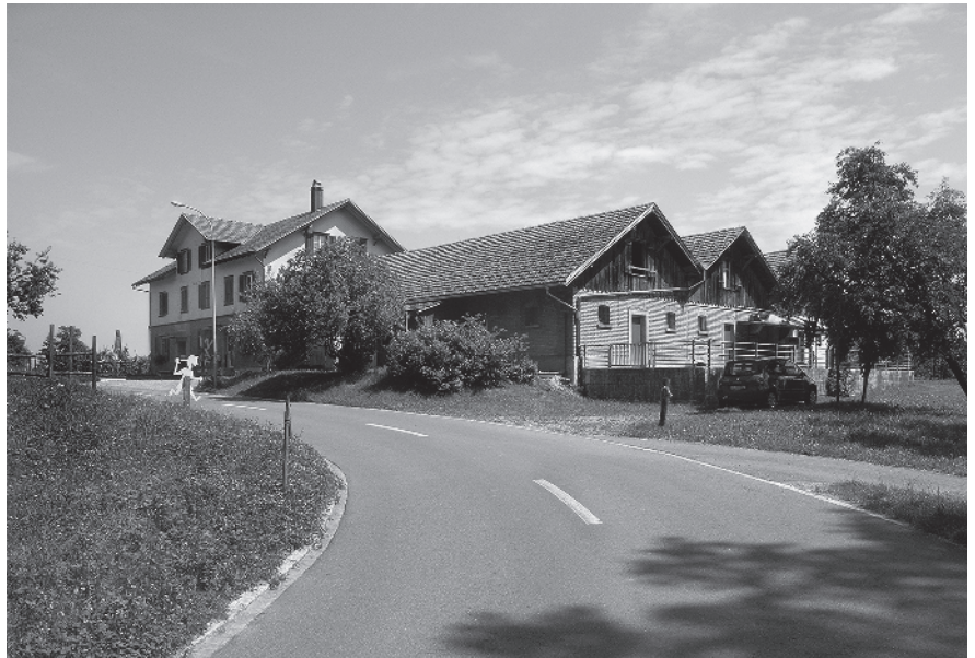
1 Käserei, 1898, und Schweineställe