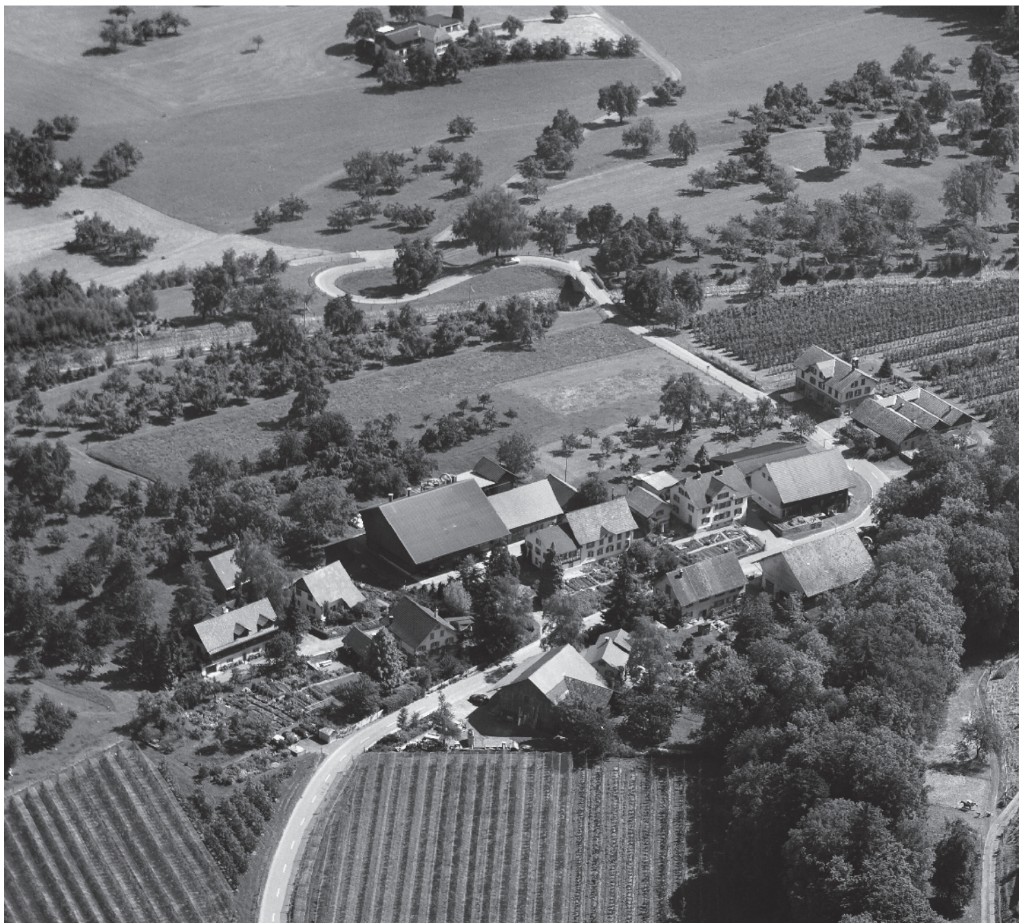
Flugbild Bruno Pellandini 2006 © Amt für Denkmalpflege des Kantons Thurgau

Gemeinde Roggwil, Bezirk Arbon, Kanton Thurgau