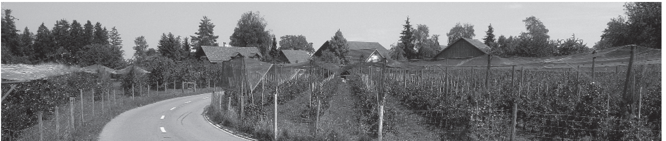
9 Südwestl. Ortseingang