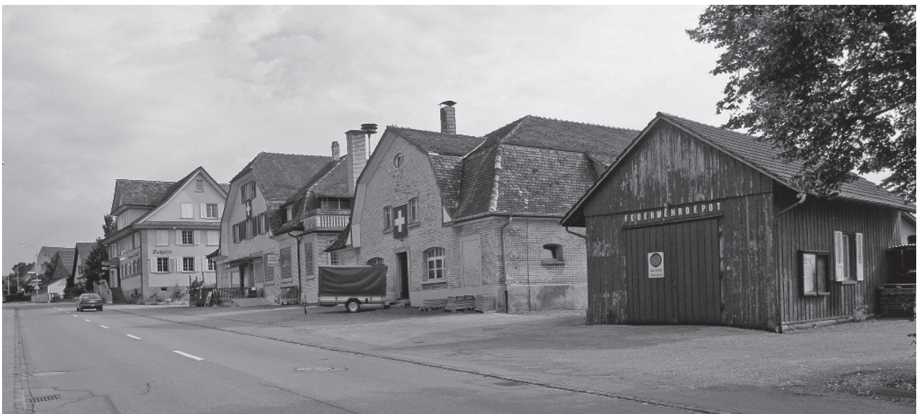
16 Käseerei, 1909