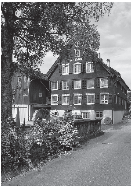
22 Ehem. Mühle, 2. H.18. Jh.