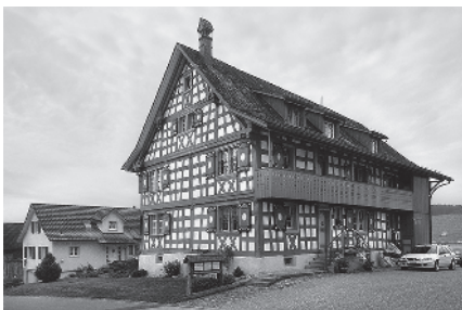
14 Ehem. Gerichtshaus, 1662