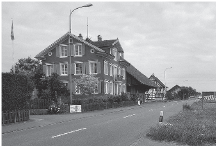
1 Nördl. Ortsausgang

Gemeinde Zihlschlacht-Sitterdorf, Bezirk Bischofszell, Kanton Thurgau