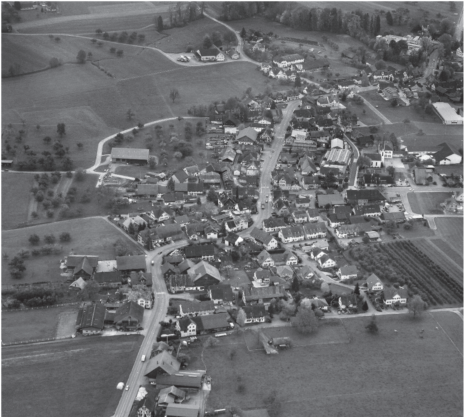
Flugbild Bruno Pellandini 2006 © Amt für Denkmalpflege des Kantons Thurgau

Langes, zum Rötelbach abfallendes Strassendorf umgeben von ausgedehntem Kulturland. Teilweise eng von Ein- und Mehrzweckbauten – darunter Fachwerkgebäude des 18. und 19. Jhs. – gefasster geschwungener Gassenraum mit je einem haufenartigen Bebauungsschwerpunkt im Ober- und Unterdorf.