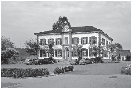
12 Altes Schulhaus, 1877

Gemeinde Zihlschlacht-Sitterdorf, Bezirk Bischofszell, Kanton Thurgau