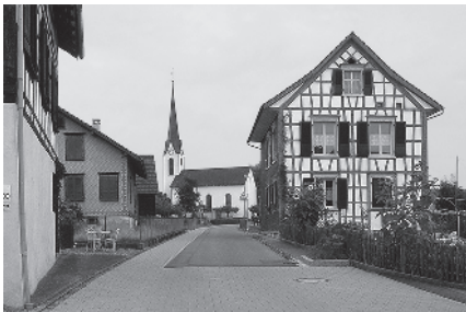
13 Ref. Kirche, Kern 14. Jh.