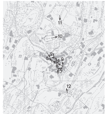
Direzione delle riprese, scala 1:8000 Fotografie 1978: 1, 5, 6, 8, 11 Fotografie 1997: 2-4, 7, 9, 10, 12