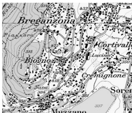
Carta nazionale 2001