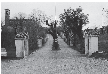
11 Via Crucis alberata