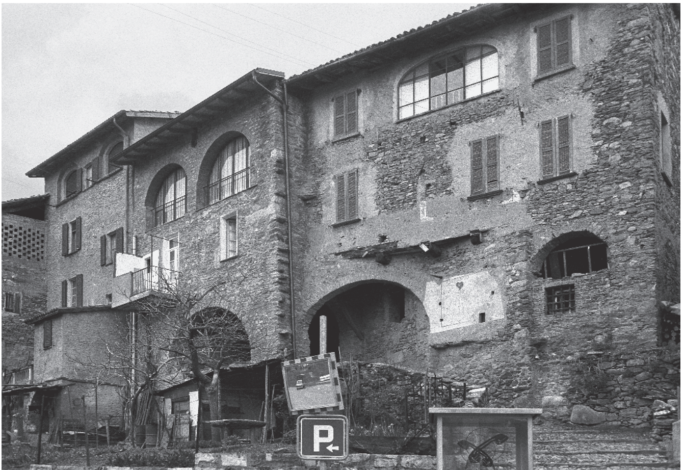
5 Imponente fronte murario di chiusura al nucleo con accesso ad arco