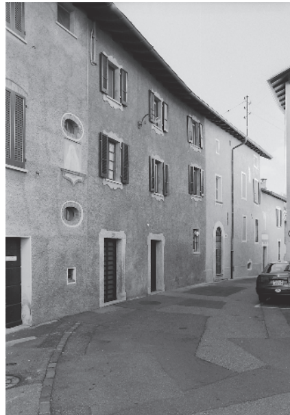
7 Lunga schiera in accesso a sud