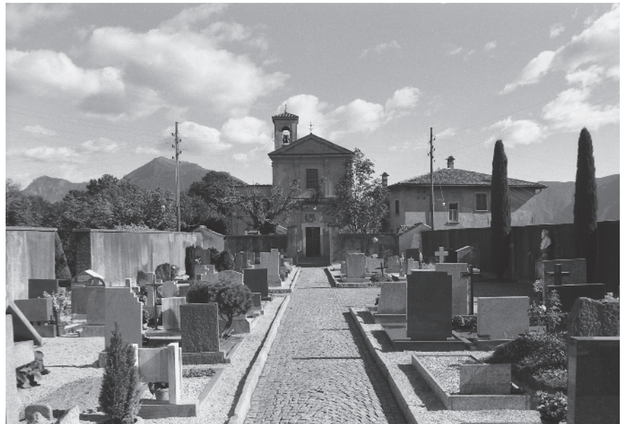
10 Chiesa parrocchiale, riconfigurata nei secc. XVII-XVIII. In primo piano l'area sepolcrale