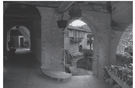
3 Percorso coperto entro il fronte murario