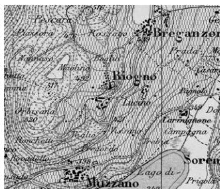
Carta Siegfried 1891

Insedimento a monte del laghetto di Muzzano con nucleo principale rinserrato da un imponente fronte murario sotto cui corre un'ampia galleria. Imponente il complesso ecclesiastico con chiesa, cimitero e Via Crucis, alto sul resto dell'insediamento.