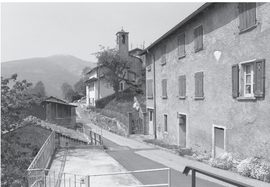
12 Tra nucleo principale e nucleo secondario