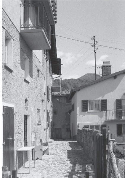
8 Parte alta del nucleo principale