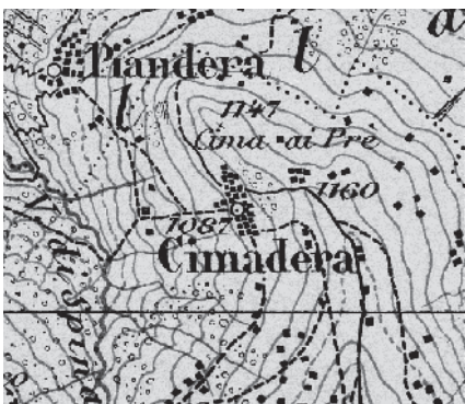
Carta Siegfried 1891

Piccolo insediamento sul versante sinistro della Val Colla, a oltre 1100 metri s.l.m., in situazione discosta dalle vie principali, occupa un contesto paesaggistico prezioso, con un'edificazione rurale modesta, ma ampiamente rappresentativa dei tipi regionali rurali.