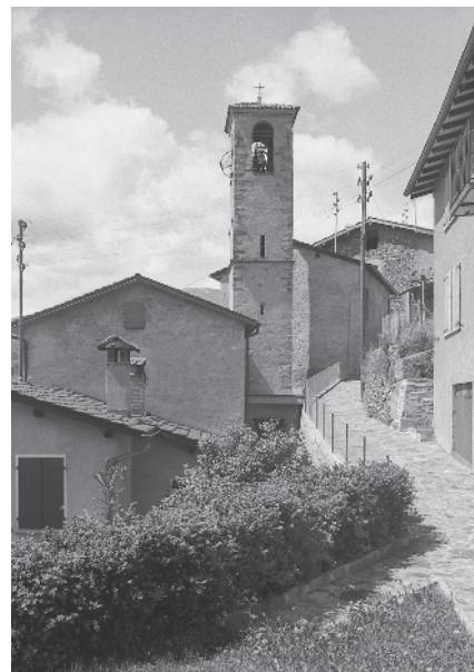
3 Parrocchiale di S. Antonio da Padova