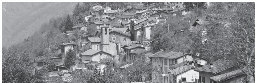
11 Vista sull'insediamento da sud