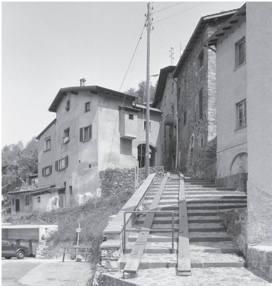
1 Percorso gradinato, principale percorso interno