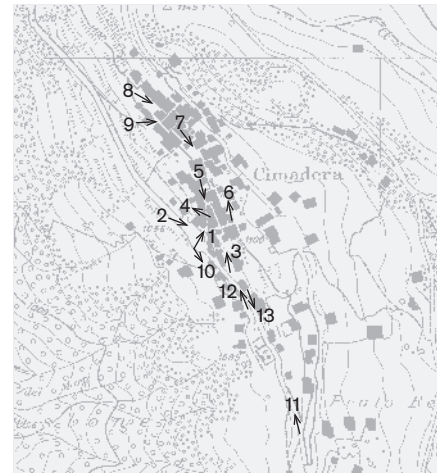
Direzione delle riprese, scala 1:8000 Fotografie 1982: 3-8, 13 Fotografie 1998: 1, 2, 9-12