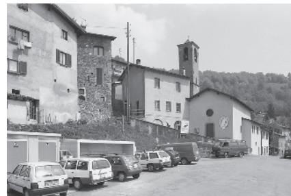
2 Piazza di giro