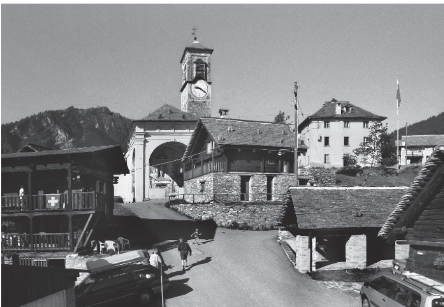
11 Chiesa parrocchiale di S. Maria Assunta con portico affrescato; sec. XVII-XVIII