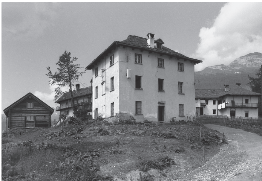
4 Dimora ottocentesca