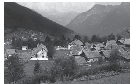
13 Vista da ovest sul nucleo secondario