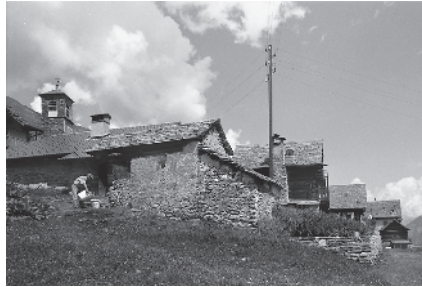
7 Margine rurale meridionale del nucleo