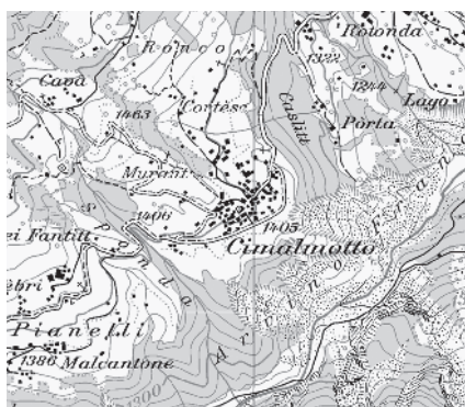
Carta nazionale 1999