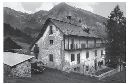
12 Dimora tra i due insiemi, sec. XVIII