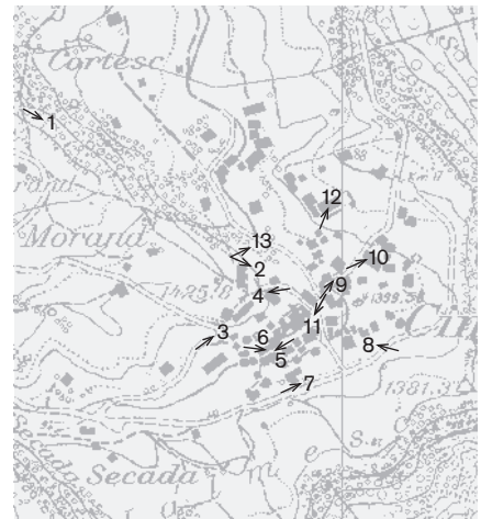
Direzione delle riprese, scala 1:8000 Fotografie 2000: 1-13