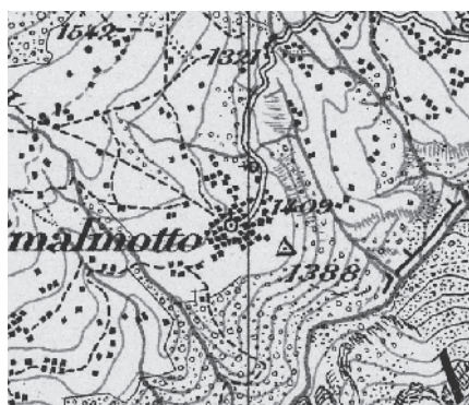
Carta Siegfried 1897

Segnato dall'abbandono che interessa tutta la valle di Campo, il villaggio ha il motivo architettonico e spaziale centrale nella parrocchiale al culmine di un percorso in forte pendenza, con uno scenografico portico affrescato, e intorno alla quale si raccoglie l'edificazione rurale più antica.