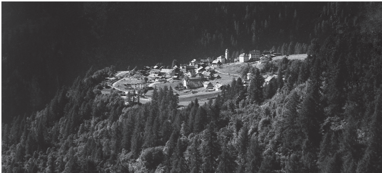
1 Panoramica sul terrazzo in cui si impianta Cimalmotto

Comune di Campo Vallemaggia, distretto di Vallemaggia, Cantone Ticino