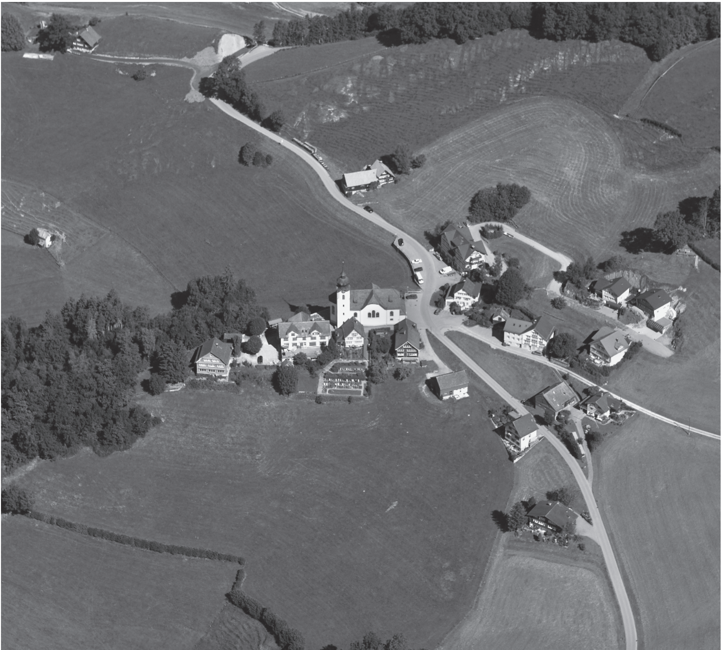
Flugbild Bruno Pellandini 2007, © Büro für das ISOS

Kleinstweiler in spektakulärer Lage auf einer Terrasse über dem Tal der Sitter mit eindrücklicher Aussicht auf das Alpsteinmassiv und auf die weitläufige Hügellandschaft mit Streusiedlung. Paradebeispiel einer dörflichen Kernsiedlung mit dichter Anordnung von Kirche, Pfarrhaus und Schule.