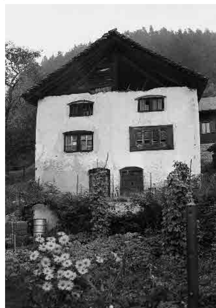
3 Dimora con frontone aperto, sec. XVIII