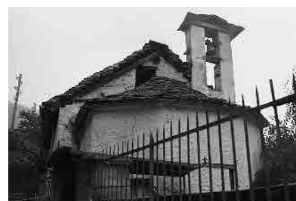
10 Cappella di S. Rocco, datata 1811