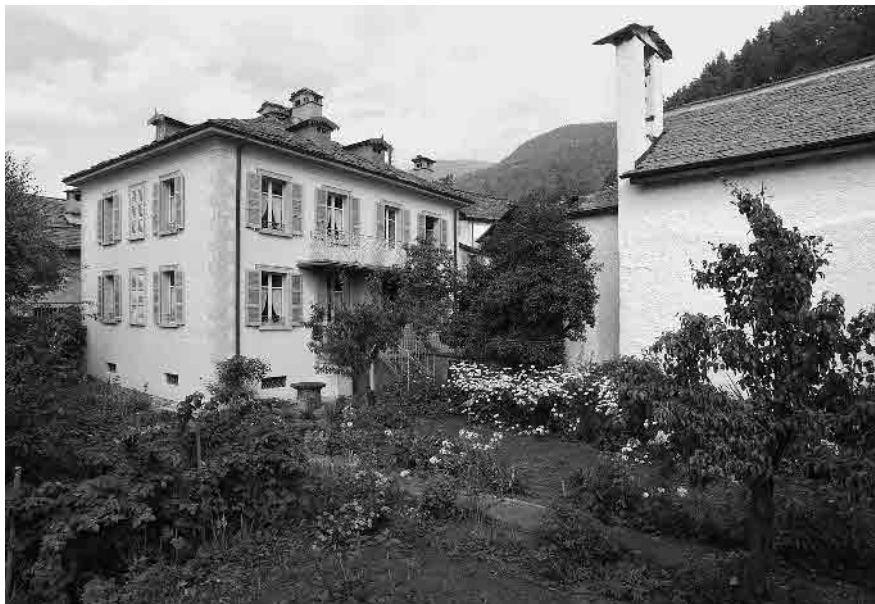
1 Dimora borghese entro giardino cintato, 1894

Comune di Rossura, distretto di Leventina, Cantone Ticino