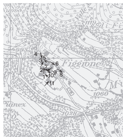
Direzione delle riprese, scala 1:8000 Fotografie 1988: 2, 3, 5, 6, 9, 10 Fotografie 1998: 1, 4, 7, 8, 11