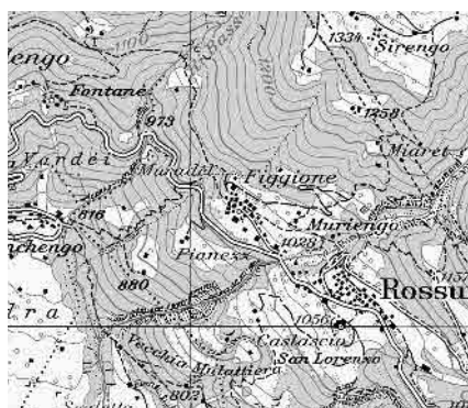
Carta nazionale 2001