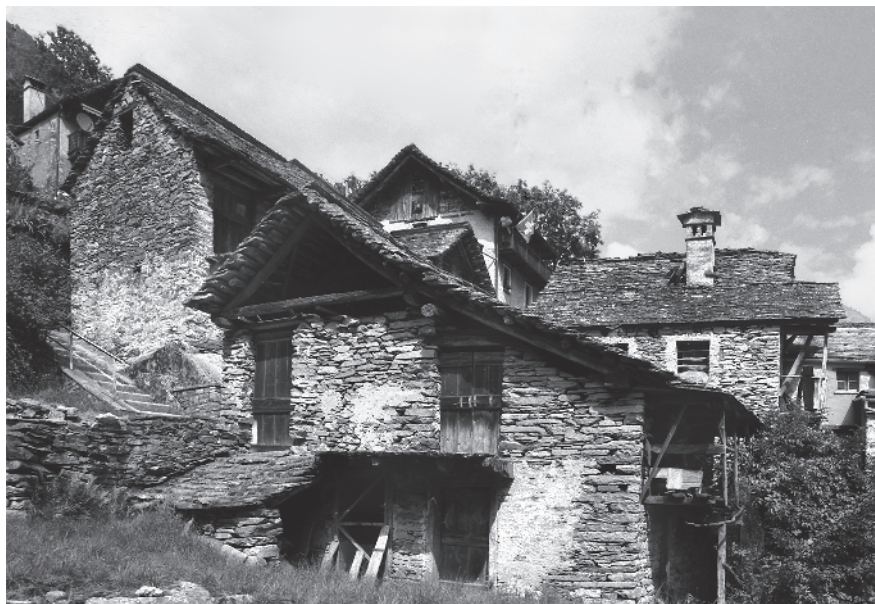
14 Parte più rustica entro il nucleo principale