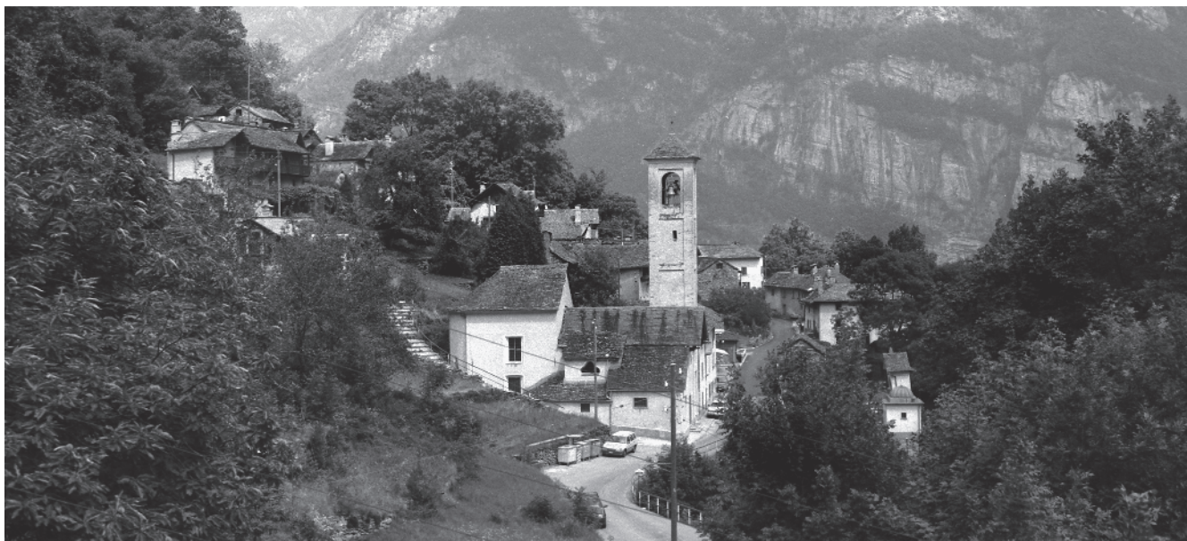
17 Chiesa parrocchiale di lato alla cantonale, origine del sec. XVII