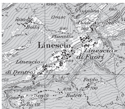
Carta nazionale 1999