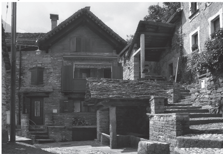
19 Lavatoio coperto entro la parte più rustica di Linescio di dentro