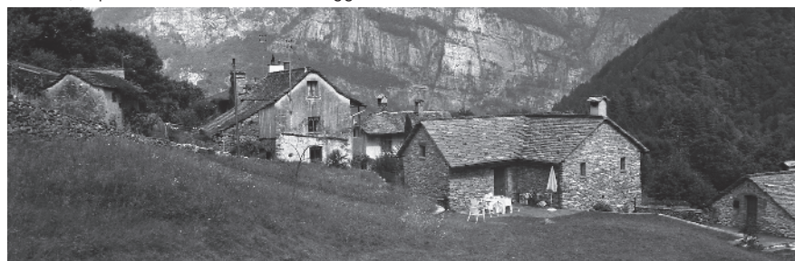
4 A valle della cantonale