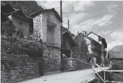
6 Linescio di fuori