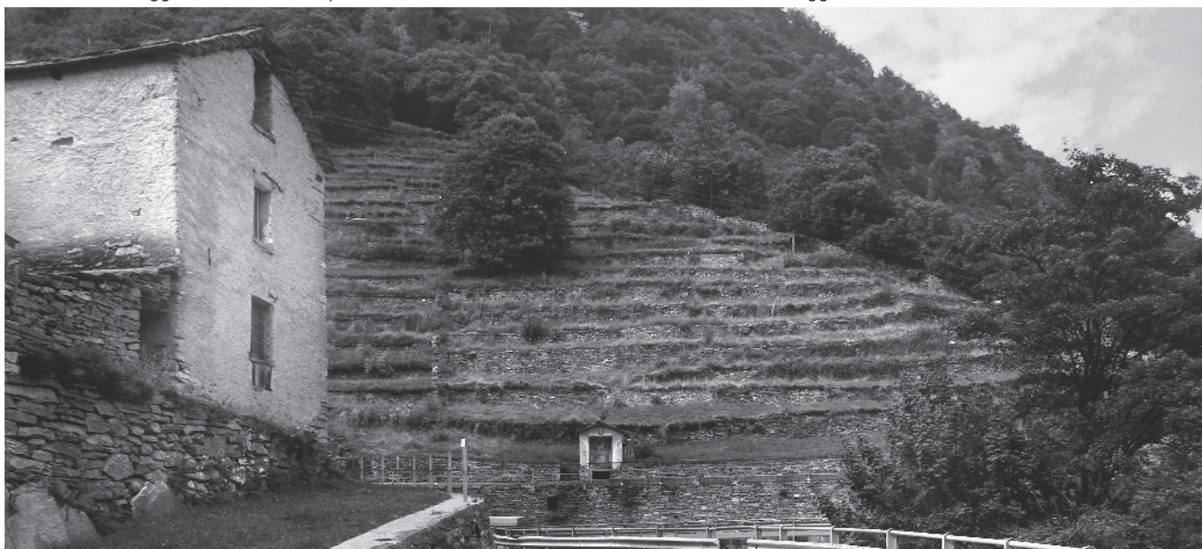
2 Gli imponenti terrazzamenti tra nucleo e nucleo, impronta caratterizzante il villaggio