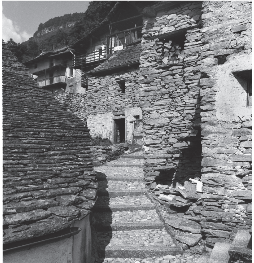
8 Percorso interno a Linescio di fuori, a monte della cantonale