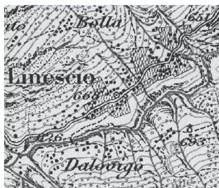
Carta Siegfried 1897

Quasi all'imbocco della Valle Maggia, Linescio esalta con i suoi terrazzamenti antropici l'opera dell'uomo nel disciplinare la natura per ricavarne spazio coltivabile; grandioso monumento non solo ideale ma preziosa modellazione del suolo in armonica continuità con i nuclei edificati.