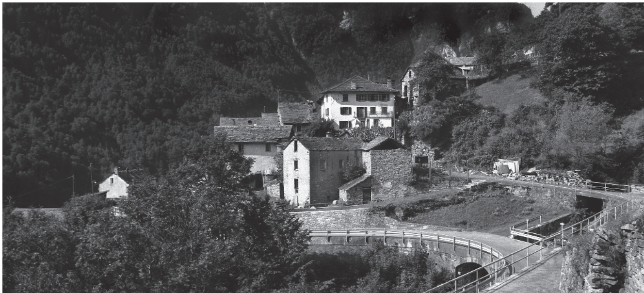
1 La carreggiabile cantonale e, più a monte, il vecchio sentiero, all'estremità est del villaggio

Comune di Linescio, distretto di Vallemaggia, Cantone Ticino