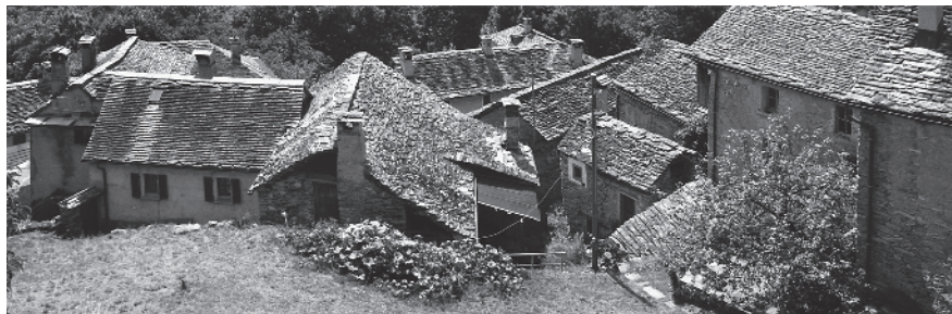
12 Dominanza di coperture in piode