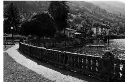
5 La riva costruita