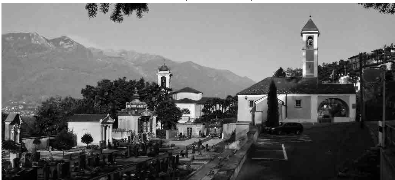
18 Cappella della Madonna della Neve del 1729, in forte relazione a vista con la parrocchiale