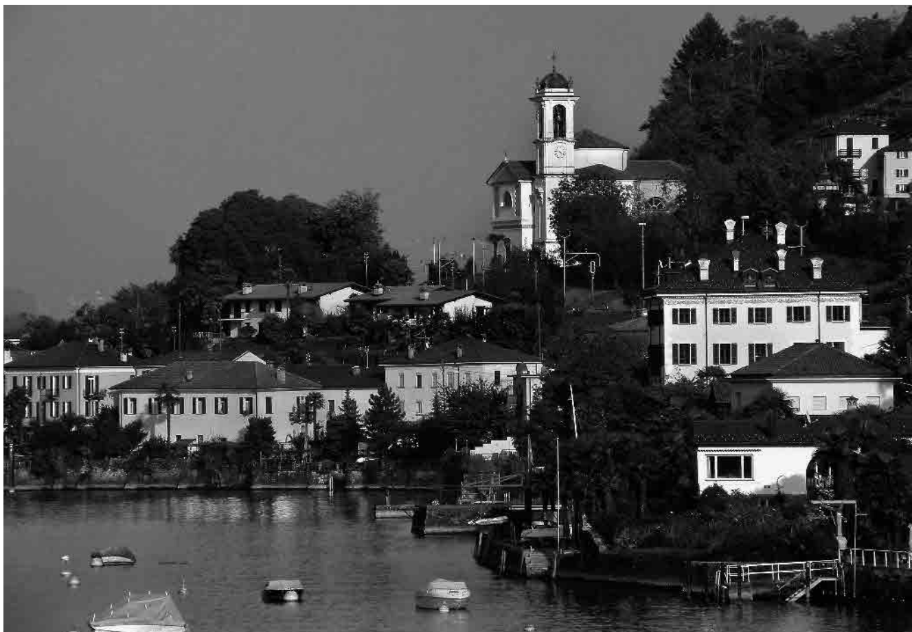
1 La silhouette da ovest dominata dalla chiesa ottocentesca al culmine dell'insediamento

Comune di Magadino, distretto di Locarno, Cantone Ticino