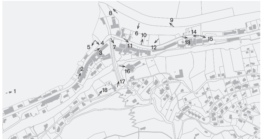
Direzione delle riprese, scala 1:8 000 Fotografie 2008: 1-18