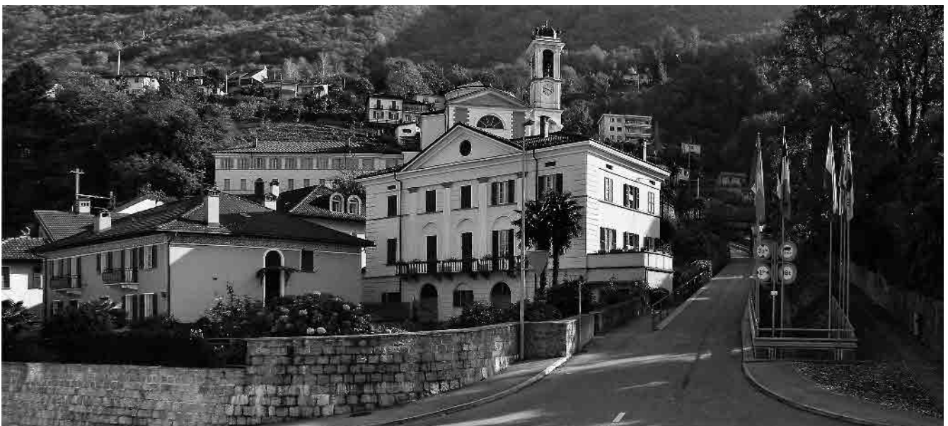
7 Villa Ghisler del 1843, in primo piano, e il complesso ecclesiastico sullo sfondo