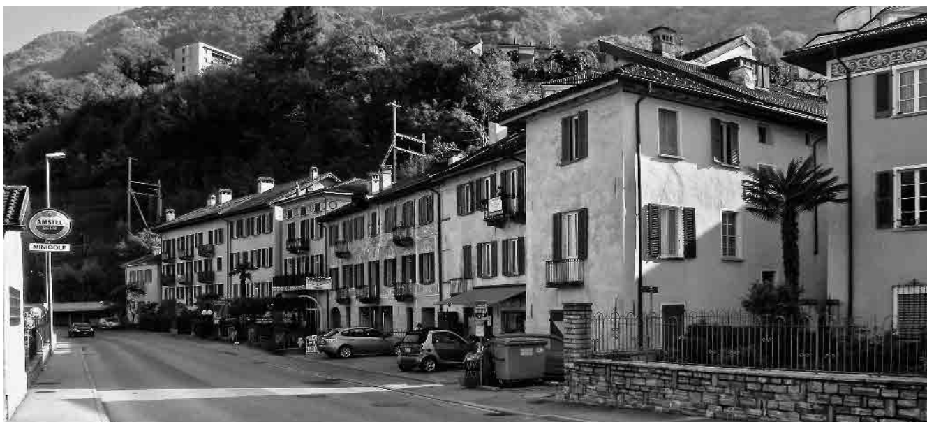
11 L'ala orientale del nucleo principale