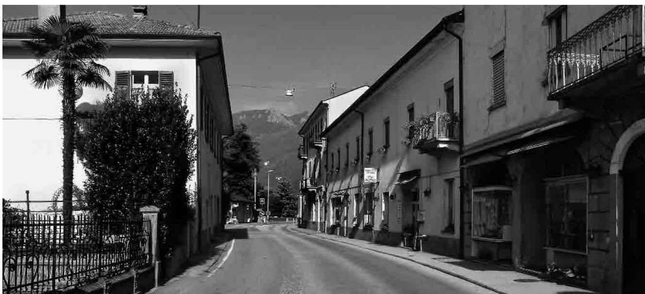
2 La strada di attraversamento nel tratto occidentale del nucleo