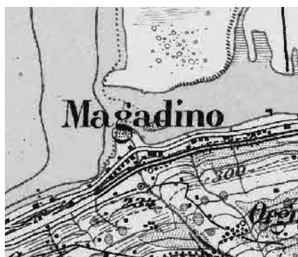
Carta Siegfried 1910

Posto a lago in corrispondenza di un ampio e spettacolare delta, l'allineamento verso riva ricorda nei locali oggi seminterrati il vecchio villaggio di pescatori evolutosi a luogo di traffici e, quindi, a località turistica. Perdurano i segni del passato benessere in dimore, alberghi e nella chiesa monumentale.