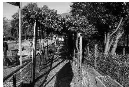
10 Vialetto nel delta