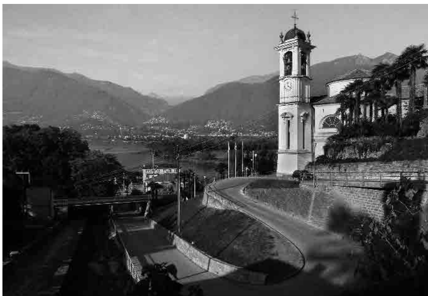
17 Chiesa parrocchiale di S. Carlo, 1846