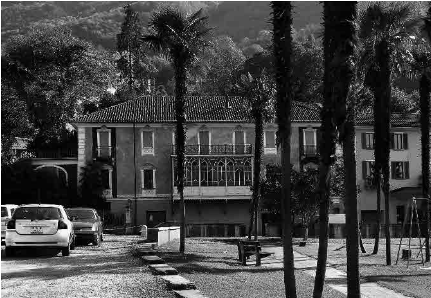
4 Ex Hotel Bellevue, visto dal delta