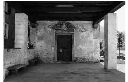
6 Atrio della parrocchiale