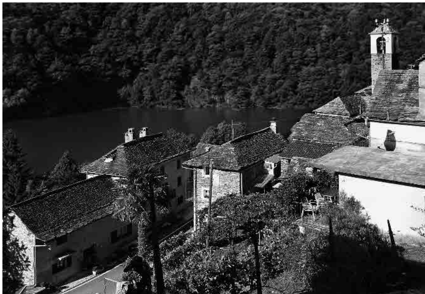
1 Dall'alto vista sul piano della cantonale

Comune di Vogorno, distretto di Locarno, Cantone Ticino