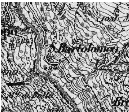
Carta Siegfried 1910

Subito a monte del lago artificiale di Vogorno, gode di un'ottima esposizione e di una relazione a vista privilegiata con Corippo. Il piccolo insediamento vanta una chiesa di notevole importanza architettonica e storica in quanto primo centro religioso e chiesa madre della valle.