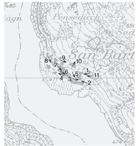
Direzione delle riprese, scala 1: 8 000 Fotografie 2008: 1-11