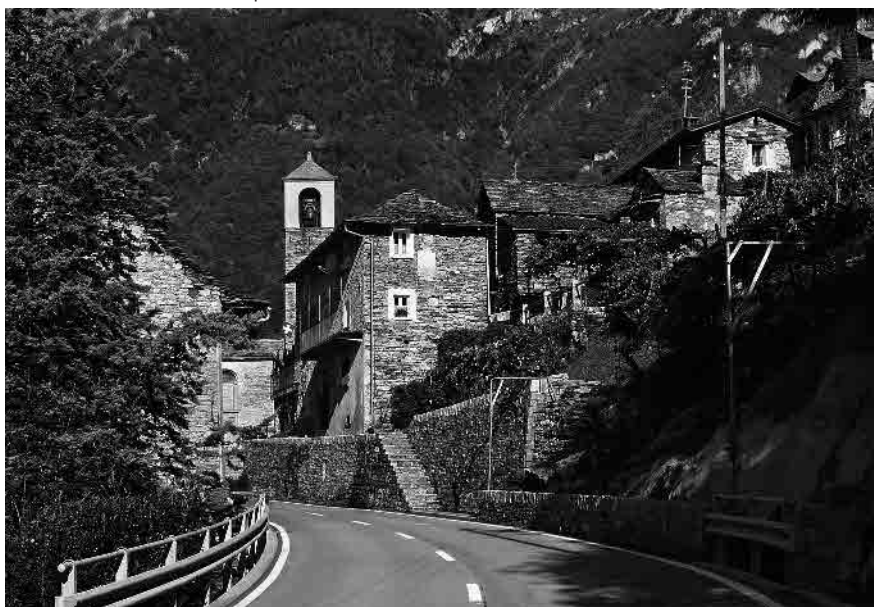
2 Sullo sfondo il campanile della chiesa madre della valle