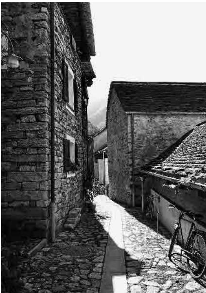
7 Vicolo principale