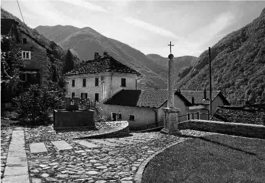
5 Il sagrato. Sulla strada una dimora di metà sec. XIX