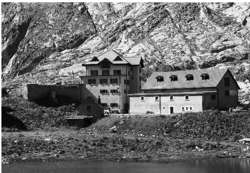
6 Lago dell'Ospizio