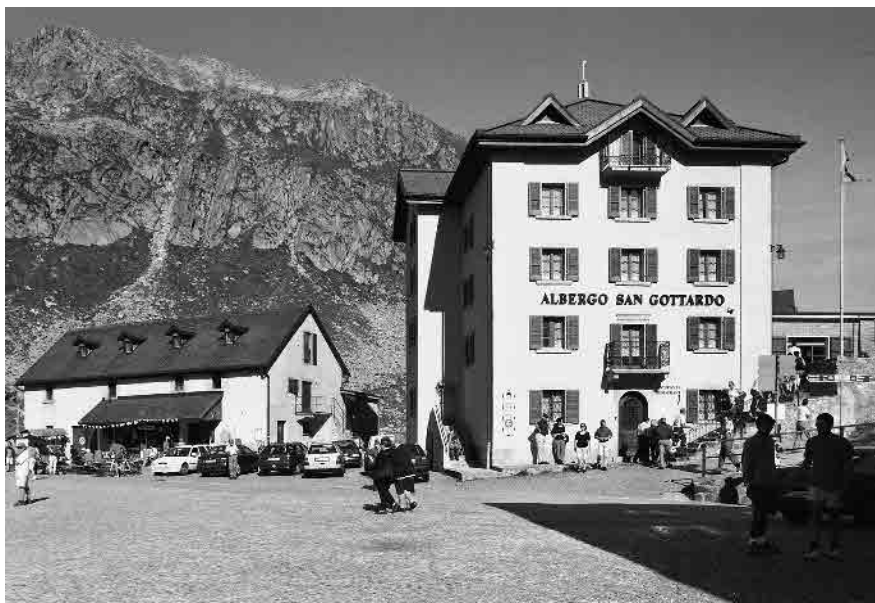
4 Ex «Hôtel Monte Prosa», circa 1865