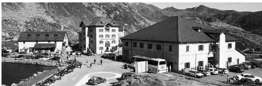
3 Museo e Ristorante «Vecchia Sosta», 1837