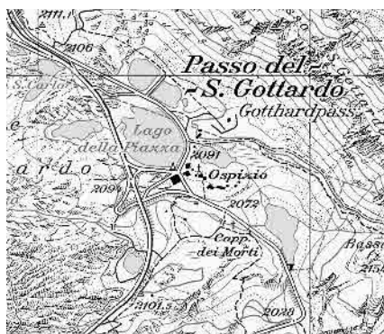
Carta nazionale 1999