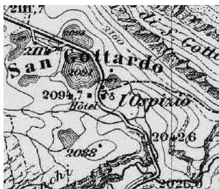
Carta Siegfried 1872

Passo lungo la «Via delle Genti», frequentato da millenni, raggiunto dalla carreggiabile della Tremola nel 1830 e oggi dal prolungamento dell'autostrada. All'hospitale medievale si sono sostituiti, tra XIX e XX secolo, due grandi alberghi, accanto a laghetti alpini, in un contesto da anecumene.