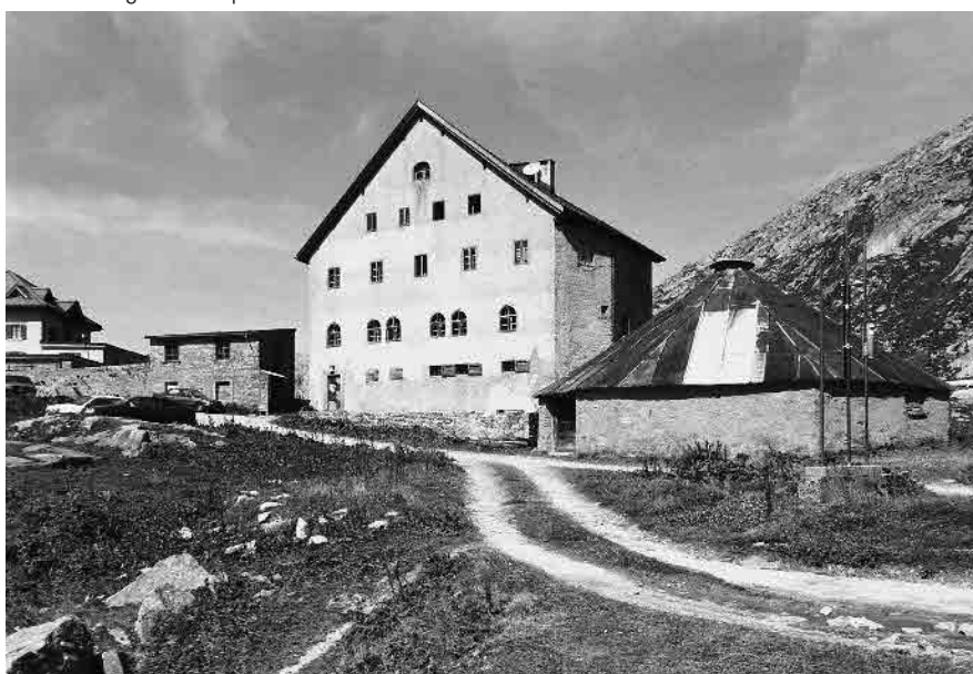
9 Ospizio dei Cappuccini da sud est