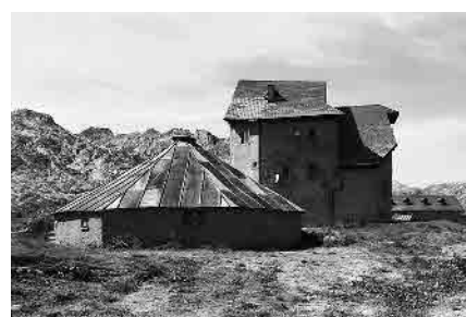
8 Originaria scuderia ottagonale, 1777