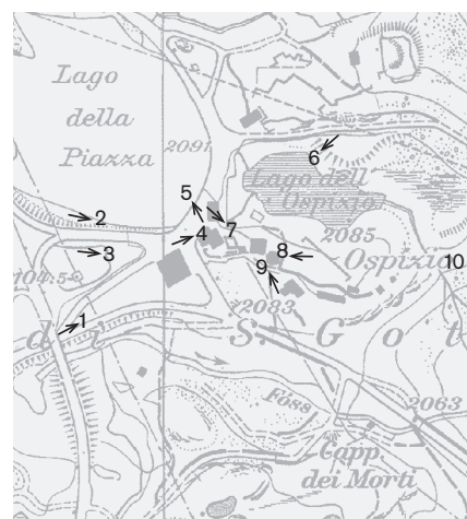
Direzioni delle riprese, scala 1:8000 Fotografie 1991: 2, 5 Fotografie 1998: 1, 3, 4, 6 - 10