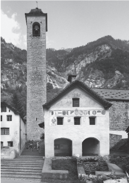
6 Ex sede balivale