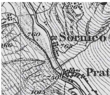
Carta Siegfried 1873

Nel piccolo nucleo si concentrano motivi di interesse storico architettonico e spaziali di grande momento: il campanile onnipresente alla vista, la mole della chiesa medievale al centro del nucleo, la sede del balivo, antiche dimore dei secoli XVI e XVII e numerosi antichi tipi dell'edilizia rurale.