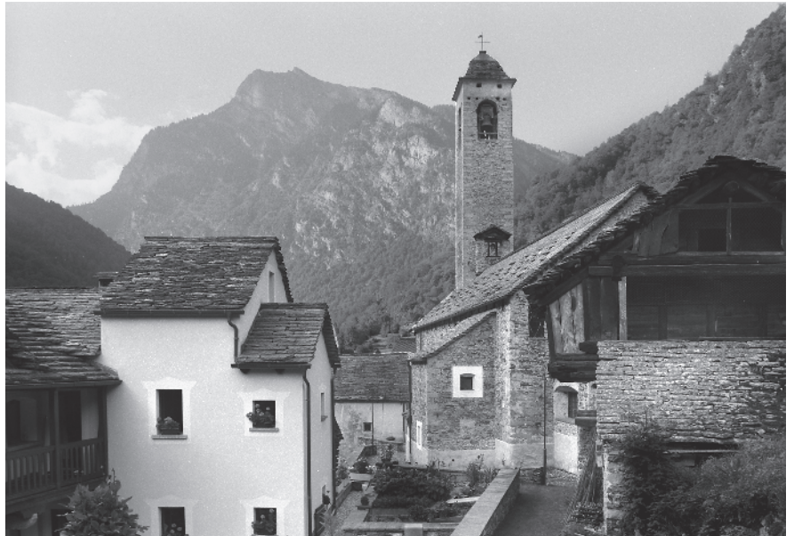
8 L'altissimo campanile di S. Martino si impone in tutto l'insediamento