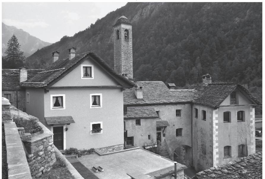
11 Vista sul nucleo da nord