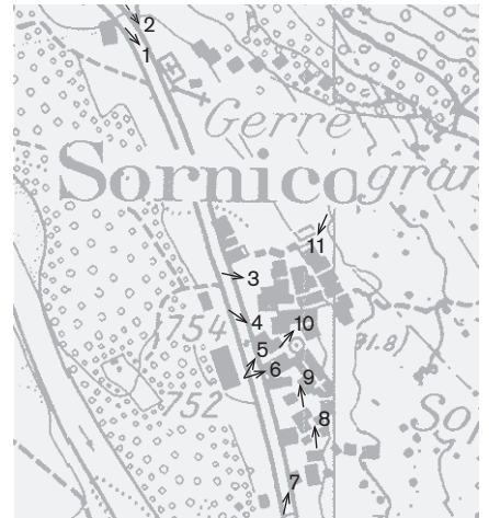
Direzione delle riprese, scala 1:8000 Fotografie 1980: 1 Fotografie 1999: 2-11