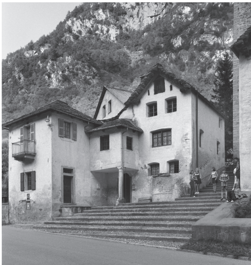
5 Facciate di diversi secoli verso la strada cantonale