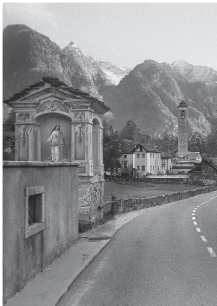
1 Vista da nord

Comune di Lavizzara, distretto di Vallemaggia, Cantone Ticino