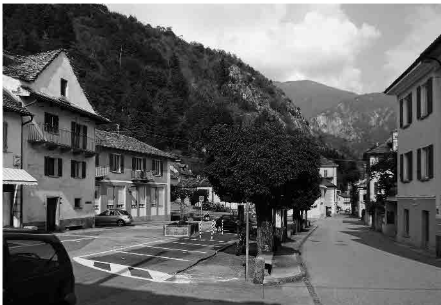
8 La piazza di Verscio che affianca la strada cantonale

Comune di Verscio, distretto di Locarno, Cantone Ticino