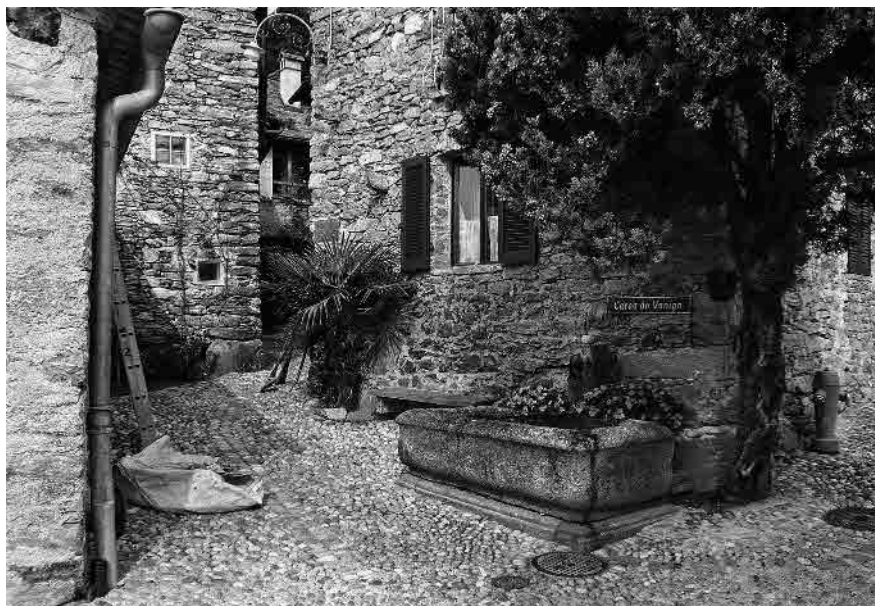
15 Antica vasca monolitica nei pressi della Ca' du Vanin