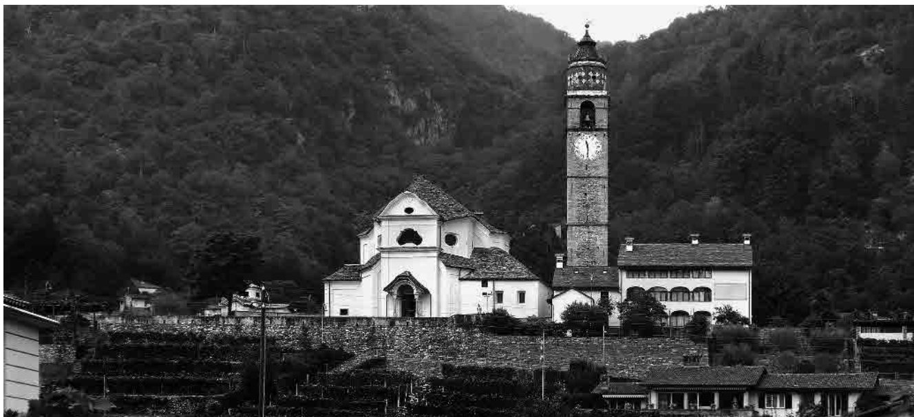
1 Il complesso ecclesiastico con la canonica settecentesca riattata