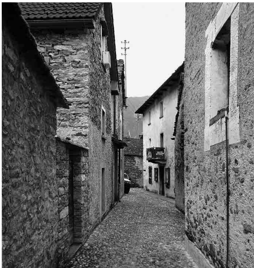
4 Nel nucleo a valle della cantonale; in fondo il Teatro Dimitri