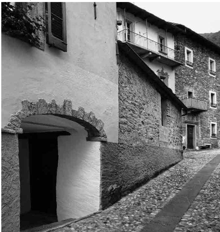
11 Percorso interno principale; in fondo la Casa Leoni