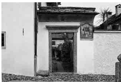
23 Palazzo Cavalli, sec. XVIII