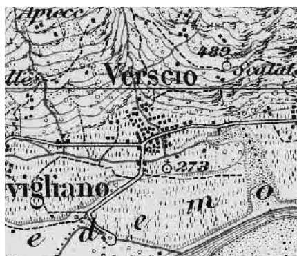
Carta Siegfried 1895

Internazionalmente noto per la presenza di una prestigiosa scuola di teatro, Verscio ha il suo centro nella grande piazza solcata dall'ampio letto di un riale. Il patrimonio rurale e le dimore signorili dei secc. XVII–XIX e dell'inizio XX, documentano l'evoluzione del villaggio nel corso dei secoli.