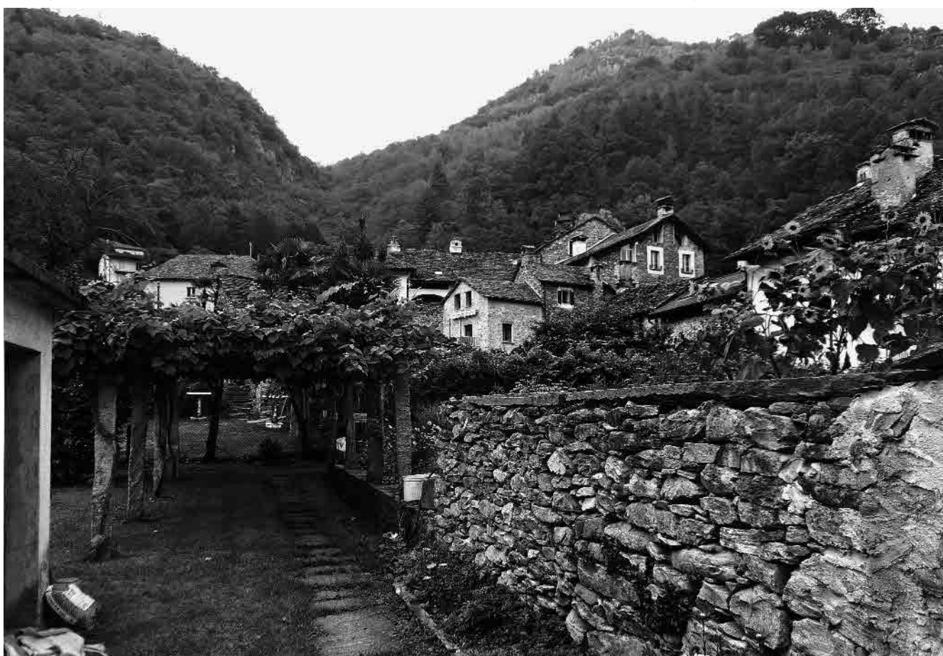
7 Il margine occidentale del nucleo principale