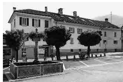
9 La Casa comunale