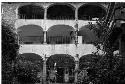
17 Ca' du Vanin, sec. XVII