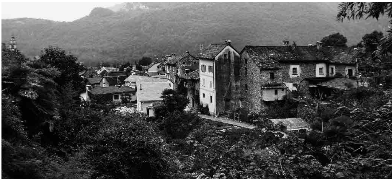
19 La parte alta del nucleo principale, il margine verso il Ri da Riei

Comune di Verscio, distretto di Locarno, Cantone Ticino