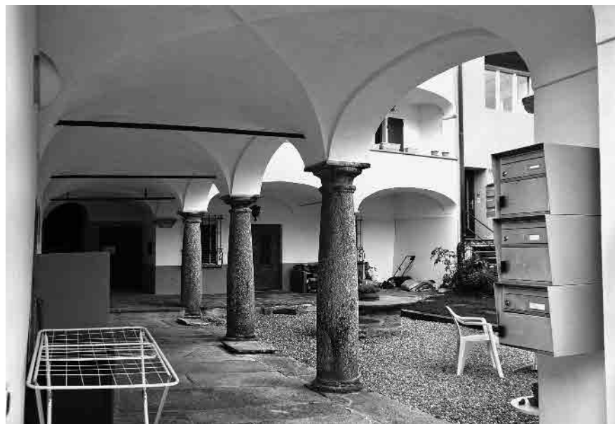
24 Cortile interno del Palazzo Cavalli