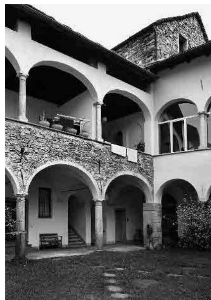
12 Cortile della Casa Leoni, sec. XVIII