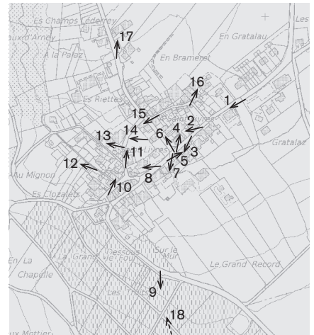
Base du plan: PB-MO 1:5000, Etabli sur la base des données cadastrales, Autorisation de l'Office de l'information sur le territoire - Vaud N° 05/2014 Emplacement des prises de vue 1: 10 000 Photographies 2013 : 1-18