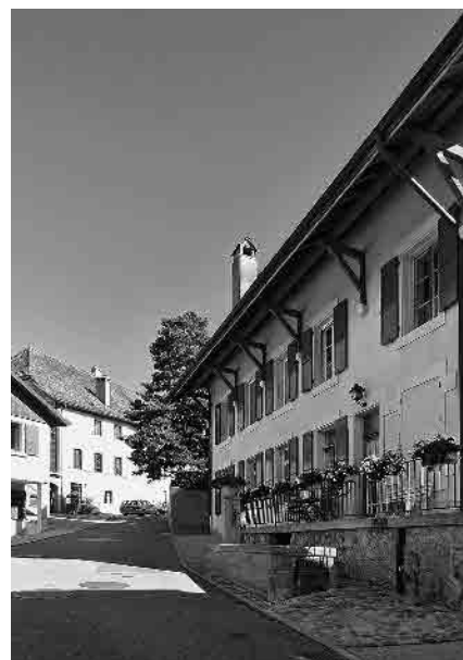
11 Anc. laiterie-fromagerie, 1910