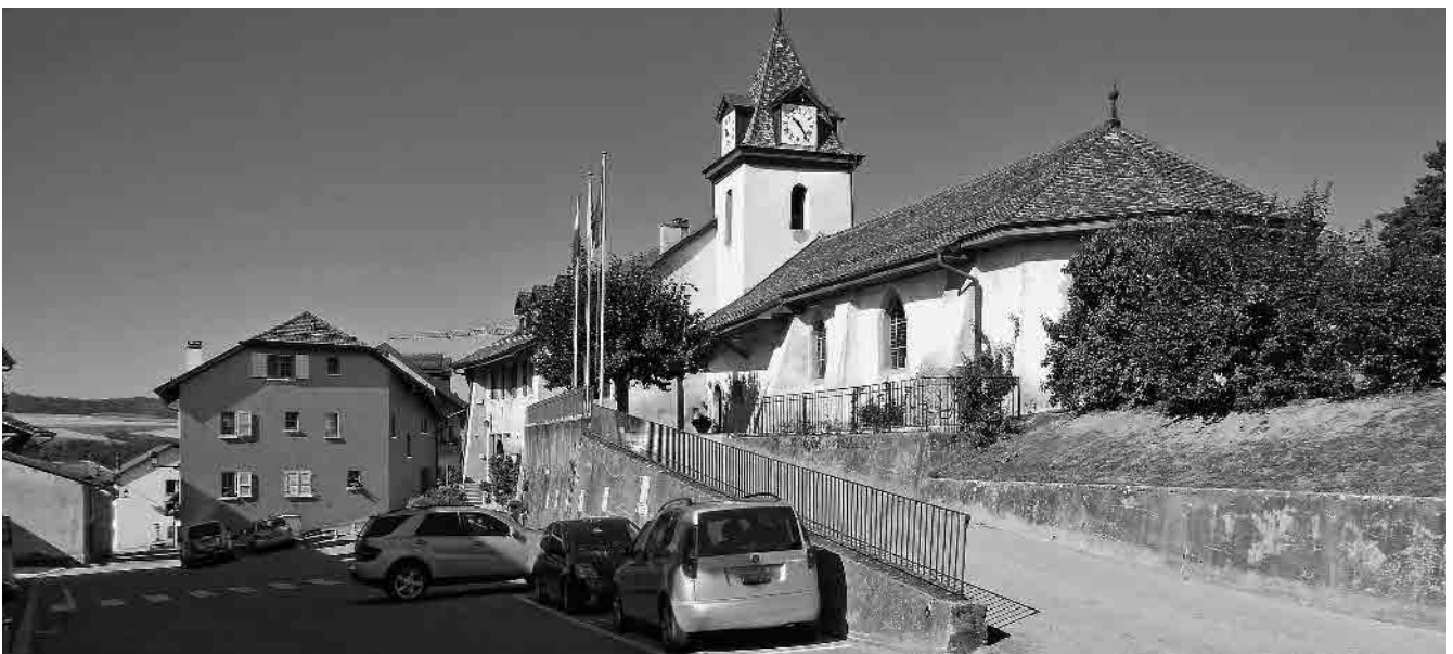
8 Eglise réf., 15 e /20 e s.