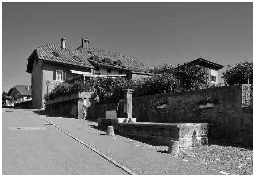
17 Cellule supérieure