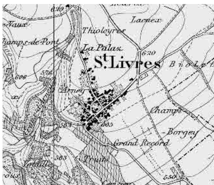
Carte Siegfried 1895

Village d'origine agricole situé au sommet d'un coteau. Structure originale créée suite à son déplacement au 15 e siècle. Concentration annulaire des édifices communautaires et représentatifs dans l'une des moitiés de la composante principale.