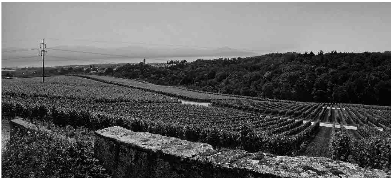
9 Vue vers le paysage lémanique

Commune de Saint-Livres, district de Morges, canton de Vaud