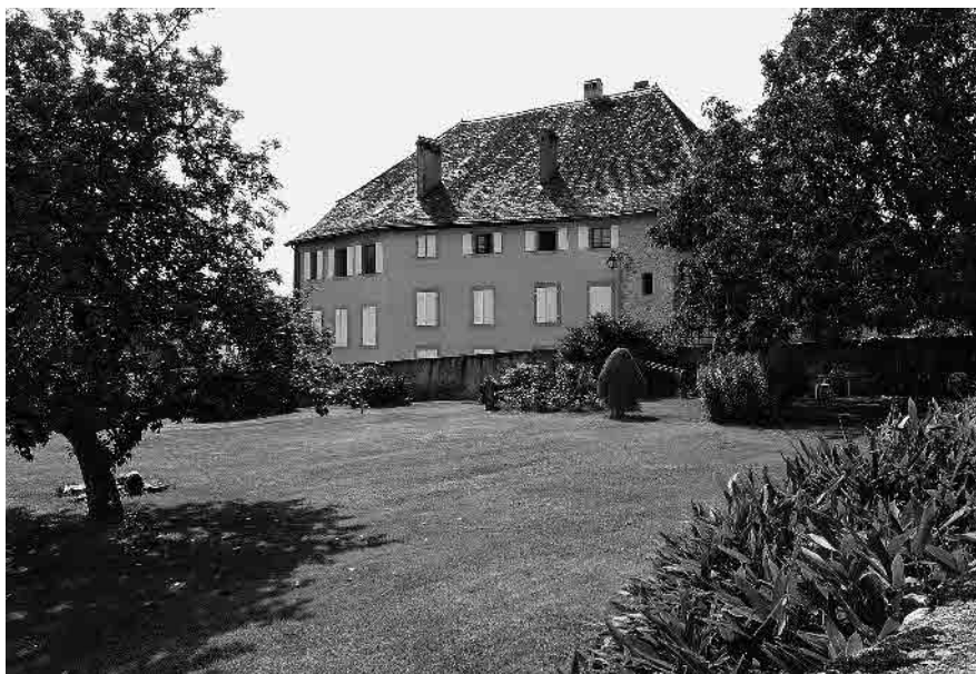
14 Jardin central privé et maison de maître, reconstr. 1802