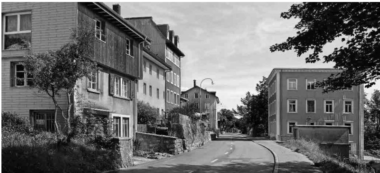
11 Pâté de maisons entre l'ancien et l'actuel tracé de la Grande-Rue