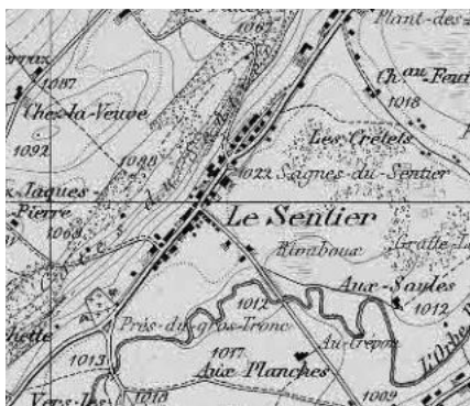
Carte Siegfried 1894

Village-rue d'une longueur exceptionnelle, haut-lieu de l'horlogerie de prestige. Noyau étiré avec église néogothique relié à plusieurs cellules agricoles par des rangées de villas et de grandes usines.