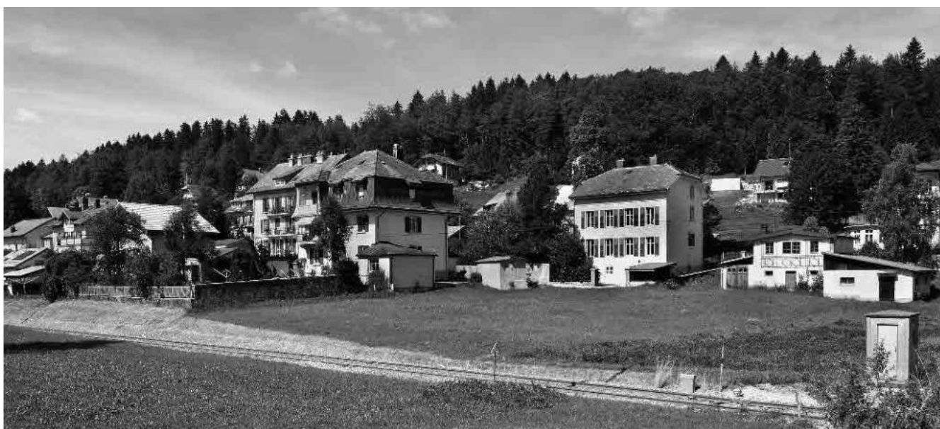
14 Résidences et villas le long de la Grande-Rue vers le nord