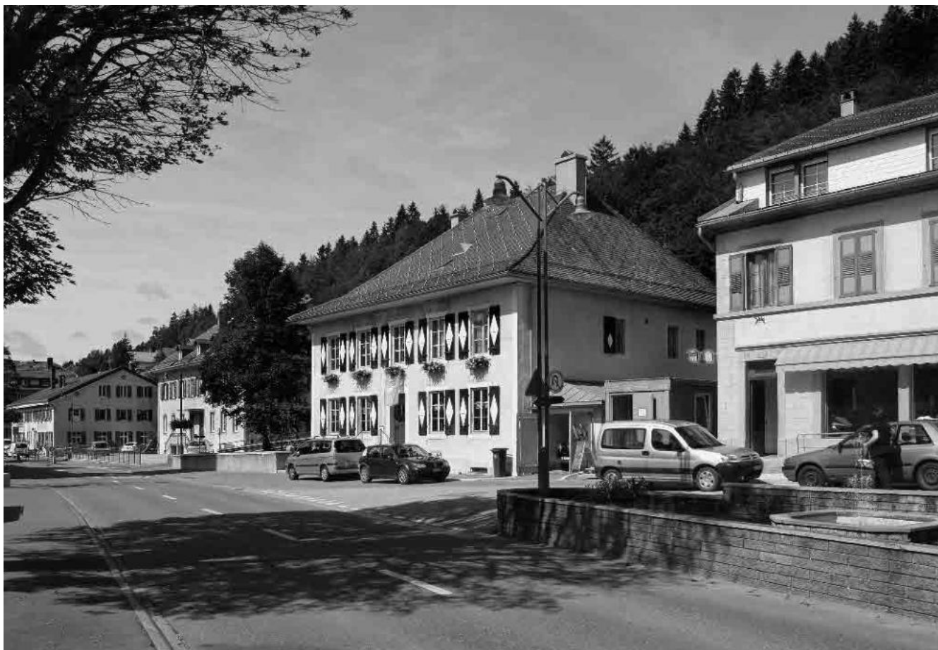
1 La cure, 1777

Commune du Chenit, district du Jura-Nord vaudois, canton de Vaud