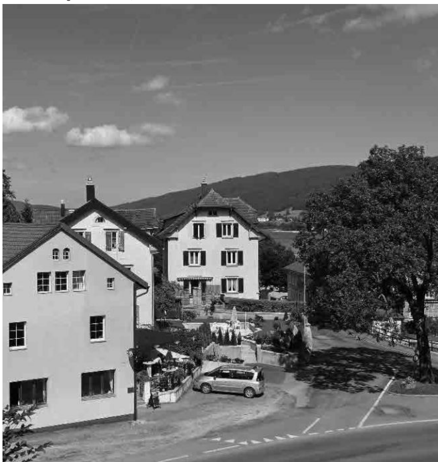
17 La Golisse