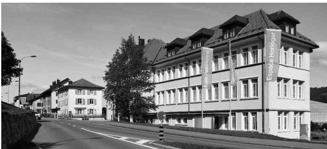
21 Ancienne fabrique d'horlogerie, centre culturel, 1919