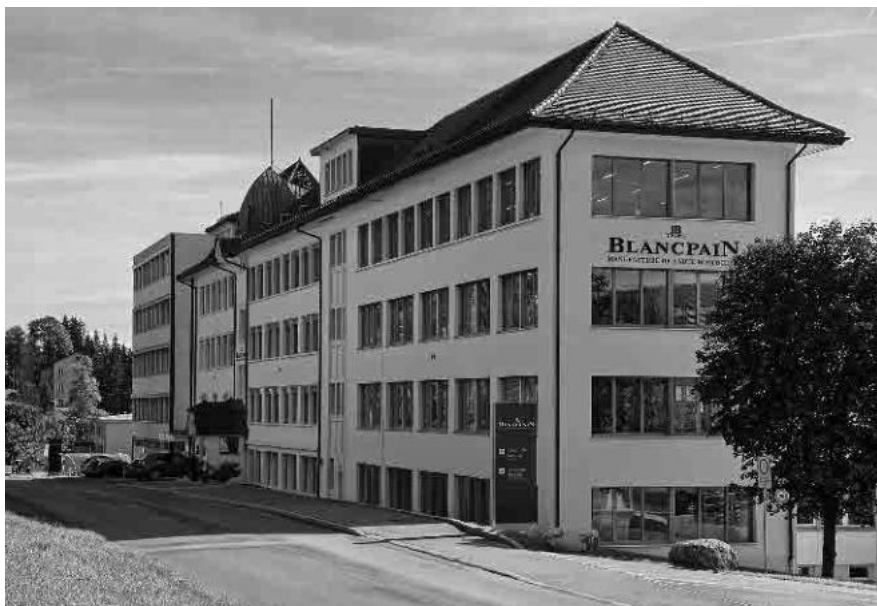
24 Usine horlogère, dès 1924

Commune du Chenit, district du Jura-Nord vaudois, canton de Vaud