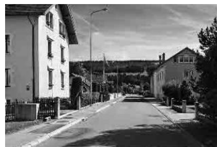
19 Les Crêtets