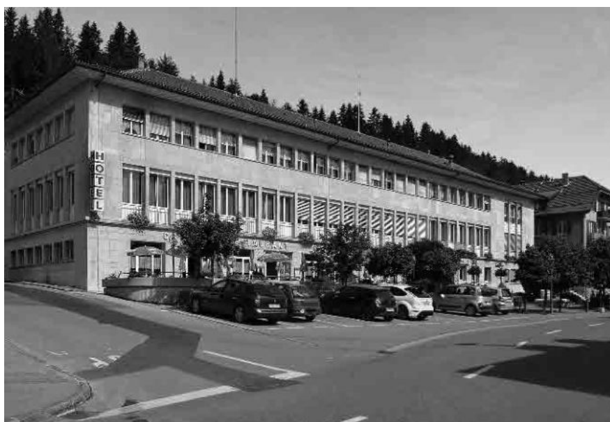
5 L'Hôtel de Ville, 1958