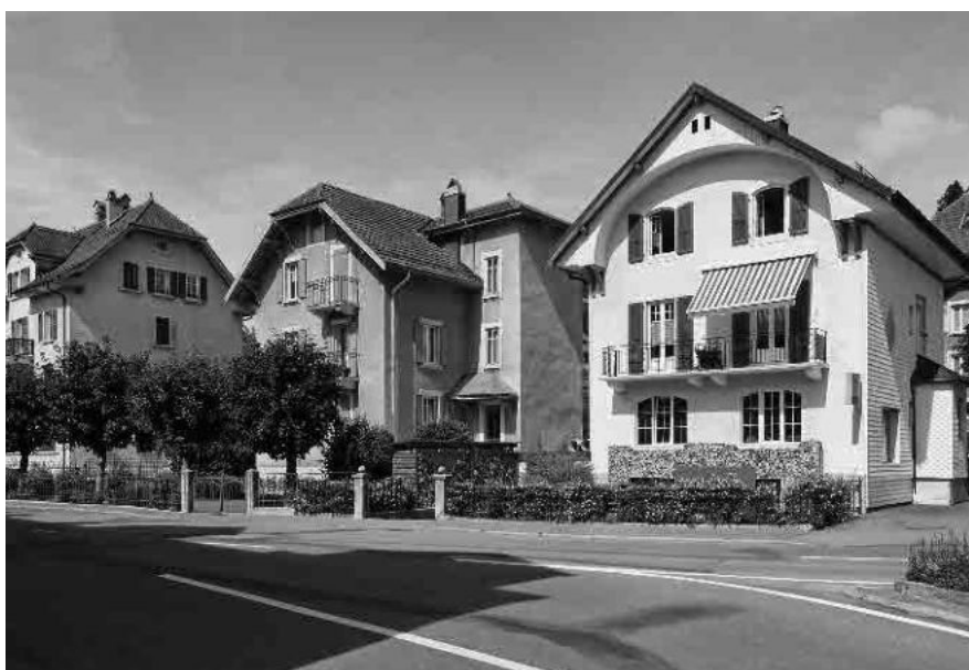
9 Rue de la Gare