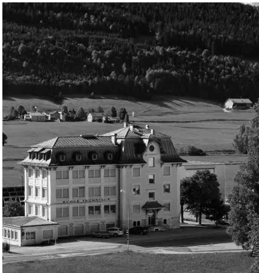
29 Ecole technique, 1908