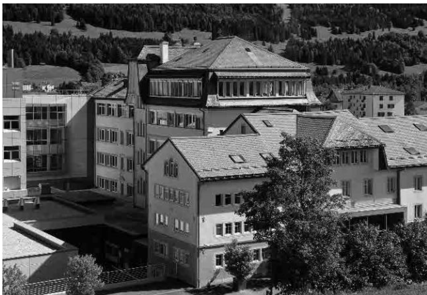
15 Jaeger-LeCoultre, dès 1866

Commune du Chenit, district du Jura-Nord vaudois, canton de Vaud