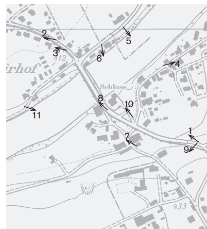
Fotostandorte 1:10 000 Aufnahmen Jahr 2007: 1–11