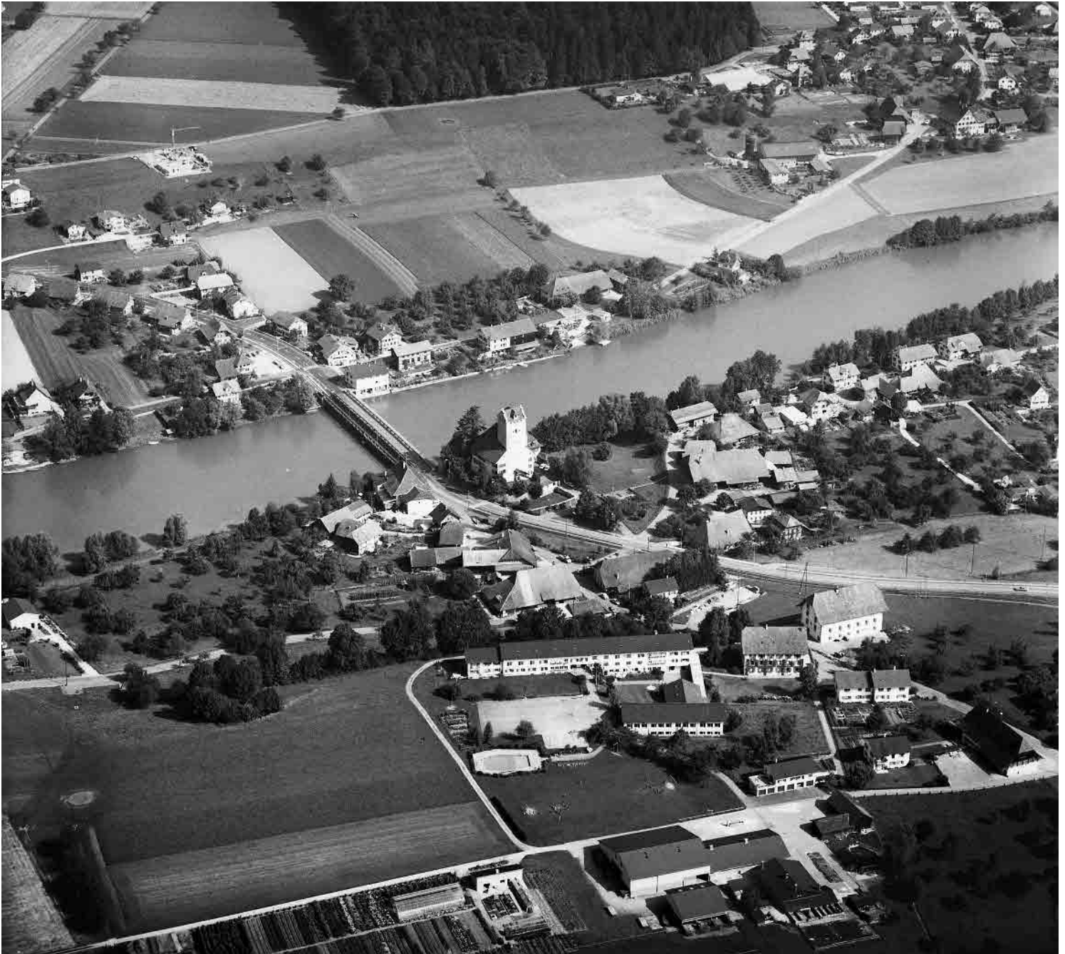
Flugbild 1972

Prägnante Brückenkopfsiedlung beidseits der Aare mit von weither sichtbarem Bergfried des Schlosses Aarwangen. Die bäuerlich-gewerbliche Bebauung legt sich als Halbkreis um das Schloss; am anderen Ufer, in Schürhof, staffeln sich Kleinbauernhäuser zum geschlossenen Strassenraum.