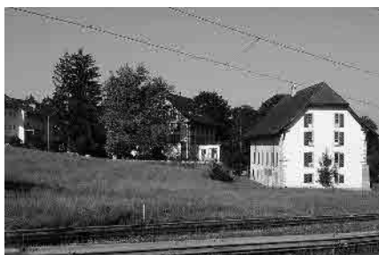
9 Ehem. Kornhäuser