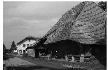
4 Südlicher Brückenkopf