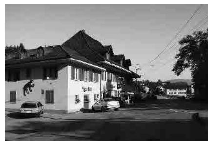
8 Gasthof «Bären»