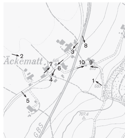
Fotostandorte 1: 10 000 Aufnahmen 1990: 1-8 Aufnahmen 1998: 9, 10