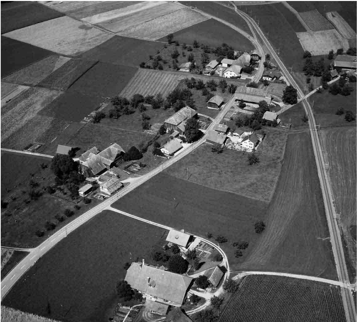
Flugbild 1978

Ackerbauernweiler an der Staatsstrasse Bern-Schwarzenburg. Streng orthogonaler Siedlungsaufbau, Dachfirste parallel oder senkrecht zur Strasse. Grosse Vielfalt an regionaltypischen Höfen, Stöckli, Speichern und Ofenhäusern des 18. und 19. Jahrhunderts.