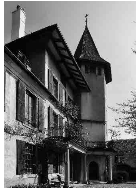
7 Château de Cottens, 15 e s.