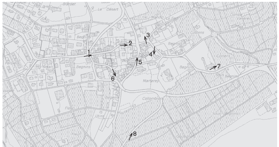
Base du plan: PB 1:5 000, Etabli sur la base des données cadastrales, Autorisation de l'Office de l'information sur le territoire - Vaud N° 04/2014 Emplacement des prises de vue 1: 10 000 Photographies 2012: 1-8