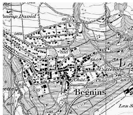
Carte nationale 2009