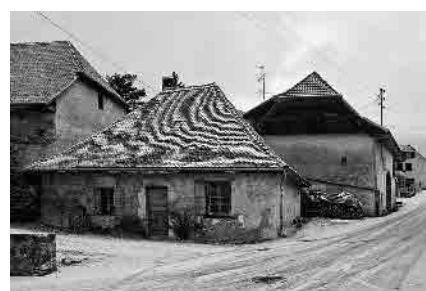
5 Ancienne fromagerie, 1822