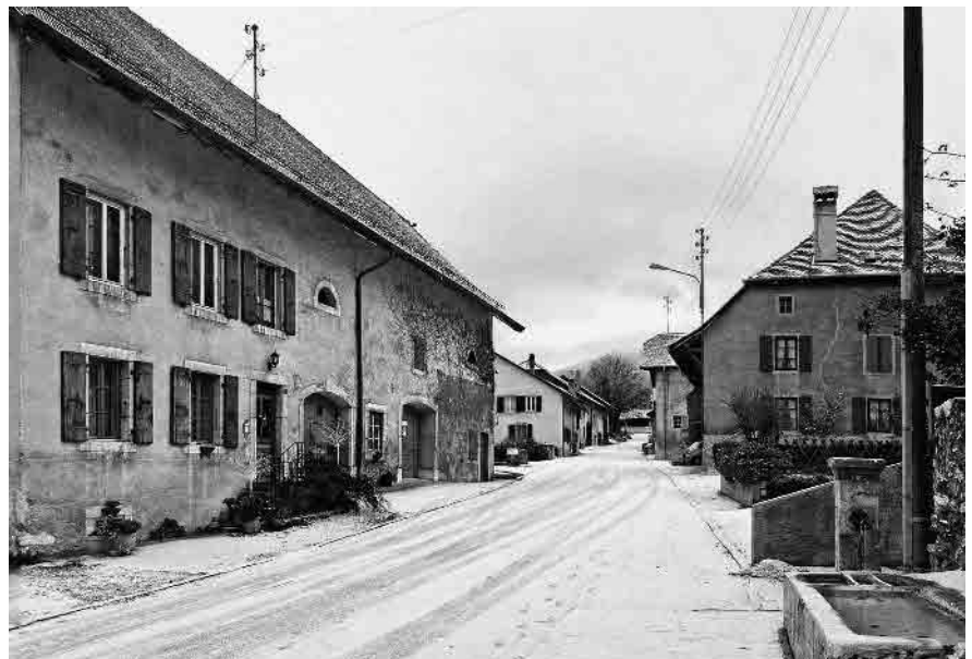
9 Rue montante, structurée en épi