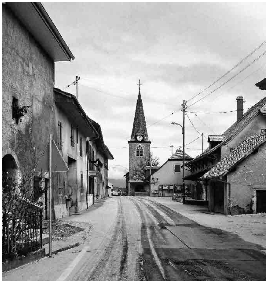
2 Eglise réformée, 14 e -15 e s.