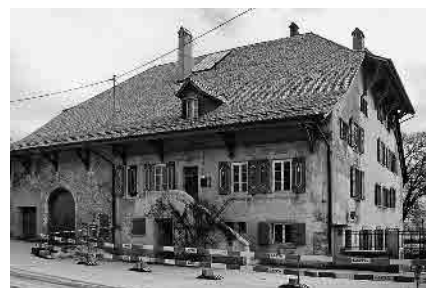
3 Cure, 1541