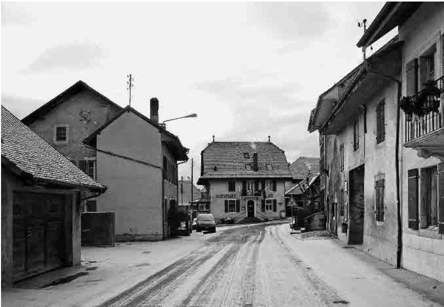
6 Café de l'Ecusson Vaudois

Base du plan: PB-MO 1:5'000, Etabli sur la base des données cadastrales, Autorisation de l'Office de l'information sur le territoire-Vaud N° 07/2012 Emplacement des prises de vue 1: 10 000 Photographies 2011: 1-11