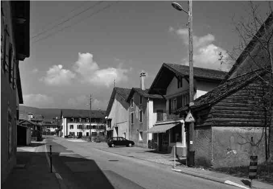
5 Anc. orphelinat en arrière-plan

Base du plan: PB 1:5 000, Etabli sur la base des données cadastrales, Autorisation de l'Office de l'information sur le territoire - Vaud N° 04/2014 Emplacement des prises de vue 1: 10 000 Photographies 2012: 1-9