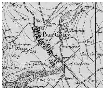
Carte Siegfried 1893

Remarquable village-rue situé entre la Côte et le Pied-du-Jura, organisé le long d'un axe montant générant une structure en épi et des espaces intermédiaires. Eglise réformée marquant l'avant-plan du site.