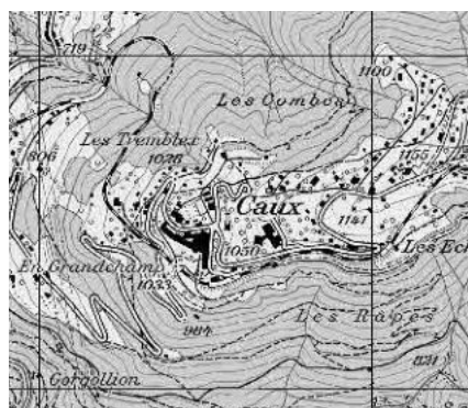
Carte nationale 2010