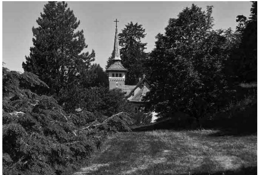
7 Chapelle cath. St-Joseph, 1907-08