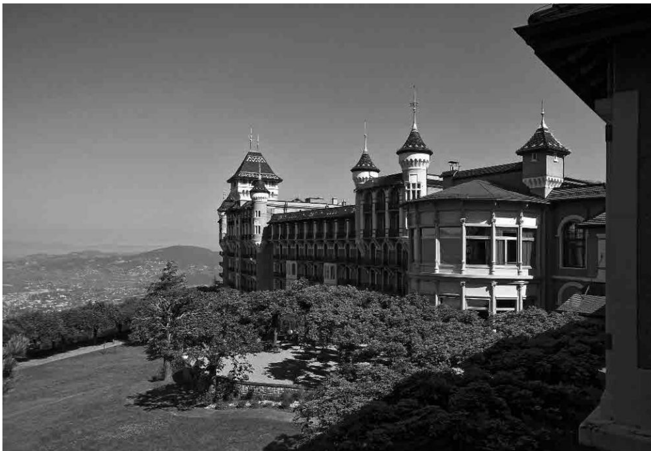
1 Anc. Caux-Palace, 1900–02

Commune de Montreux, district de la Riviera-Pays-d'Enhaut, canton de Vaud