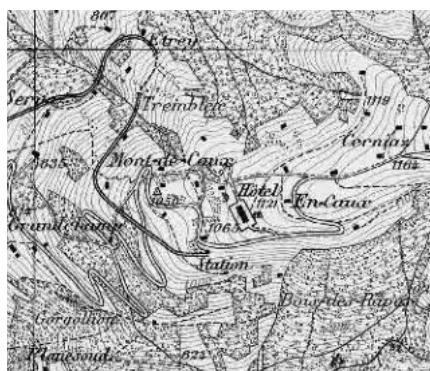
Carte Siegfried 1890

Site d'origine hôtelière développé à la Belle-Epoque, installé sur une croupe haut perchée dominant Montreux et le Léman, lui offrant un panorama splendide. Variété d'hôtels, dont l'ancien Caux-Palace, le plus grand et le plus luxueux de Suisse à son ouverture. Divers équipements, dont deux chapelles.