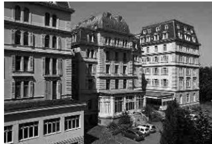
5 Anc. Grand-Hôtel, 1890-93