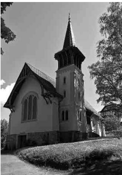
8 Chapelle St-Michel, 1905-06