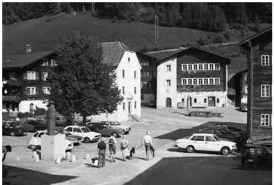
14 Dorfplatz 1978