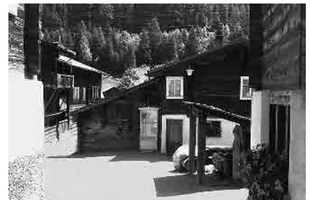
8 Uf em Biel