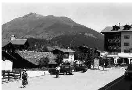
26 Geschäftszentrum von 1989