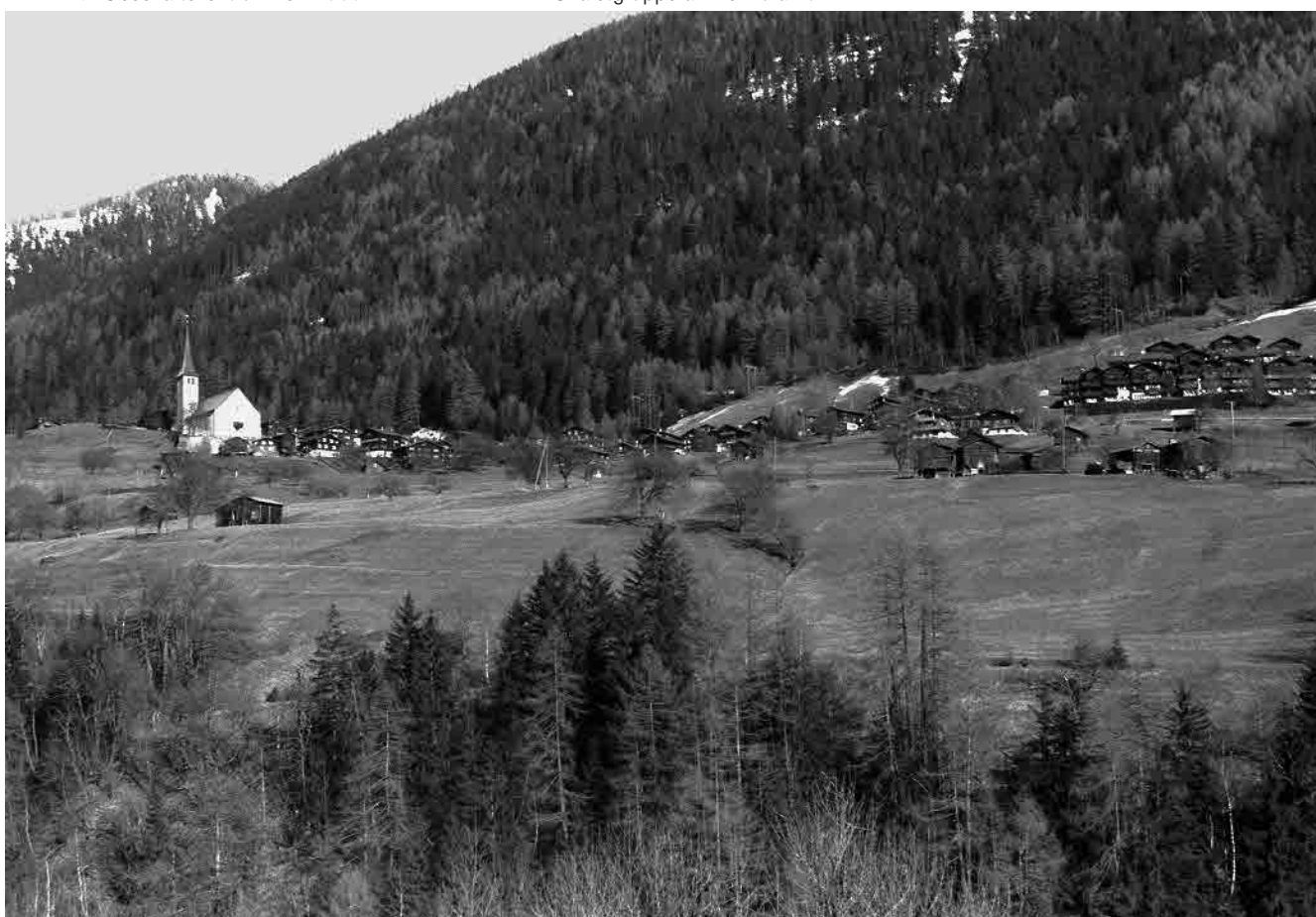
28 Kirchhügel und Feriensiedlung Aragon