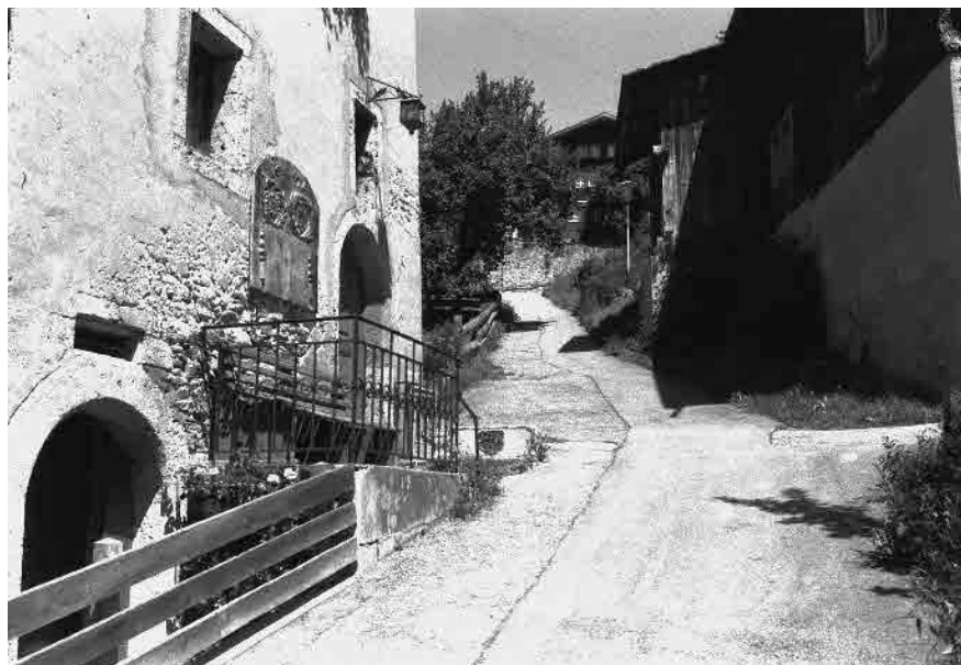
4 Alter Dorfzugang