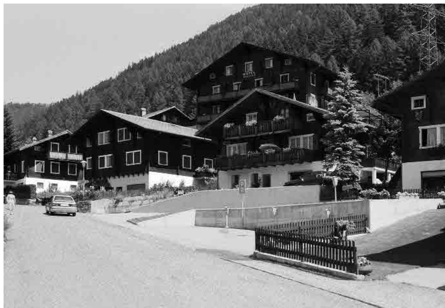
27 Chaletgruppe an Dorzufahrt