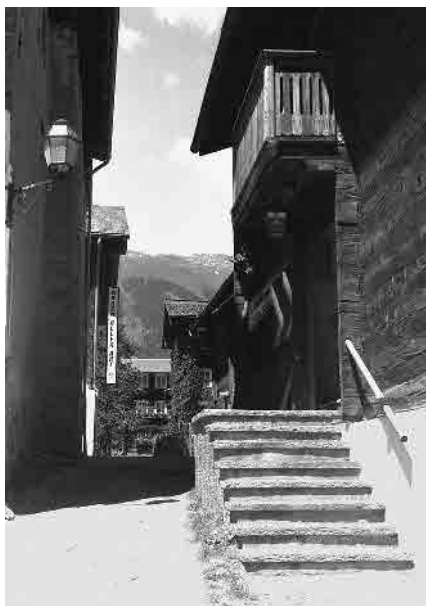
19 Hintere Hauptgasse

Gemeinde Ernen, Bezirk Goms, Kanton Wallis