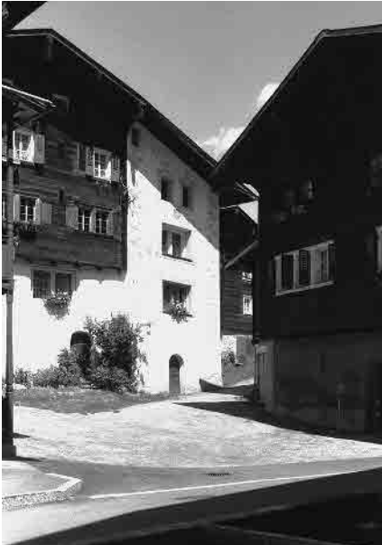
10 Unterer Hengert

Gemeinde Ernen, Bezirk Goms, Kanton Wallis