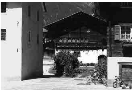
11 Tellenhaus von 1576