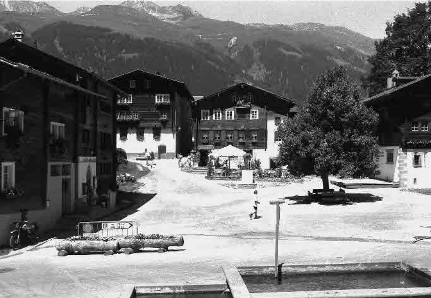
15 Dorfplatz 1996