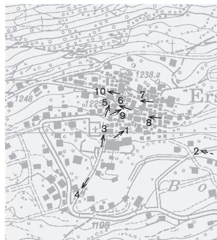
Fotostandorte 1:8000 Aufnahmen 1997: 1-10