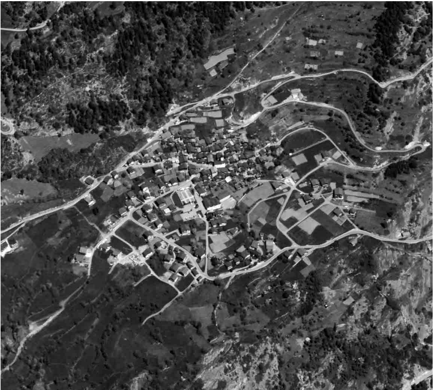
Flugbild 1995

Bergbauerndorf auf sonniger Terrasse am Leukerberg, 600 Meter über dem Talgrund, umgeben von parzellierten Äckern. Geschlossener Dorfkern mit gleich gerichteten Häusern und quer gestellter Kirche. Umgebungen in zunehmendem Masse zersiedelt.