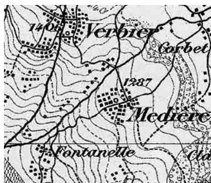
Carte Siegfried 1878

Occupant une plate-forme prise dans le versant escarpé, irriguée par deux cours d'eau, le site se caractérise par sa structure concentrée et son ensoleillement. Le tissu dense, parcouru par un réseau diversifié de voies étroites, est dominé par les constructions en madriers.