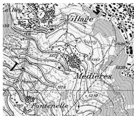
Carte nationale 1995