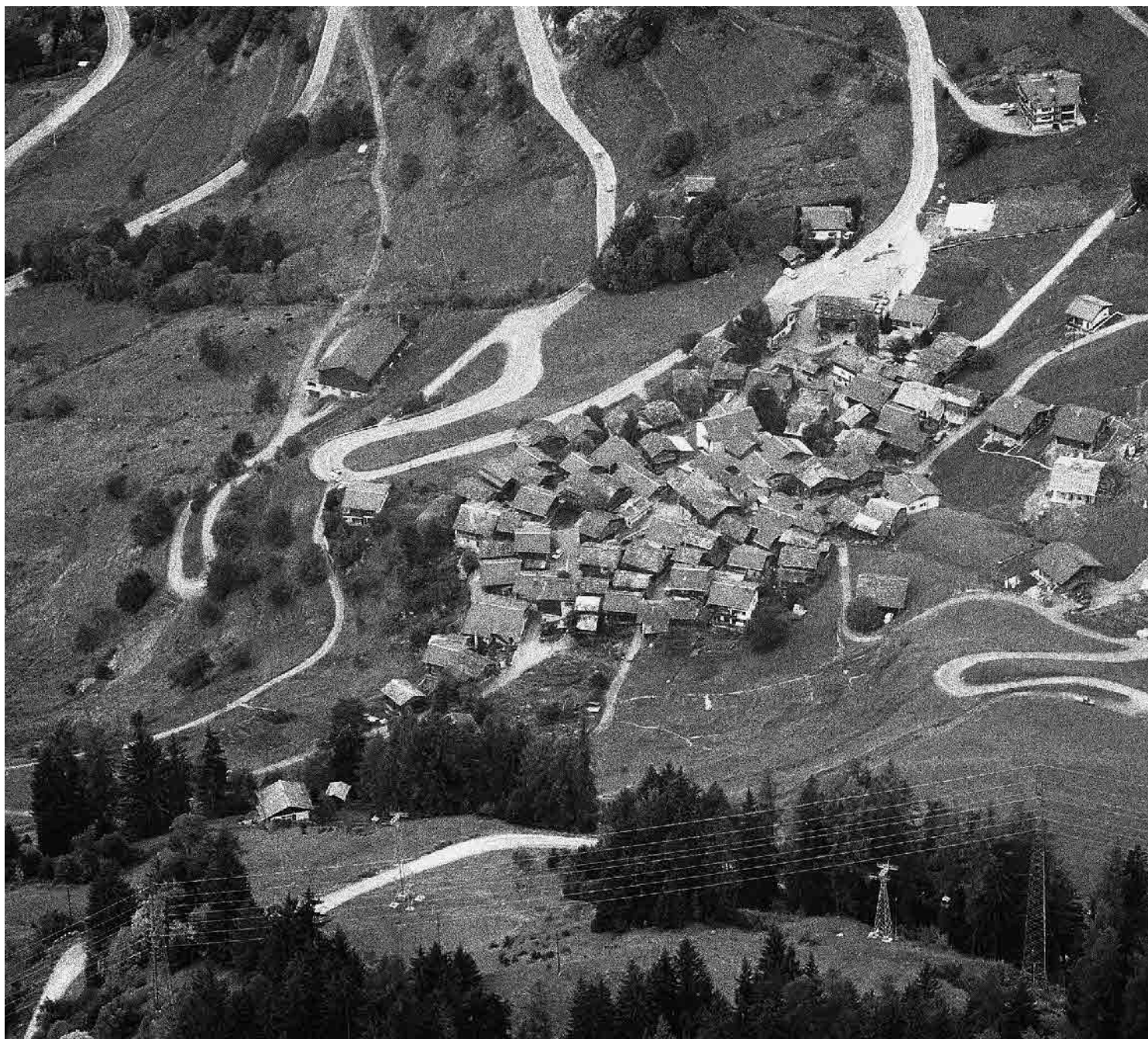
Photo aérienne Charles-André Meyer 1985, © SAT, Canton du Valais, Sion

Occupant une plate-forme prise dans le versant escarpé, irriguée par deux cours d'eau, le site se caractérise par sa structure concentrée et son ensoleillement. Le tissu dense, parcouru par un réseau diversifié de voies étroites, est dominé par les constructions en madriers.