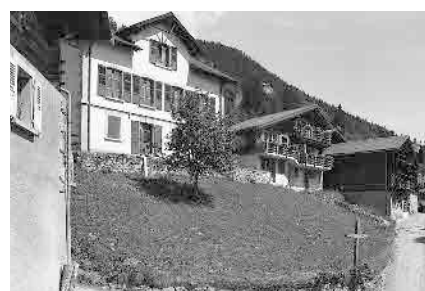
3 Ecole, 1908