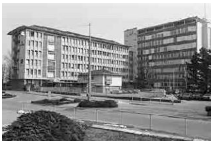
101 Uhrenfabrik Omega