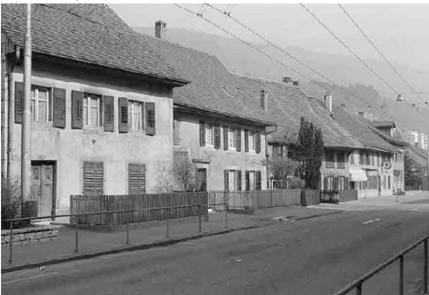
65 Bözingen, Ortskern