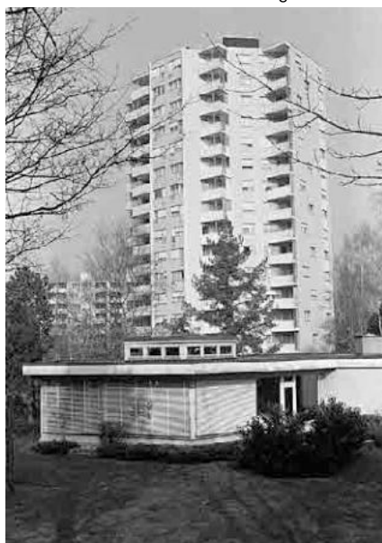
108 Hochhaus Jurintra