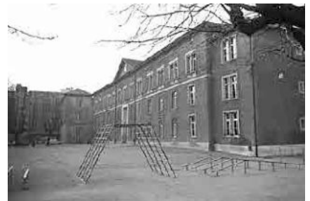
17 Schulhaus Dufour-Ost