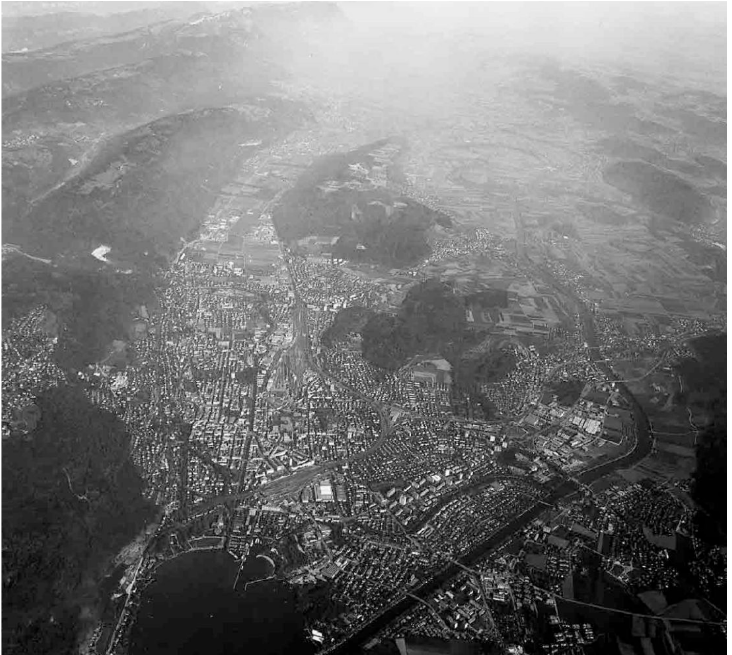
Flugbild Aerophoto 1989, © AGR, Kanton Bern

Uhrenmetropole am Jurasüdfuss, Hauptstadt des Seelandes. Mandelförmige Altstadt, barocke Promenaden zum See, zentraler Schüsskanal, planmässige Wohn- und Fabrikquartiere, gute Siedlungen um 1920–65. Gilt als Zukunftsstadt und als Hort des Gewöhnlichen.