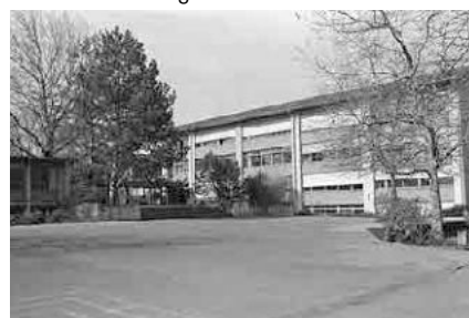
100 Schulhaus Schlossmatte