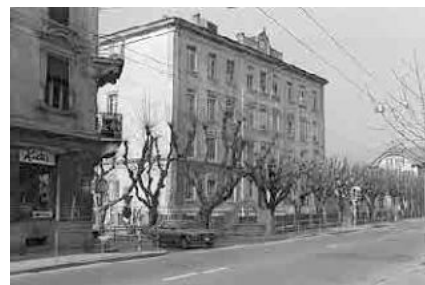
72 Schulhaus Madretsch