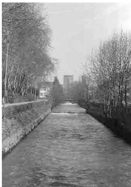
39 Schüsskanal, Omega-Fabrik