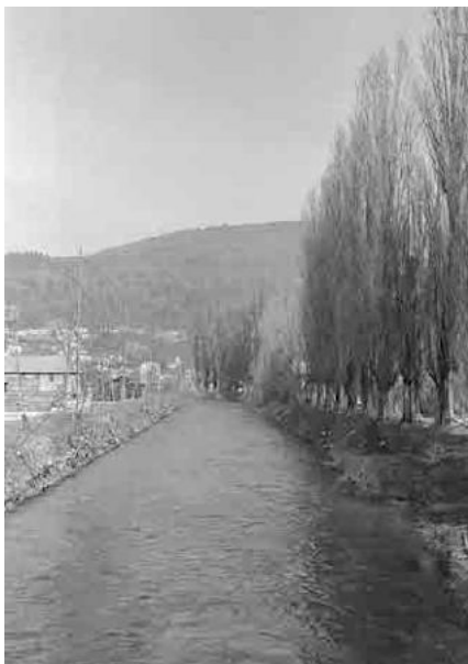
68 Schüss, Flusraum