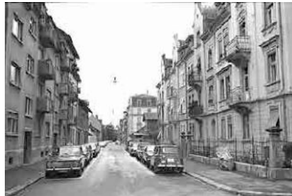
47 Ernst Schüler-Strasse