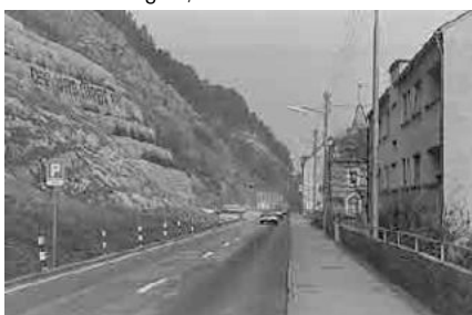
74 Vingelz, Neuenburgstrasse