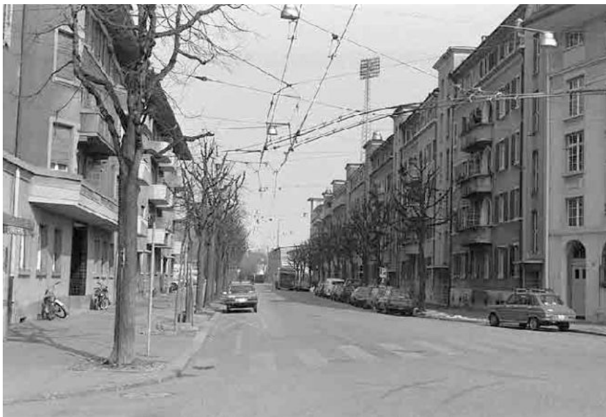
83 Gurzelen, Dufourstrasse