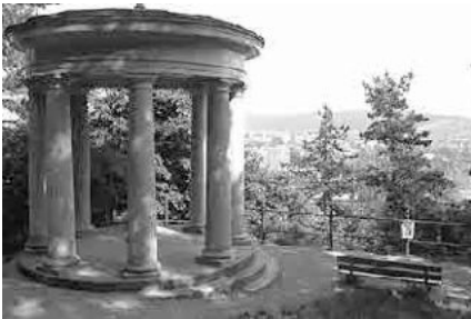
117 Aussicht vom Jurahang