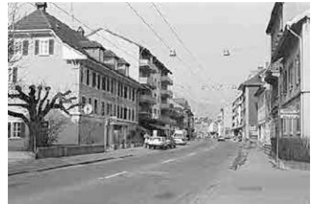
63 Bözingen, Ortskern