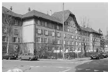
54 Kommunsiedlung im Wasen