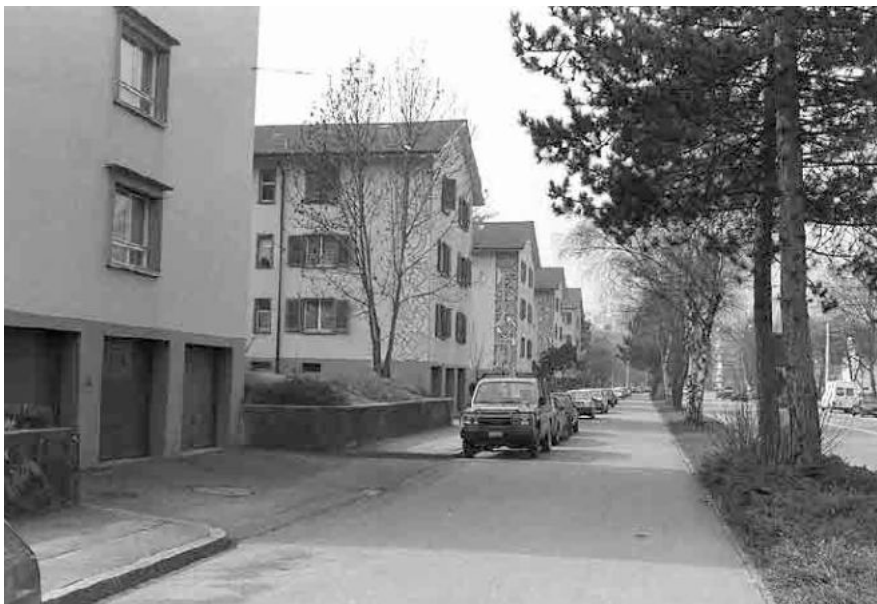
92 Orpundstrasse, Genossenschaftssiedlung Monbijou