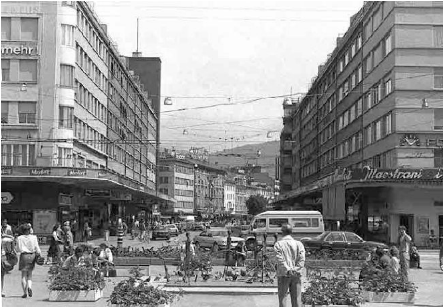
76 Bahnhofplatz, Bahnhofstrasse