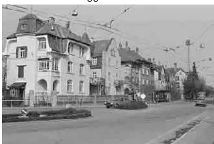
57 Jakob Stämpfli-Strasse