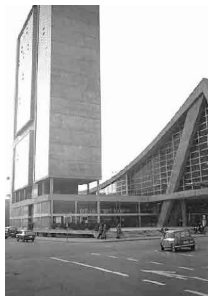
109 Kongresshaus und Hallenbad