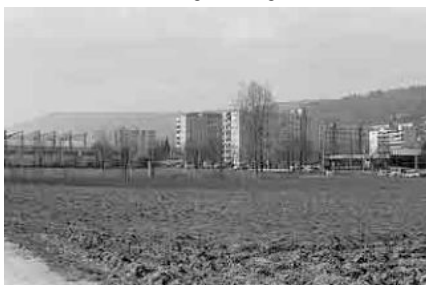
104 Stadtrand Bözingen