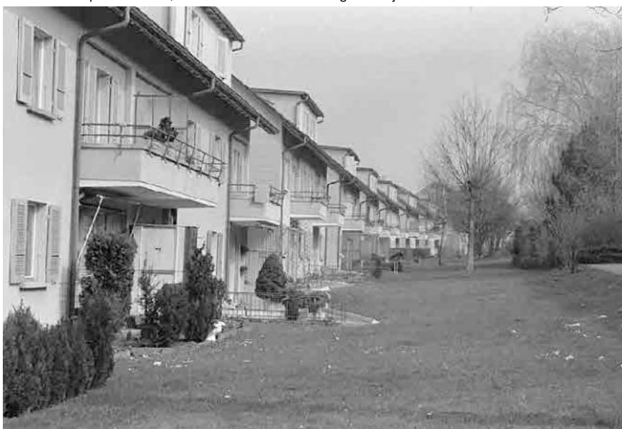
95 Genossenschaftssiedlung Flurweg