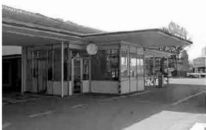
102 Portierloge Omega