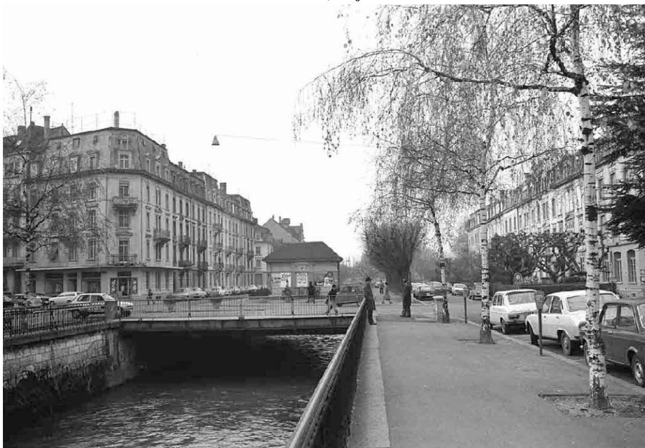
42 Unterer Quai