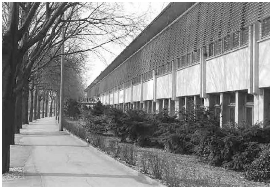
103 Ehem. Uhrenfabrik Bulova