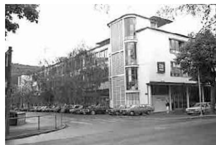
91 Ehem. Montagehalle GM