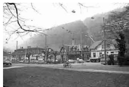
28 Seedorf, «Paradiesli»