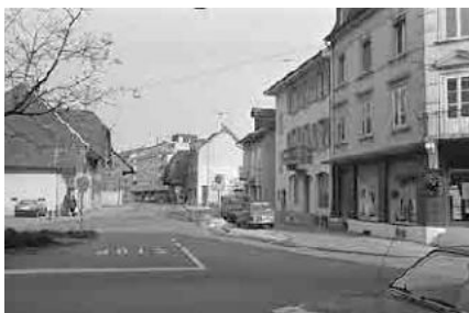
70 Mett, Poststrasse