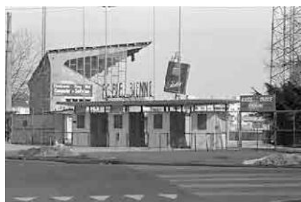
99 Stadion Gurzelen