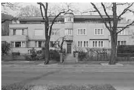
89 Villa Ländtestrasse