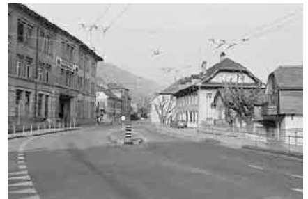
64 Ehem. Drahtwerke Bözingen