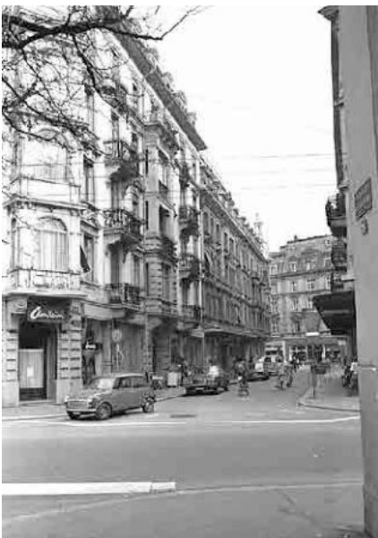
35 J. Sessler-Strasse