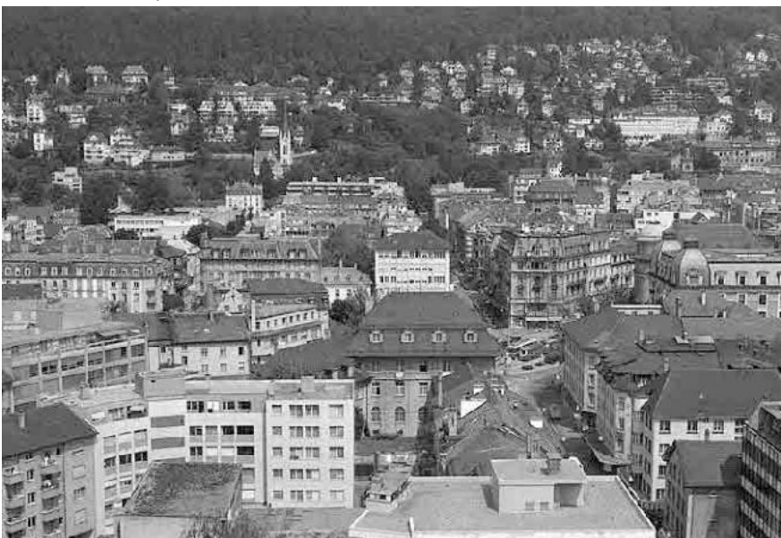
111 Aussicht vom Kongresshaus