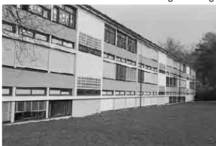
98 Primarschulhaus Linde