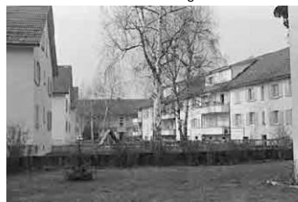
97 Wohngenossenschaft Solidarität