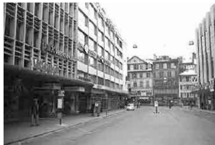
16 Blick gegen Nidaugasse