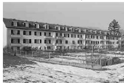
85 Eisenbahnersiedlung Rennweg