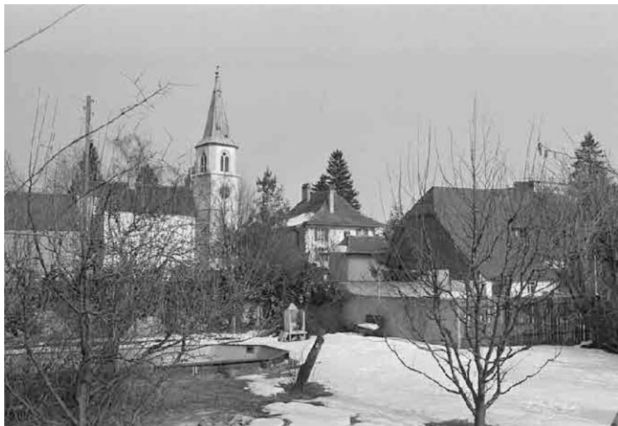
69 Mett, Ortskern