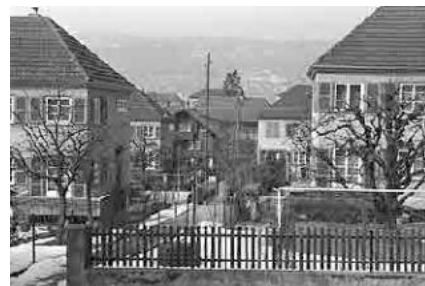
84 Kolonie Dählenweg