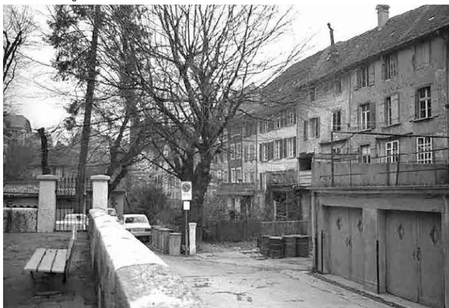
9 Altstadttrand Schützengasse