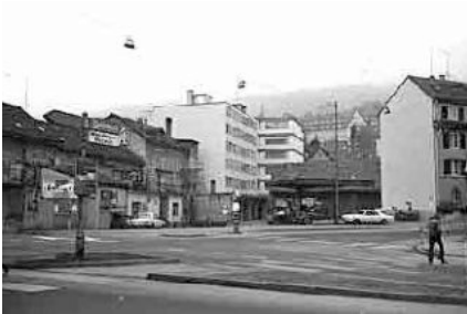
13 Adam Göuffi-Strasse