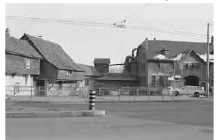
66 Gewerbebauten an Schüss