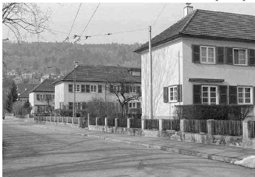
88 Gartenstadt Champagne