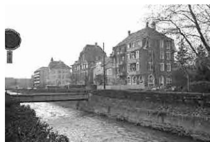
40 Oberer Quai