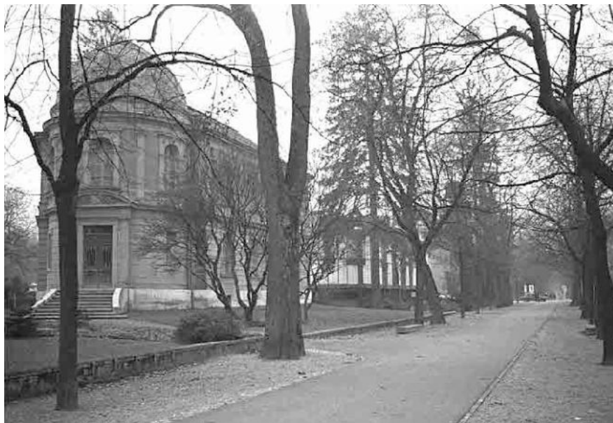
23 Seedorfpromenade und Museum Schwab