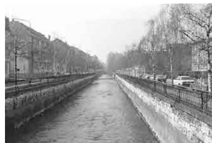
41 Oberer Quai