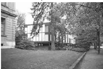
26 Promenade mit Wohnheim