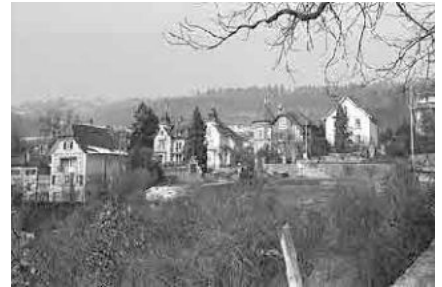
61 Villen Schützengasse