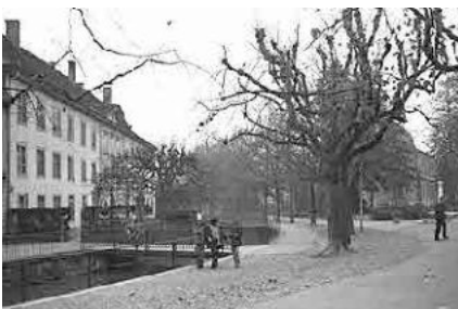
19 Ehem. Indienne-Manufaktur