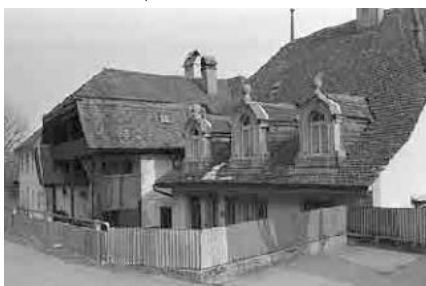
73 Vingelz, Bielhaus