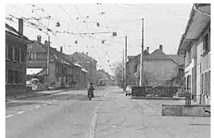
67 Bözingen, Ortskern