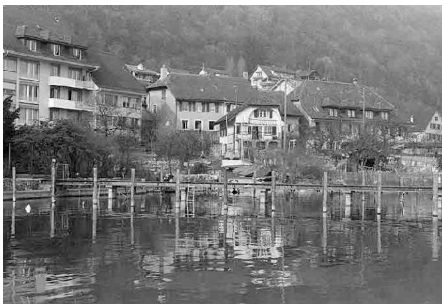
75 Vingelz, Ortskern