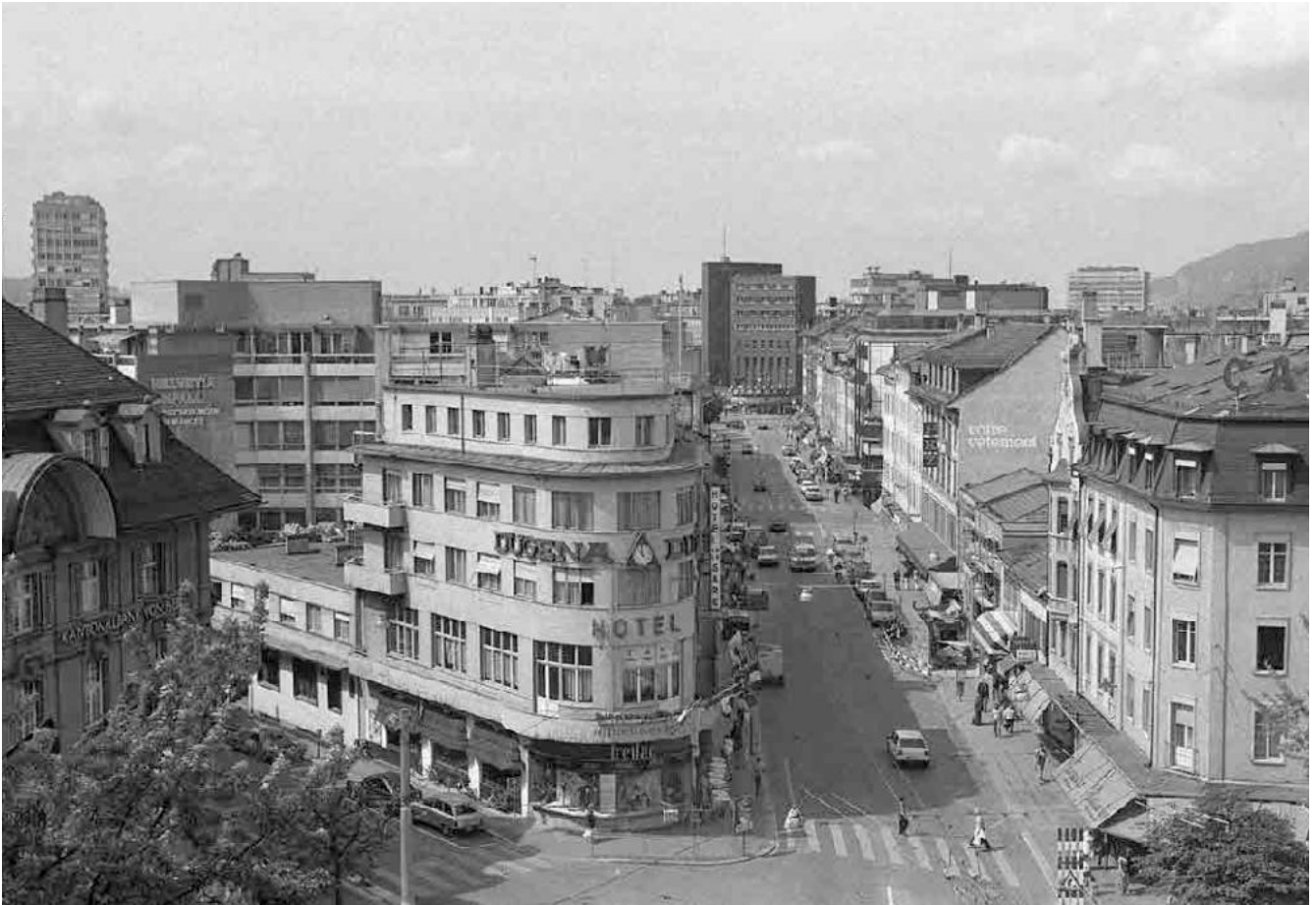
110 Zentralplatz, Bahnhofstrasse