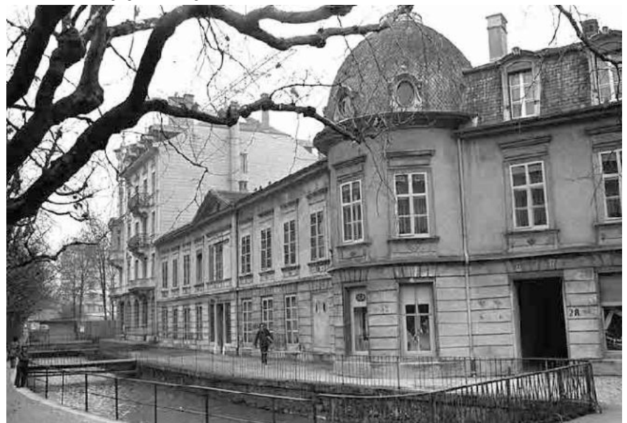
20 Museum Neuhaus