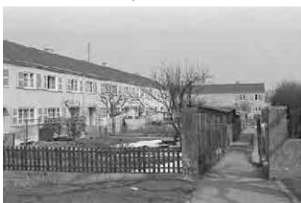
86 Kolonie Mööslacker