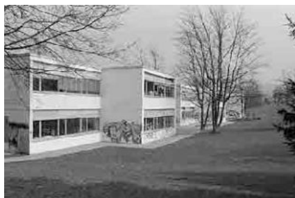
105 Schulhaus Battenberg