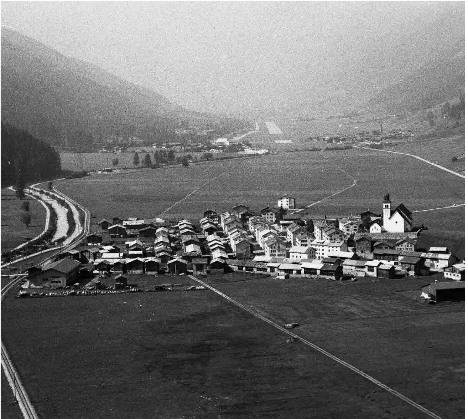
Flugbild Klaus Anderegg 1984, © DHDA, Kulturgüterschutz, Kanton Wallis, Sitten

Nach dem Dorfbrand von 1868 vollständig wieder aufgebautes Bauerndorf im obersten Teil des Goms. Unterscheidet sich von den andern Siedlungen der Region durch seine planmässige Anlage, den Zeilenbau und den hohen Anteil an Steinbauten. Typologisch: «bäuerliches La Chaux-de-Fonds».