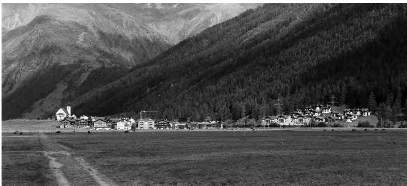
23 Obergesteln und Feriensiedlung Schlüsselacker