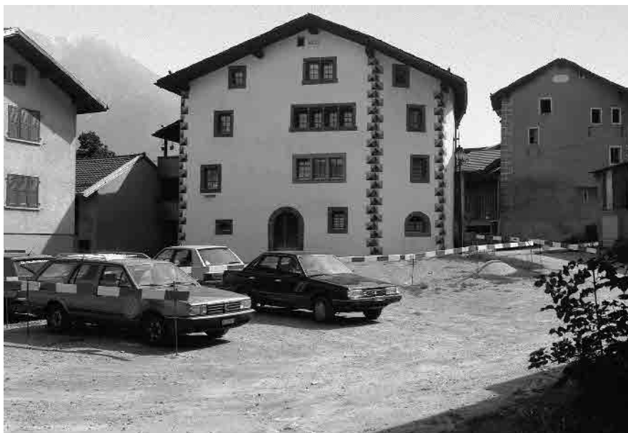
12 Steinhaus, dat. 1602