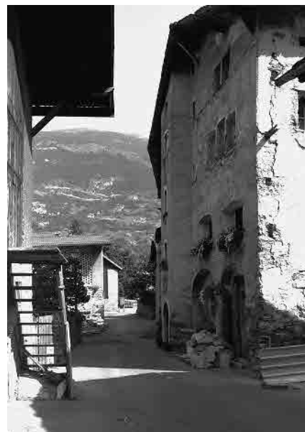
13 Bielerhaus, dat. 1656