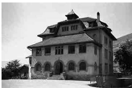
22 Schulhaus von 1914