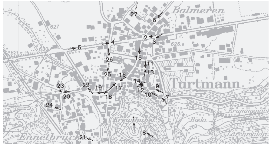
Fotostandorte 1:8000 Aufnahmen 1976: 22 Aufnahmen 1997: 1-21, 23-27