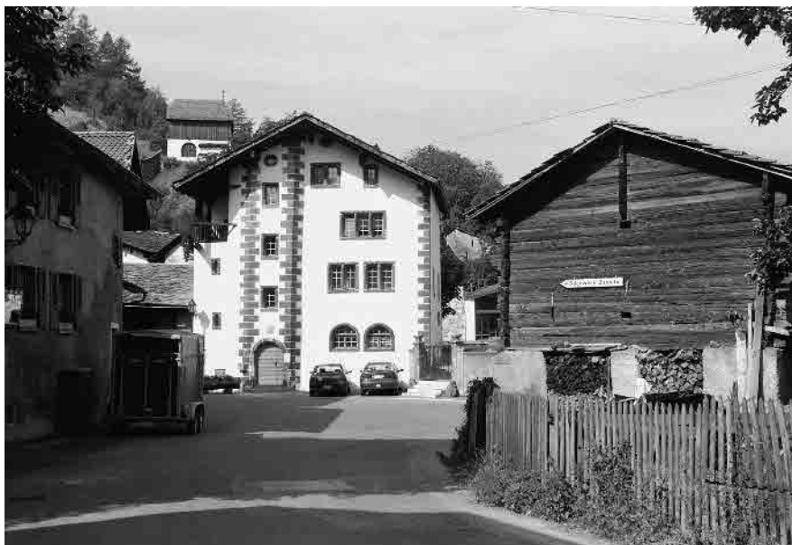
20 Wäbihaus von 1648