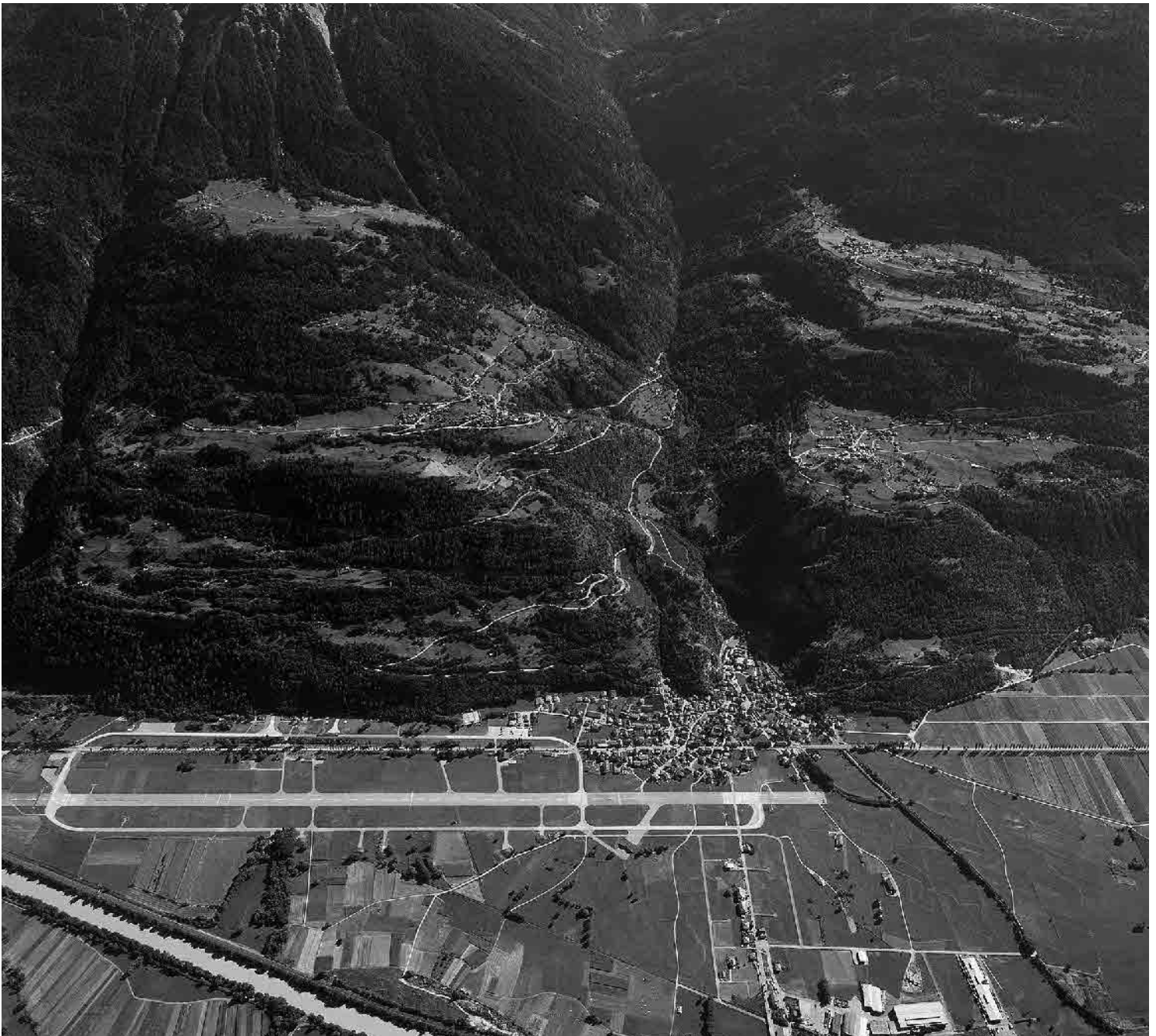
Flugbild 1997

Grosses Haufendorf am Ausgang des Turtmantals und am Rand der Rhoneebene. Dorfkern mit herrschaftlichen Steinhäusern des 17. Jahrhunderts. In der Ebene ältester Abschnitt der Napoleonstrasse durchs Rhonetal. Militärflugplatz als Riegel gegen die Zersiedlung.