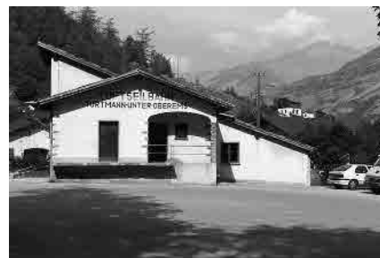
21 Station Luftseilbahn