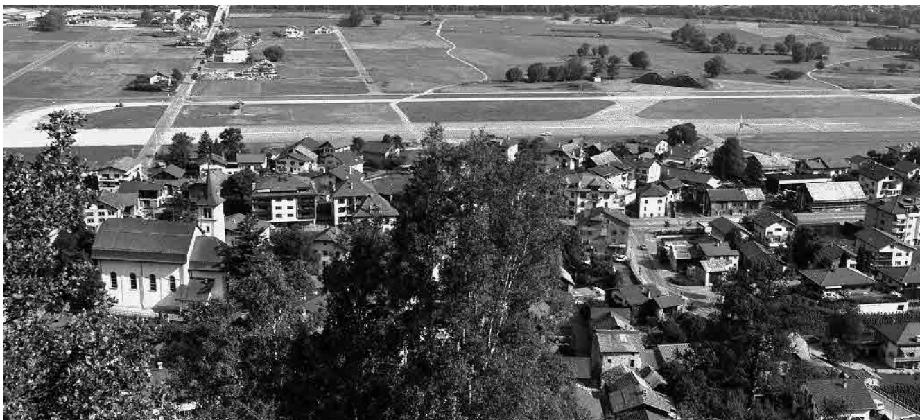
1 Dorf und Flugplatz